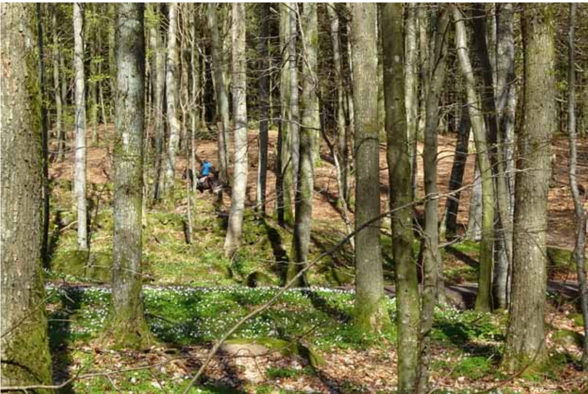
Snapphanar i bokskogen? Osbecks bokskog.

Den första riktiga fågellokalen för dagen hette Klarningen, som ligger norr om östra Karup (i Skåne). Vår väg dit ledde längs en liten traktorväg parallellt med E6. Det såg antagligen inte klokt ut för motorvägstrafikanterna där vi kom puttrande sakta mitt i åkern. Vi kände oss allt litet undrande över vägvalet och om det skulle leda någonstans. På vägen dit passerade vi under E6 och där, på ett par rostiga traktorskopor, satt en svarthakad buskskvätta som ingen hade larmat eller rapporterat. Ett ädel-X alltså! En "vanlig" buskskvätta satt på den mindre skopan. Ett par storspovor födosökte på åkern och från fågeltornet såg vi bl.a. en rödspov, grönbenor, bläsänder, skedänder och gråhakedopping.