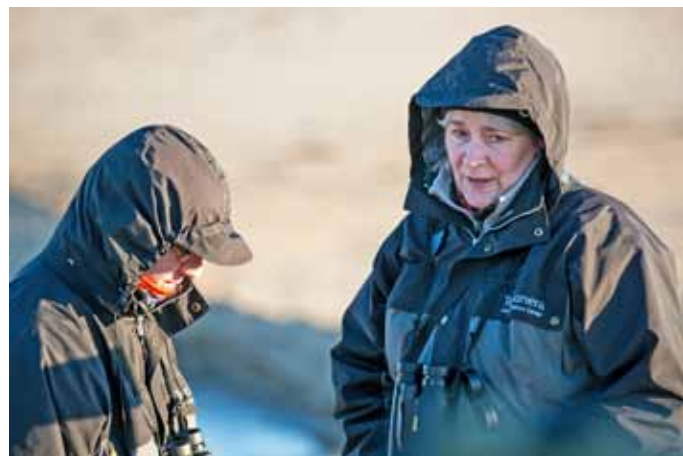
...den kanske fryser litet, som de här två, för trots att solen lyste över oss, så måste vi ändå erkänna att det var litet svalt emellanåt!