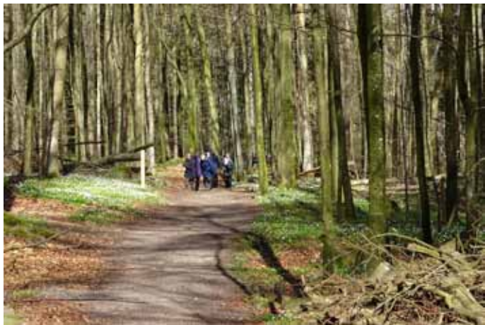
Vandring i den skira bokskogen.

Rakt österut (nu var vi åter i Halland!), på Hallandsåsens nordsluttning, fann vi Osbecks bokskogar där vi hade fått tips om att en brandkronad kungsfågel höll till. I början av stigen pratades det om att det var lämplig miljö för grönsångare och efter bara några hundra meter hörde vi den! Vi vandrade i sakta mak genom den skira bokskogen där vitsipporna trivdes. När vi gått över en liten bro hördes först två sjungande individer och sedan hittade vi snart en bkk högt uppe i granarna. Den satt inte still långa stunder, så det var ganska lätt att få syn på den, men nästan omöjligt att hinna se ögonbrynsstrecket. Här var det många som fick Sverigekryss. Innan vi avlägsnade oss hann vi få en fin obs på en överflygande fjällvråk.