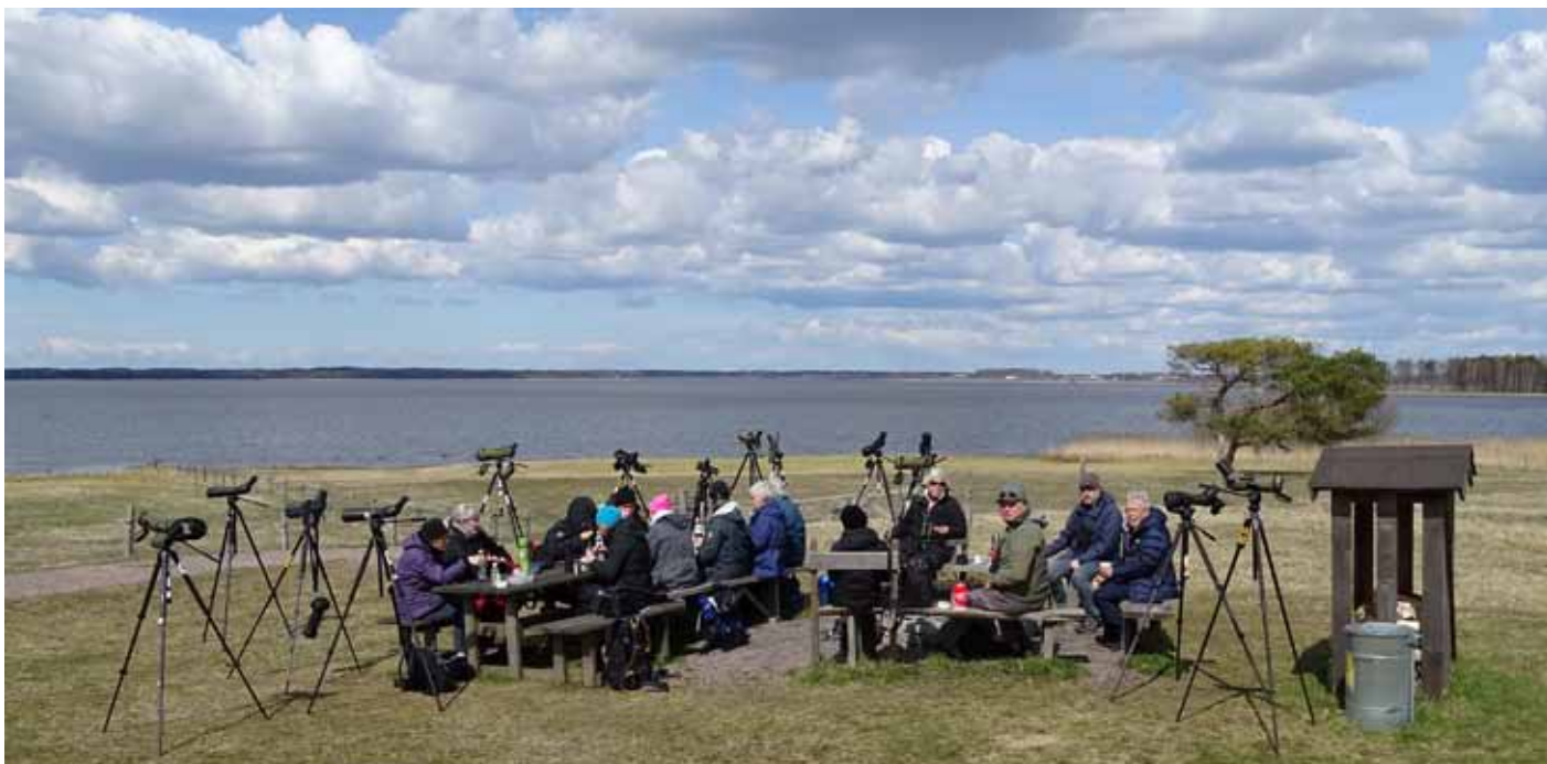
Lunch vid Hornborgasjön