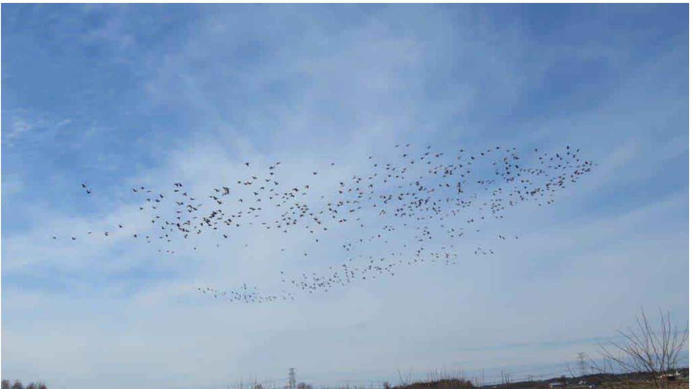
Uppfloget, orsakat av en havsörn, som avslöjade att vi hade fått en nästan ren flock spetsbergsgäss framför ögonen.

Där observerades ett stort antal sädgäss på mycket långt håll. Tyvärr flög de upp när en havsörn kom seglande över dem. Men det visade sig vara till fördel, för när de gjorde en runda, kom de flygande nästan rakt över oss och då såg vi att det var några vitkindade gäss med och sädgässen var inte sädgäss utan spetsbergsgäss! Ingen av oss har sett mer än 5-10 spetsbergare samtidigt tidigare och här kom en nästan ren flock på 400! Minst sagt oväntat. Övriga arter, typ gulsparrv, buskskvätta, sångsvan, kricka och sångsvan kändes litet vardagliga. För de flesta av deltagarna var lokalen en ny och trevlig bekantskap.