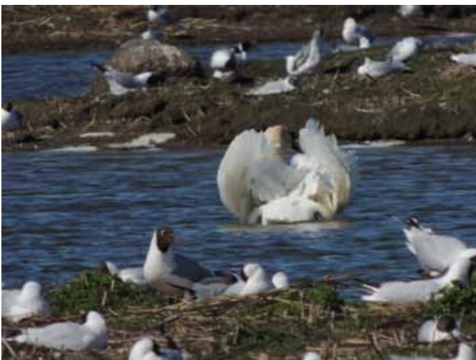
Knölsvanen fluffar upp sig.....

Från den bortre Obs-platsen såg vi rödspovar, rödbenor och storspovar bland alla sothöns och änder.