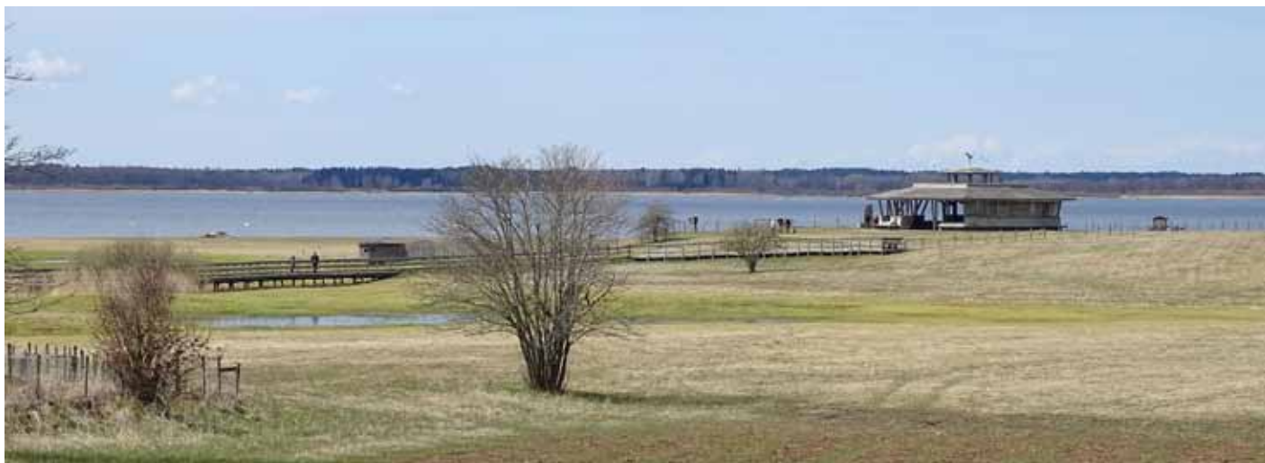
Där - ute till höger höll den svarthalsade doppingen till.

Vid Hornborgasjön stannade vi först vid Fågeludden och vandrade raskt en bit ned mot stranden. På fint avstånd kunde vi studera de svarthalsade doppingarna som var det stora målet här. Även svarthakedopping, gråhakedopping och skäggdopping visade upp sig. Några sjöorrar på håll förtjänar också att nämnas. Medhavd lunch intogs innan vi for till Ytterbergs udde för att förhoppningsvis få se en ägretthäger som rapporterats därifrån. Den behagade inte visa sig, men dvärgmå, drillsnäppa, knipa och skedand kunde läggas till artlistan.