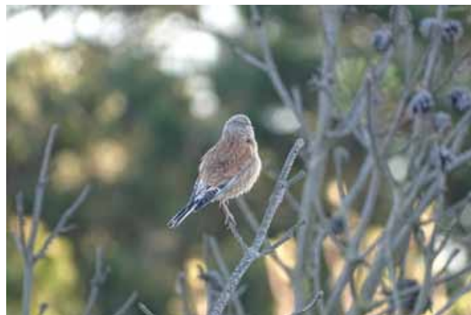
Nåja, så helt fågelfritt var det ju inte. Den fina fasantuppen och hämplingen, som vänder ryggen mot fotografen Ola Andersson fanns där.

Nu måste vi börja dra oss norrut. Vi beslöt oss för att passera Getterön för att säkra dammsnäppan vid Båtafjorden, som ligger på höger sida om vägen mellan Bua och Ringhals. Efter litet hjälp av skådare på plats fann vi dammsnäppan på långt avstånd. Ingen njutobs, men den var vänlig nog att stå bredvid en gluttsnäppa för jämförelsens skull. En del av gänget stod nedanför tornet och fick se en dammsnäppa till stående mitt i sjön på ett mycket fint skådaravstånd. Nu var den kryssbar på riktigt! Ett par svarthakad buskskvätta bakom ryggar på oss, stal showen från snäppan.