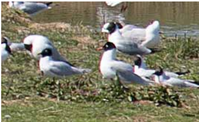
Svarthuvad mås på omöjligt fotoavstånd

Larssons våtmark är en nyanlagd fågellokal alldeles nära E6 en mil söder om Halmstad. Den var klar så sent som 2014 och i år har ett par svarthuvade måsar fattat tycke för platsen. De uppträdde hemtamt och hade uppenbarligen kommit på den goda tanken att häcka på en av öarna. Kanonobs på en sällsynt fågel, men avståndet var långt för kamerorna, så någon kanonbild fick vi inte. Det var mycket gott om fåglar på den lilla lokalen.