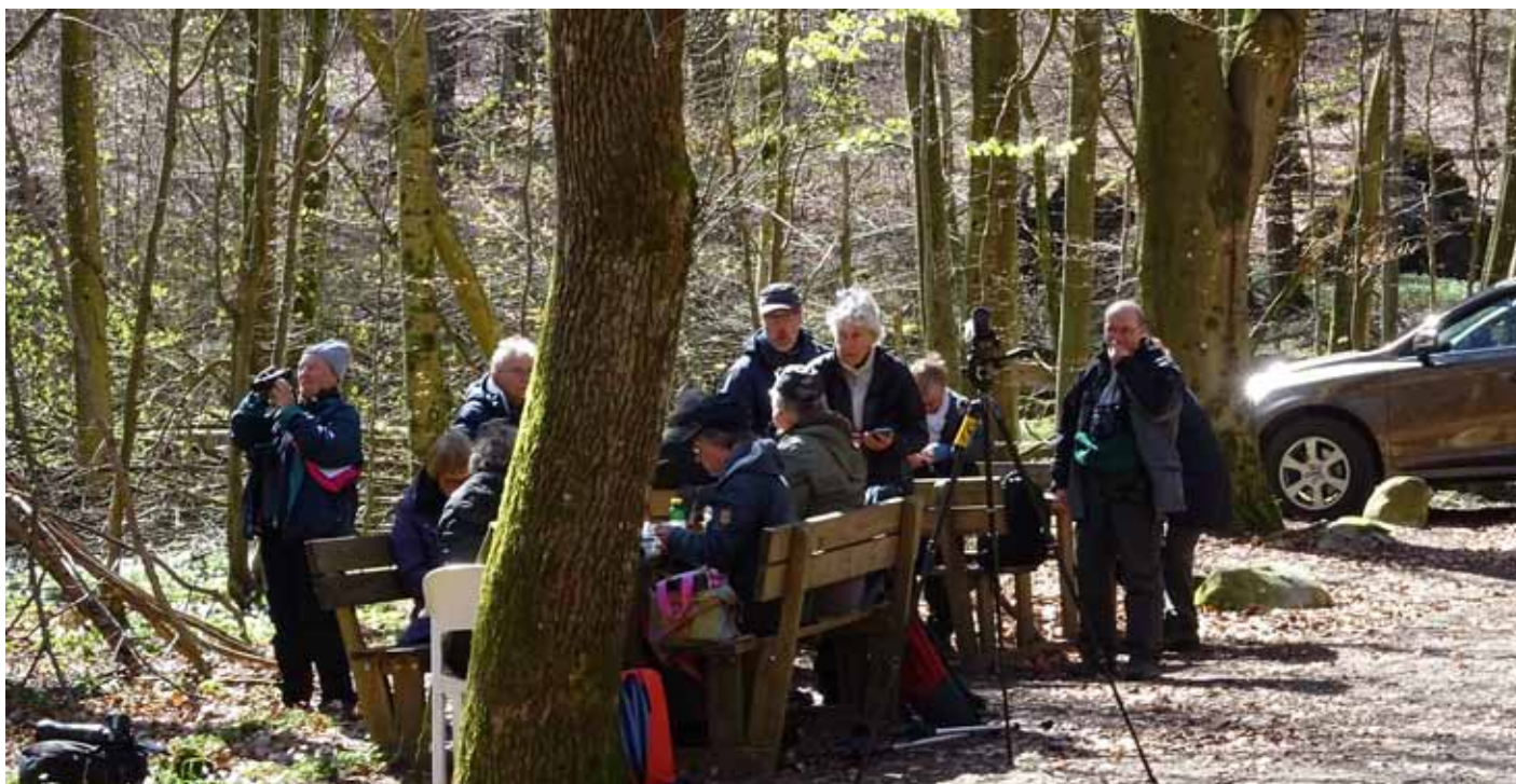
Lunch i bokskogen