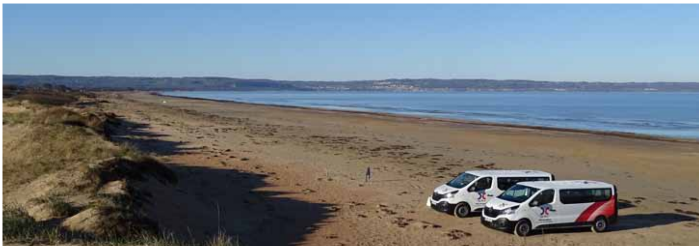
Det kändes litet konstigt att åka bil på badstranden, men det motiveras av lokalbefolkningen med att byn annars skulle bli en parkeringsplats.

Upp 03:30, iväg 04:40 till stranden, den enda stranden i Sverige där man får köra bil. Vi parkerade direkt och skuttade upp på dynerna. Småtärna, småskrake, skärfläcka, silvertärna, kentsk tärna och en svarttärna passerade och svärter, sjöorrar, gråhake- och svarthakedopping guppade omkring på vattnet. Bland småfåglar kan nämnas trädpiplärka, ängspiplärka och ärtsångare.