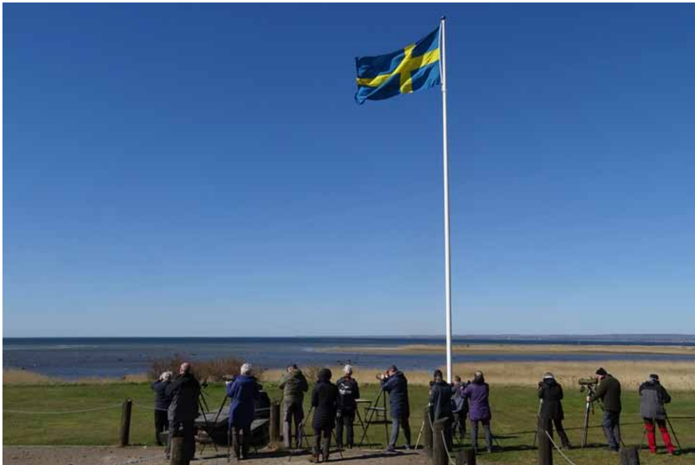
Prydligt uppradade skådare vid Utvälinge.

Vi avrundade dagens skådning med en halvtimmes besök vid den välbekanta och närbelägna lokalen Sandön, Utvälinge vid Skälderviken. Vi hann njuta av myrspov, skärfläcka, svartsnäppa, kentsk tärna m.m. m.m. Utvälinge är alltid värt ett stopp.