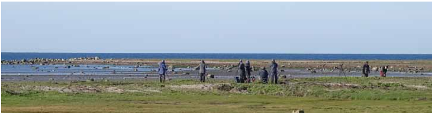
Ett ovanligt fågelfritt Korshamn.