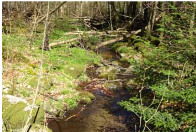
Bäckarna var många.