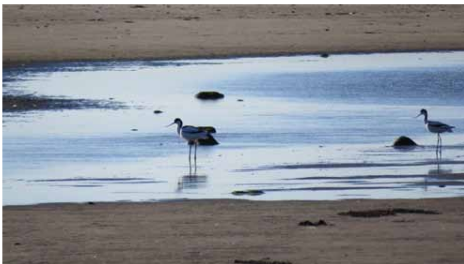
Skärfläckor. Alltid lika förunderligt vackra.