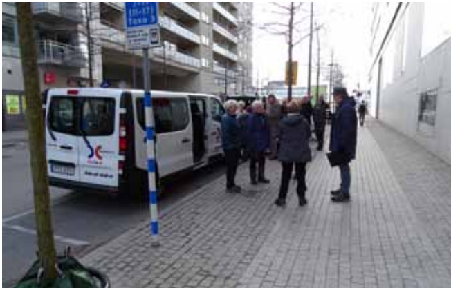
Minibussarna vid Liljeholmen.

Sexton ivriga skådare med tubkikare i bagaget gav sig av mot Mellbystrand en kylig lördagsmorgon i slutet av april. Väderprognosen gjorde oss försiktigt optimistiska. Efter ett ganska tråkigt väderläge på Västkusten skulle vi få kyliga morgnar, svaga vindar (som möjligen skulle komma från fel håll) och full sol från gryning till skymning. Det lät ju fantastiskt!