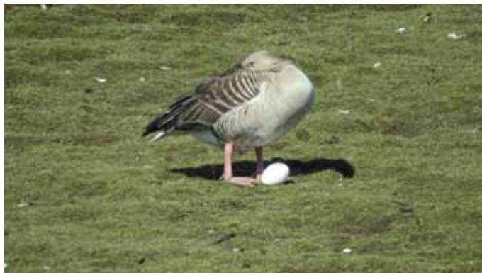
Mitt ägg? Näääej, det kan jag väl inte tro!