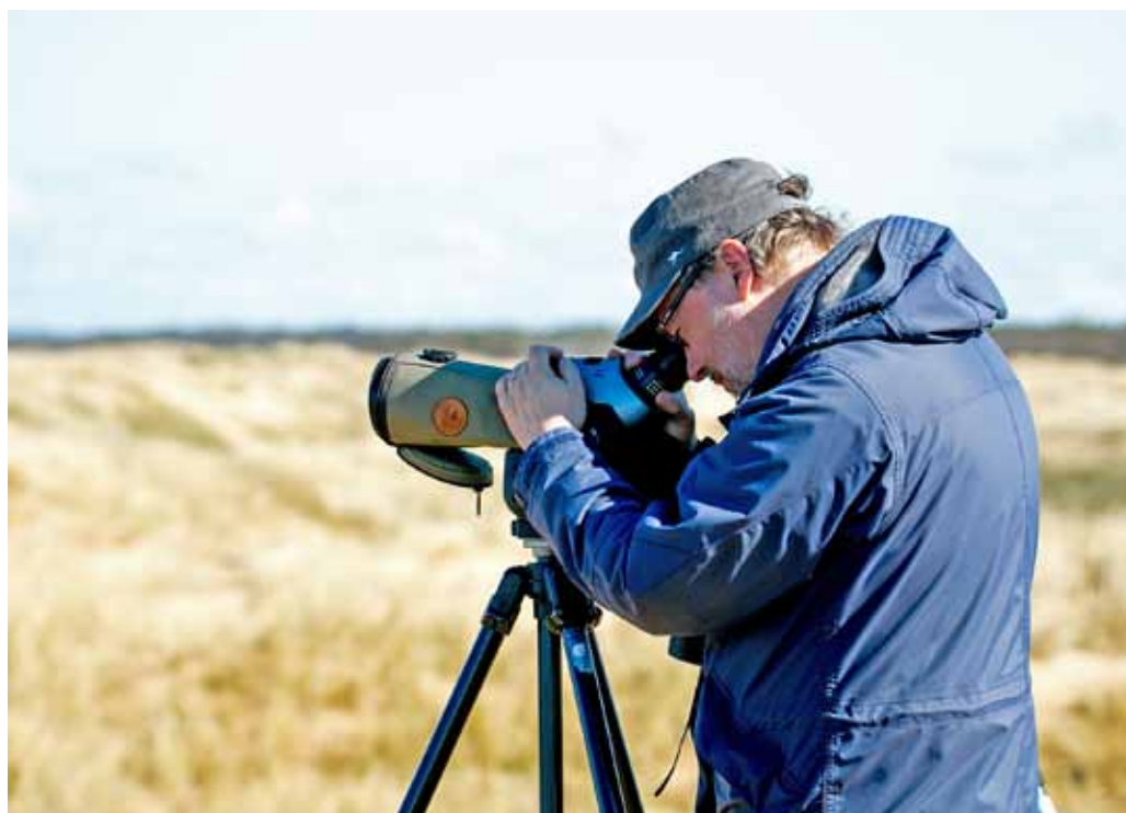
Inte heller Erik får någon matro.