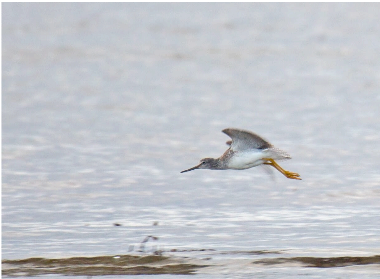
Den större gulbenan på väg mot oss.

Torekovs hamn – på sydspetsen av Svarteskär, en klippa sydväst om hamnen, fann vi tre toppskarvar bland alla storskarvar, med tydliga tofsar i vackraste solsken. En skärpiplärka och en skärsnäppa höll till på skärets norra del. På en klippa söder om Hallands Väderö upptäcktes två pilgrimsfalkar. Flockar med tobisgrisslor passerade på långt håll.