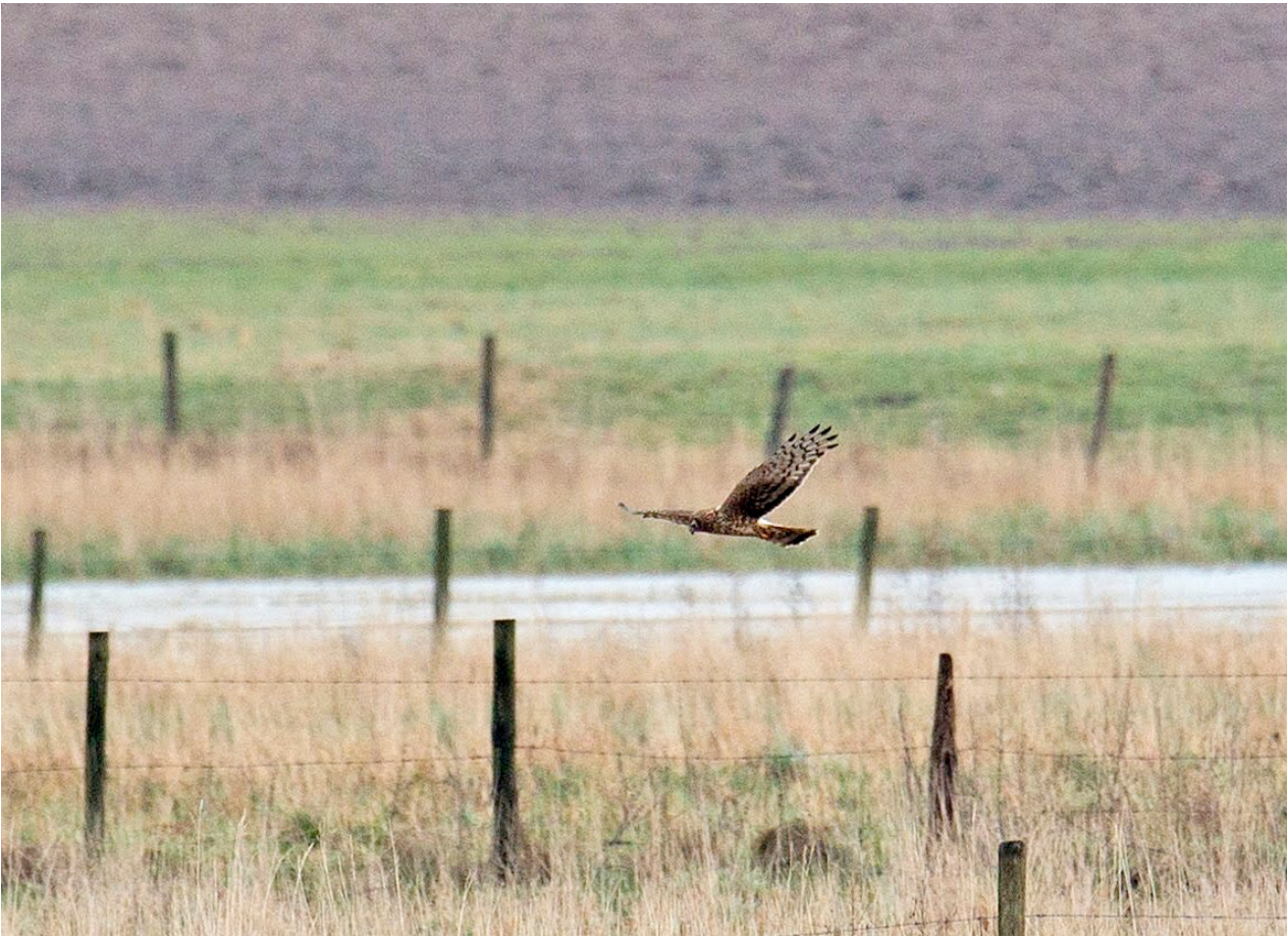
Blå kärrhökshona på jakt efter mat nära kornsparvarna vid Hammar.

Hammar – en flock om minst 50 kornsparvar rörde sig mellan raden av hamlade pilar och träddungar längre åt öster. Rovfåglar siktades åt olika håll i det öppna landskapet.