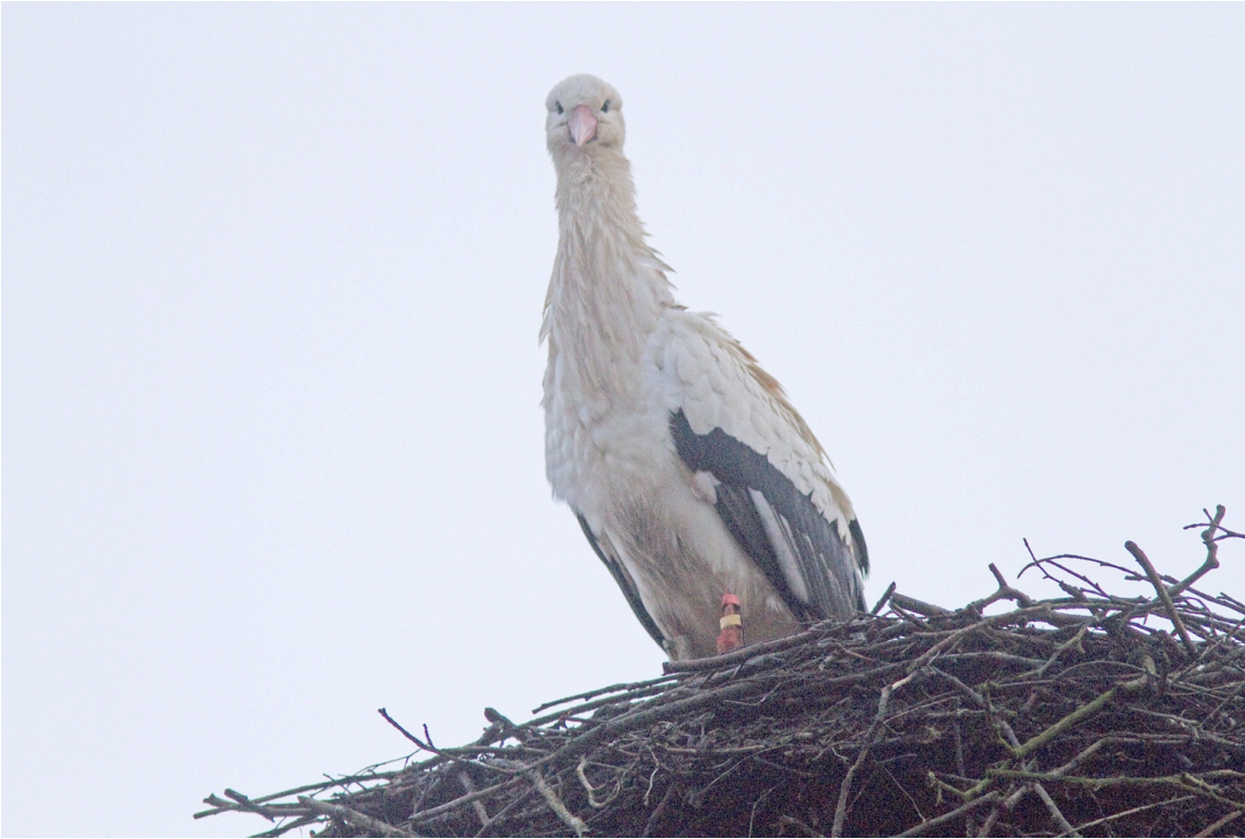
Vi sågs vid Flyinge kungsgård.

Hardeberga stenbrott – vi anlände strax efter solnedgången, efter en stunds väntan syntes en berggöv sitta på taket till en industribyggnad och hoa på andra sidan brottet.