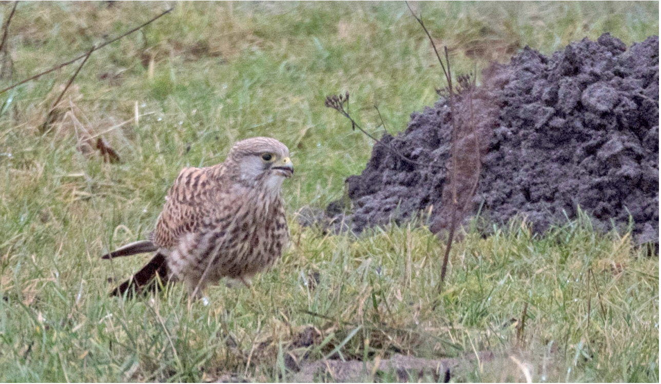
Tornfalken siktades invid vägen och kunde foograferas från bussen.

Vombs ängar – larmade arter (ägretthäger, skogssnäppa, gäss) syntes inte till. På väg från ängarna spatserade en vit stork invid vägkanten och framme vid väg 11 kunde stora mängder gäss tubas in, bl a säd- och blåsgäss.