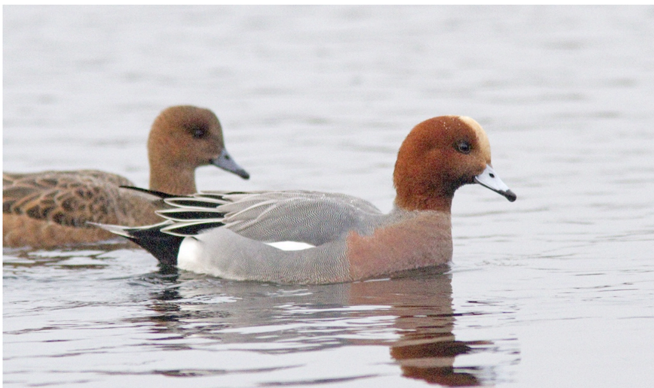
Bläsänder i en av dammarna vid Lunds reningsverk.

Lunds reningsverk – som vanligt mängder med fågel i de tillsammans 1,5 km långa dammarna, framför allt änder och smådoppingar.