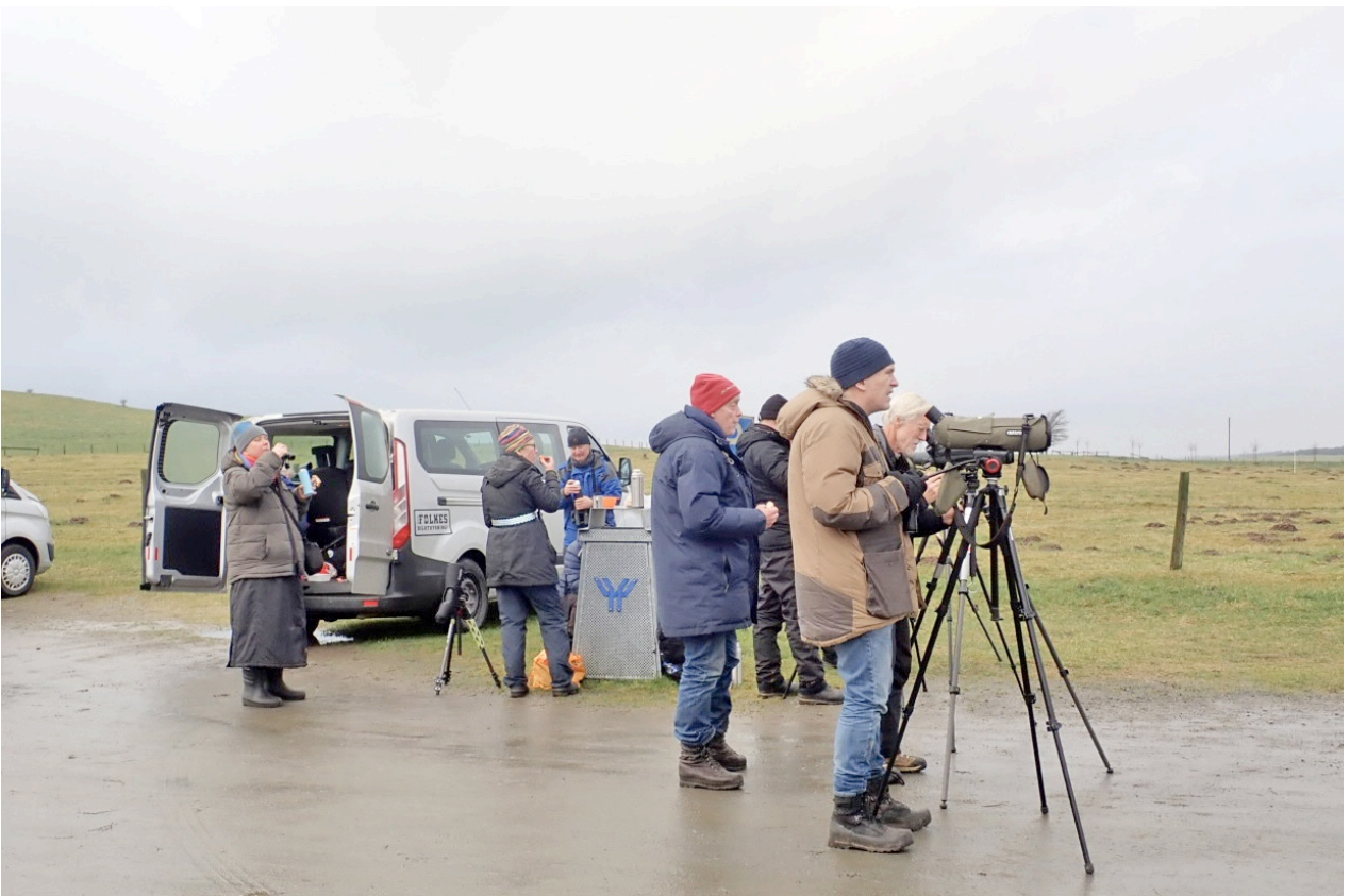
Fika och skådning vid Ingelstorps ängar (Kabusa)

Ingelstorps ängar – de förväntade gässen var någon annanstans. Men vi fick flera obsar på rovfågel som fjällvråk, blå kärrhök, havsörn och röd glada.