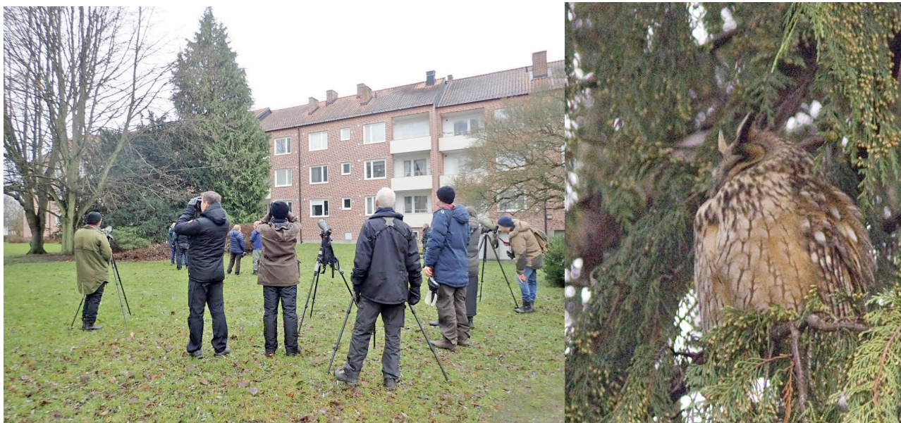
Den kända tujan vid van Dürens väg i Lund och en av hornugglorna.