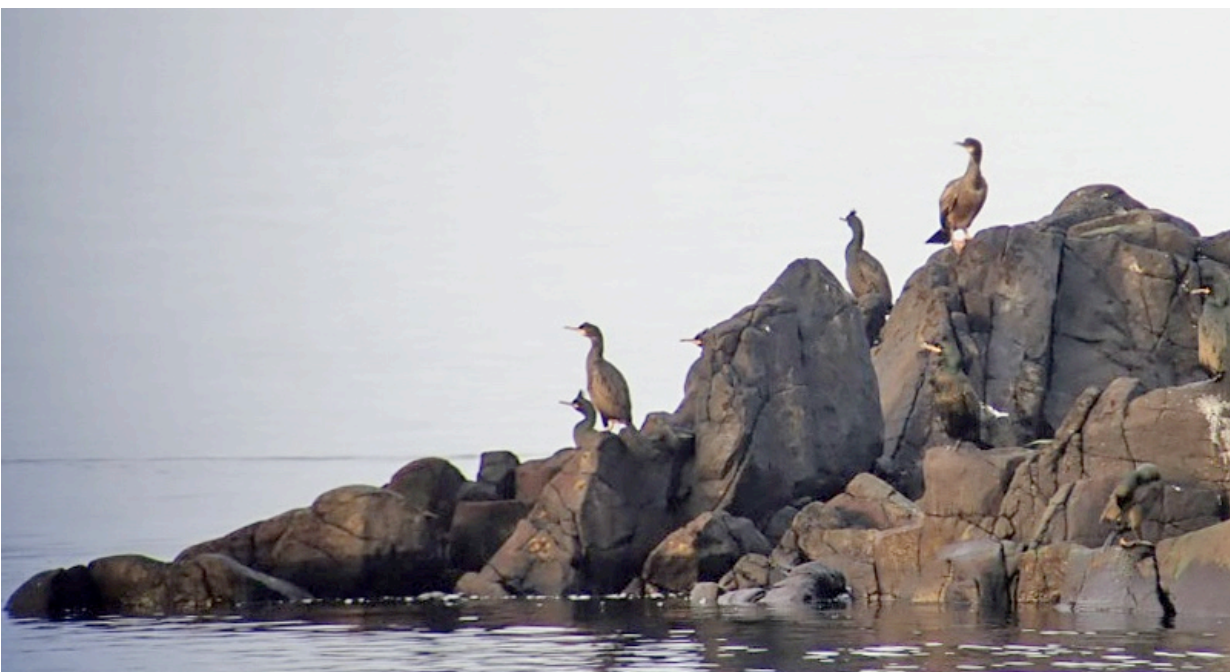
Toppskarvar med tydliga tofsar på Svarteskär utanför Torekov.

Dagen inleddes i mörker med sträckkörning upp till Bjärehalvön, drygt 15 mil, dit vi ankom lagom till första skådarljuset c:a 08:15.