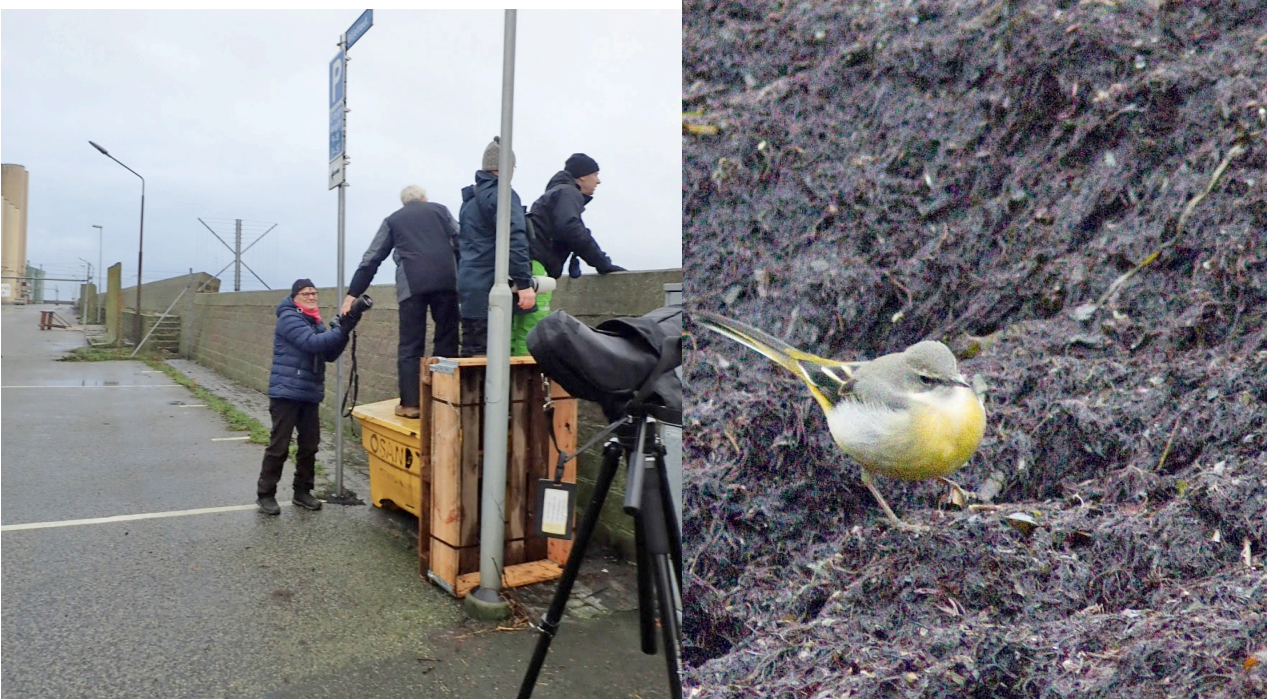
Bakom piren i Ystads småbåtshamn sågs forsärlan.