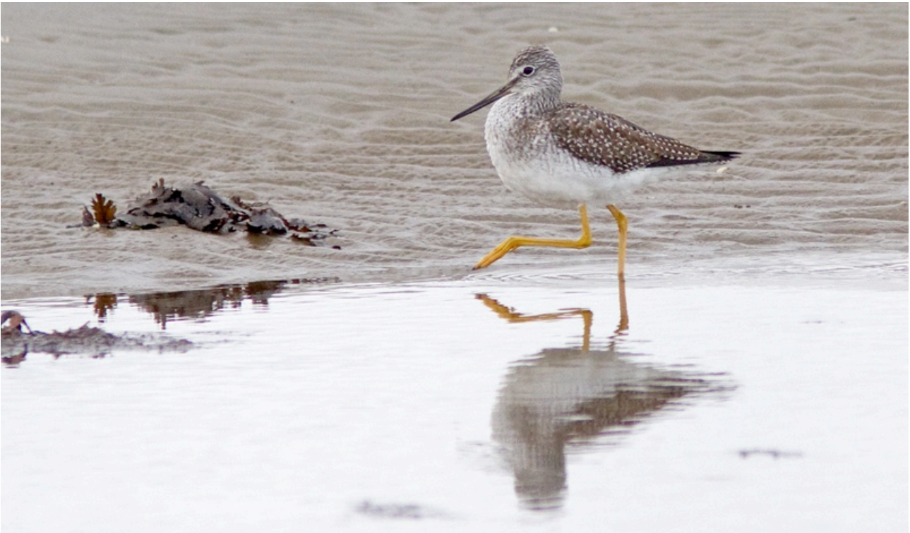
Den större gulbenan ger ett alert intryck.

Reserapport - Skånska vinterfåglar 18 - 21 januari 2018