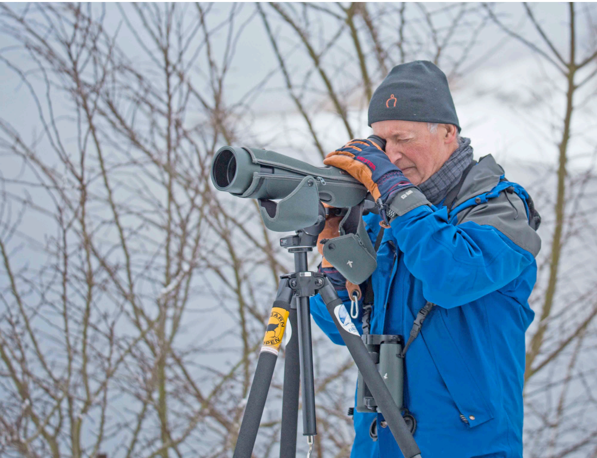
StOFs revisor granskar detaljer.

Vombs ängar – larmade arter (ägretthäger, skogssnäppa, gäss) syntes inte till. På väg från ängarna spatserade en vit stork invid vägkanten och framme vid väg 11 kunde stora mängder gäss tubas in, bl a säd- och blåsgäss.