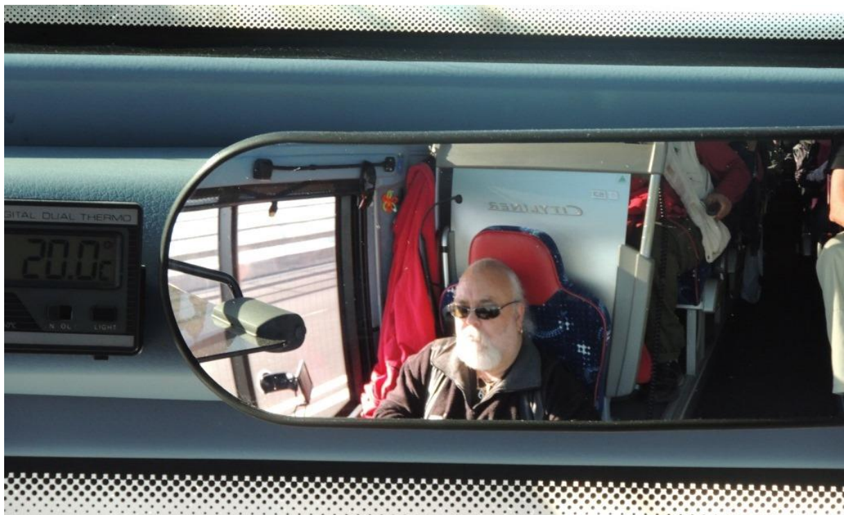
Björne vid bussratten