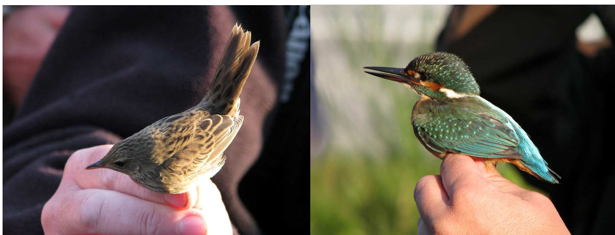
Träskångare och kungsfiskare

Efter middag på restaurang i Ystad kändes det som en dryg färd till vandrarhemmet i Höllviken. Där vidtog artgenomgång för dem som orkade.