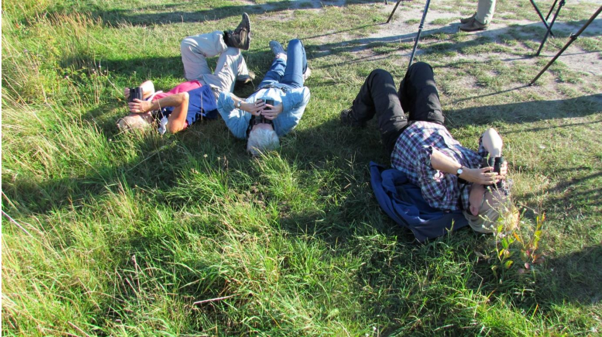
Damerna skådar bivråk

Ett sista stopp på nedresedagen gjorde vi i Skanörs hamn, där det mest intressanta var upptäckten av ett ladusvalebo under taksågget på av hamnbodarna. I boet fanns riktigt små ungar som matades flitigt av föräldrarna. Man kan bara spekulera i orsakerna till denna sena häckning, men möjligen hade den varma sommaren lockat svalorna till en andra omgång.