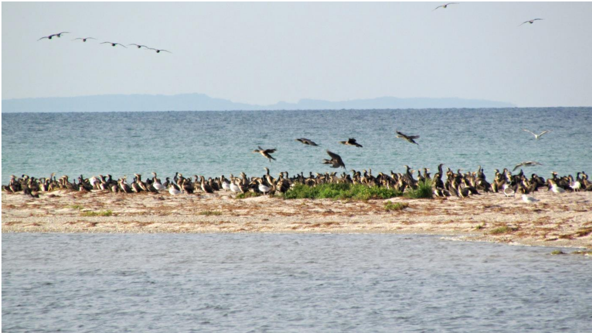
Måkläppen. Här stod de kaspiska trutarna.

Bland andra nya arter för dagen var sjöorre, svärta, småskrake. Kustsnäppa och rödbena fanns med några ex i strandkanterna. En rörsångare satt i en vassrugge i vattenbrynet framför oss. En rödstrupig piplärka sträckte över. Vattenrall skrek både vid Nabben och i en av dammarna på vägen tillbaka till parkeringen. En ung dvärgmåss sträckte västerut på långt håll. En gråhakedopping låg långt ut i sydvästlig riktning.