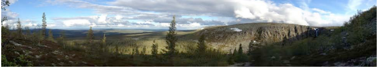
Panorama över Fulufjället.