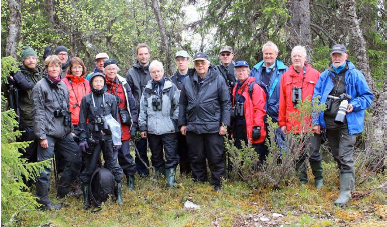
Hela gänget precis innan hemfärd.