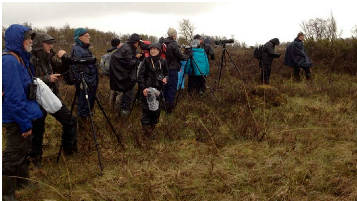
Genomblöta, men lyckliga skådare.

Kvällens huvudsakliga mål var Mittåkläppen och en förhoppning om dubbelbeckasinspel. Äventyrligheterna började egentligen redan när vi tog oss förbi bommen in till den nyöppnade grusvägen som ledde upp på berget. Medan vi närmade oss den lilla parkeringsplatsen började regnet tillta och vi klädde oss alla till tänderna med de regnskydd vi hade att tillgå. Under den mödosamma vandringen uppför branterna övergick det konstanta regnandet till ösregn och den vattendränkta stigen blev nu mer av en bäck som vi vadade fram genom. Två morkullor svepte några varv över oss på vägen och kom vid ett tillfälle så nära som tio meter.