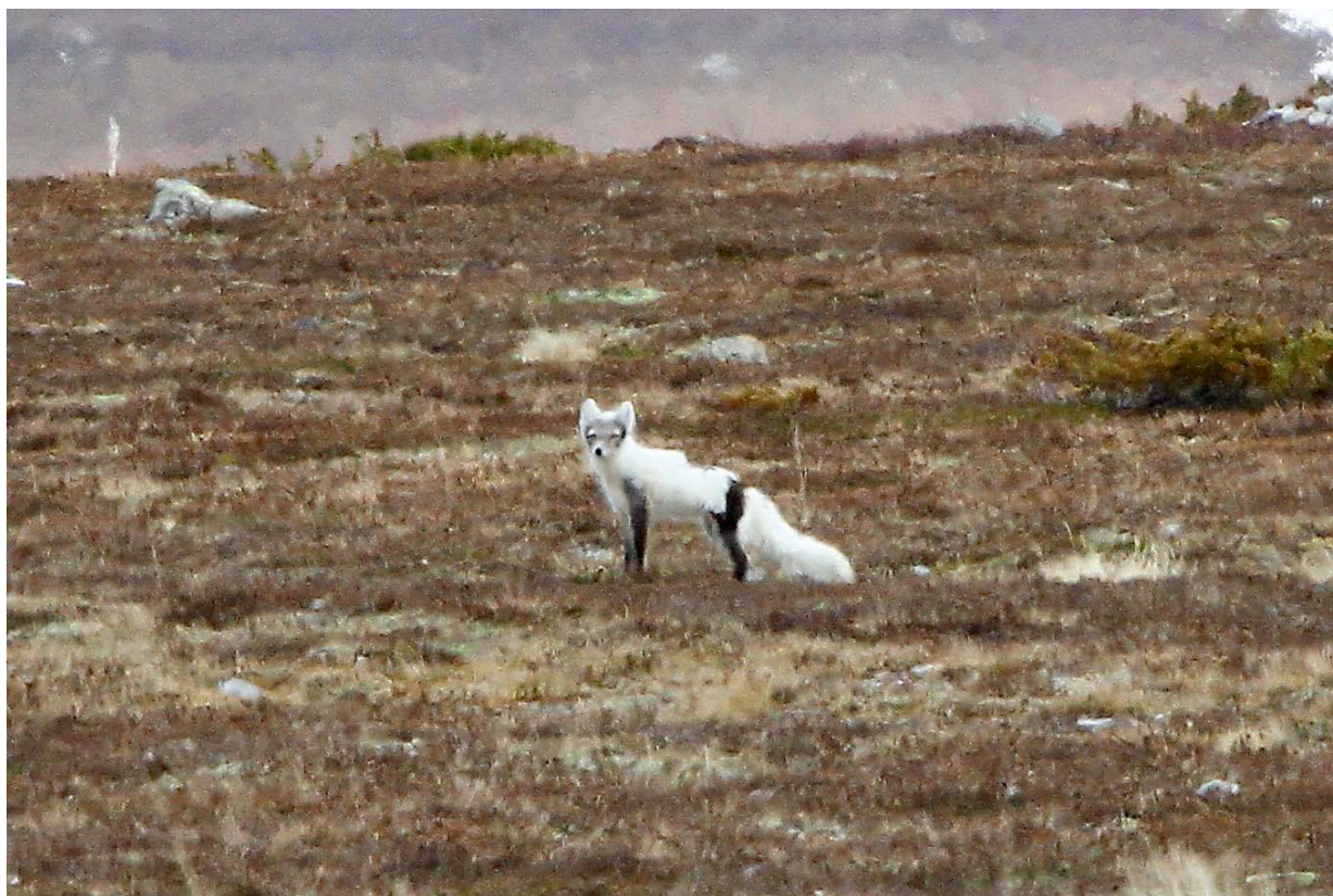
Fjällräv, en av resans höjdpunkter.

Fågelskådande handlar för min del mycket om avstånd. Det går inte att komma ifrån att en kärnsnäppa på 200 meters håll i skärgården känns betydligt mindre spännande än en individ på nära håll. Våra fem dagar skulle bjuda på väldigt många närkontakter med möjlighet att detaljstudera arter som annars oftast bara rastar korta stunder i Stockholmstrakten och dessutom oftast ses på långt håll.