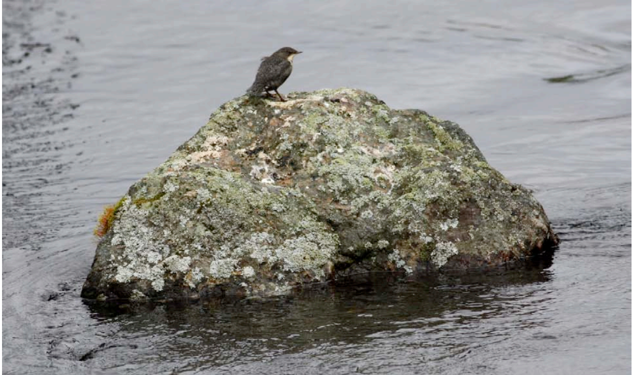
Strömstare, en av resans många närkontakter.

Framme vid Käringsjön spatserade vi in i det vackra landskapet täckt av tallar och vidsträckta sjöar. Mer använt för fiske än fågelskådning och det kryllade inte direkt av fjäderfän, men väldigt fina obsar av sju sjöorrar gjorde det väl värt mödan. Trots att ingen lappmes syntes till. Möjliga gärdsmygar hördes, men artbestämningen ansågs osäker så vi fick se oss besegrade på de vanligaste skogsfåglarna.