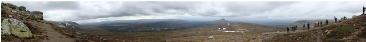
Panorama över Nipfjället.

Vår artgenomgång redovisade en bra första dag där jaktfalken var en självklar höjdpunkt. Mindre kul var liverapporteringen i matchen mellan Sverige och England, som förvånansvärt många av oss brydde sig om med tanke på att alla vi som bokat resan visste att vi skulle missa två av de hetaste matcherna vårt landslag spelat de senaste åren.