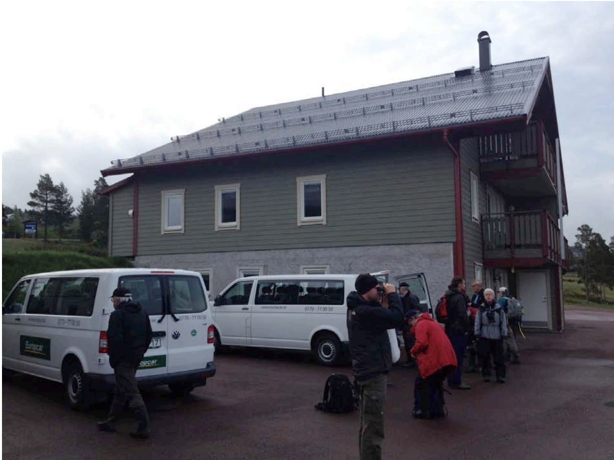
Snabb inpackning efter en natt vid Idre fjäll.

Natten spenderades i en stuga i skidområdet Idre fjäll som mer kändes som en spökstad efter apokalypsen än en pulserande nöjesmetropol under den här delen av året. Något som passade vårt ändamål utmärkt.