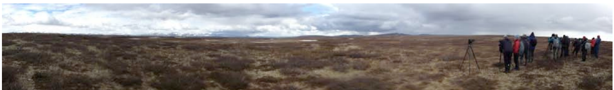
Panorama över Flatruet.

Här någonstans började jag inse vilket trevligt gäng som var med på resan. Av erfarenhet vet jag att specialintressen inte behöver betyda att man har så mycket gemensamt, men jag undrar om inte fågelskådning ofta går hand i hand med andra intressen och åsikter som jag delar.