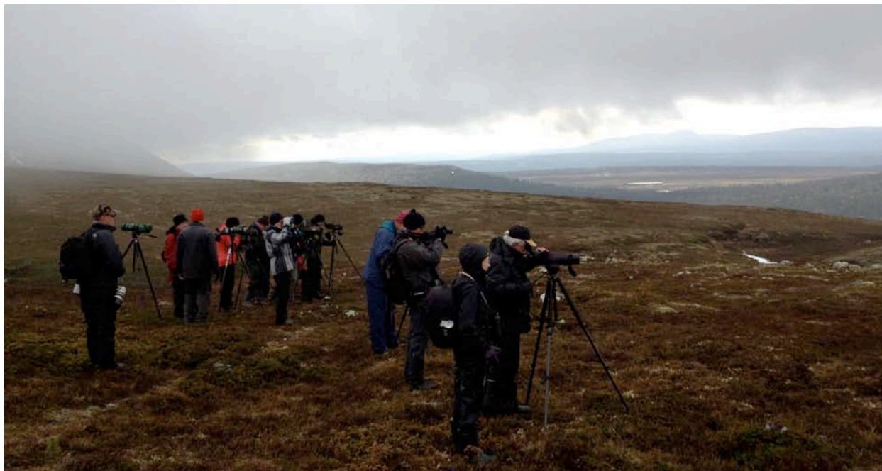
Fågelskådning vid Nipfället.