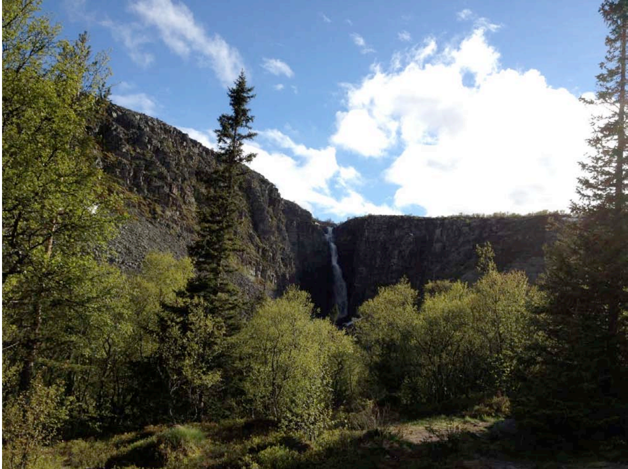
Vattenfallet Njupeskar.

Framåt eftermiddagen nådde vi fram till dagens huvudmål; Fulufjällets nationalpark med Sveriges högsta vattenfall: Njupeskar. En förtrollande vacker plats med öppna myrar, åldriga barrskogar, knotiga björkar, vacker inramning av en brant fjällkedja och upprustade byggnader. Den viktigaste målarten och en av mina största förhoppningar med resan, var att få se de jaktfalkar som ska kunna synas i området. På vägen upp längs den slingriga stigen kunde vi få in den ständigt närvarande bergfinken, men också resans enda grönsångare. En individ som hade en väldigt annorlunda dialekt som nog inte skulle bli förstådd av sina släktingar i Nackareservatet som jag normalt sett hör.