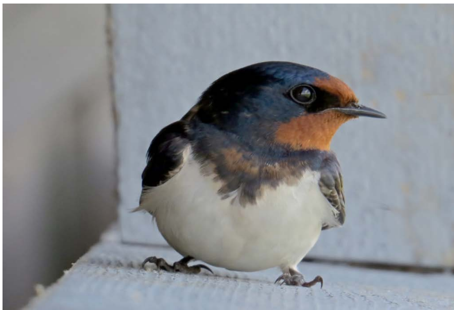
Ladusvala häckade i "Fågeltornsgömlset" på Getterön.

Vi fick en rekommendation på kornknarr som hördes på dagen vid Örtofta sockerbruksdammar så vi började den tidiga morgontimmen med ett besök där. Det visade sig vara en intressant lokal med mycket skräpmark, eller ruderatmark, som vi lärde oss det heter. Här sjöngs det friskt i buskagen. Speciellt roligt var det att lyssna på en vackert sjungande kärrensångare. Vi fick också uppleva ett drama på nära håll. Ett väldigt väsen hördes från björktrastarna i trädet. Strax därefter på bara någon meters avstånd från oss kom en sparvhök flygande med en björktrast i klorna. Inte undra på att släktingarna var upprörda. Ett givande besök även om kornknarren inte ville göra något väsen av sig.