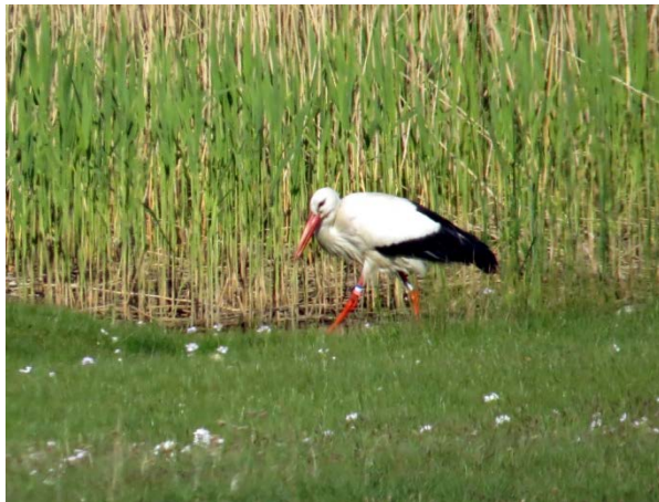
Vit stork vid Yngsjöns utlopp.

Väl framme vid Äspets lövskog fick vi tips om sjungande mindre flugsnappare och brandkronad kungsfågel av en fågelskådande pappaledig man. Han gav en utmärkt beskrivning var vi kunde hitta dem. Skönt ibland med lite extra hjälp eftersom vi hade mycket på agendan. Vi promenerade ut på den vackra strandängen och gick upp i tornet. Här såg vi bland annat stora mängder ruvande småtärnor och skärfläckor.