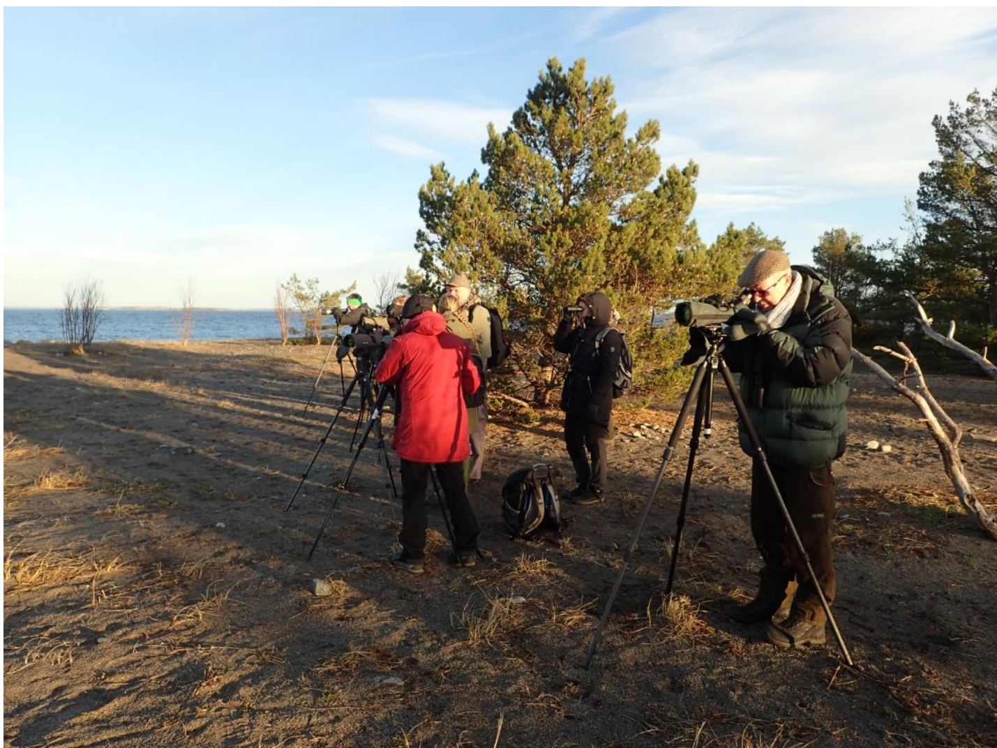
Exkursionsledaren kunde verkligen inte klaga på skådarintensiteten, som var på topp, trots den småkyliga vinden.

Vi siktade mot Ören på södra Torö som första Lokal. Innan vi lämnade Torövägen fick vi se en varfågel sitta på en tråd vid sidan om vägen. Av fyrfota djur såg vi rådjur, hjortar och mufflonfår. När vi kom ut på Ören, hade solen gått upp, men det var fortfarande tämligen svalt i vinden, ca 4-5 grader. Det var väl ingen större fart på fågellivet, men vi fick se hundratals gråsiskor dra söderöver i sällskap med några grönsiskor. Vi räknade till sex havsörnar på ett skär. Vad 17 lever de av hela vintern? Några mindre korsnäbbar hördes i skogen.