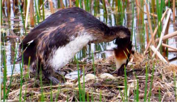
Kriterium 1: "Bo, ägg /ungar". Skäggdopping med två ägg. Observera att fotot är taget på långt avstånd för att inte störa.