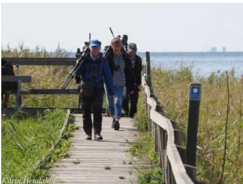
Den som är uppmärksam ser att detta inte alls är spången till Olas hörna utan en annan liknande spång i Lomma.

Därefter en ny lokal, Olas hörna och för att komma dit fick vi gå på en lång spång. Den var byggd för att man skulle kunna gå torrskodd även då markerna var översvämmade. Nu var det dock torrt även vid sidan av spången. Där sågs bl.a. gravand, gluttsnäppa, tornfalk och buskskvätta.