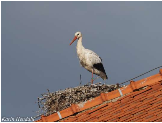
En stork blickar ner på oss från sitt bo.