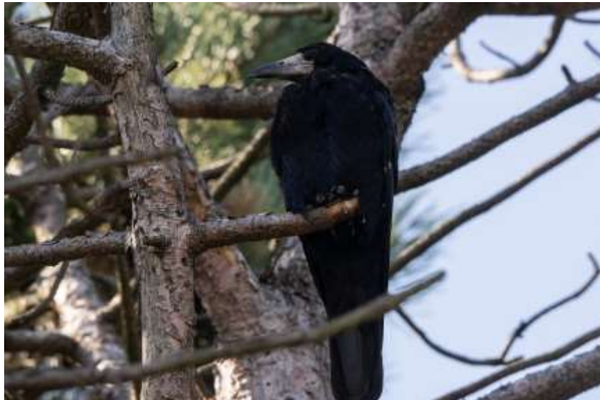
Denna råka sågs vid parkeringen.