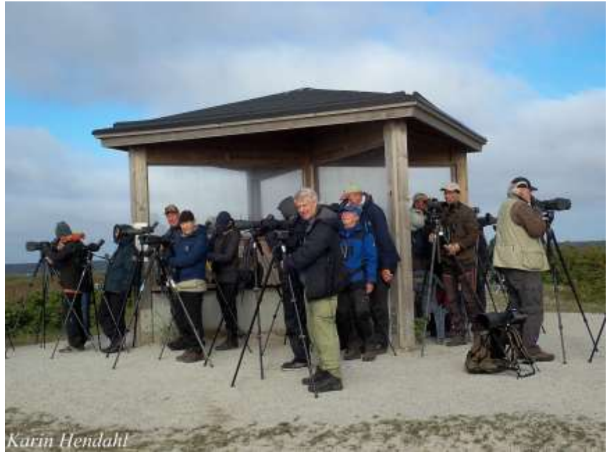
Det lönade sig att gå upp tidigt! Vi står nära sträckräknarna till höger.

Nu åkte vi för första gången till Nabben som skulle bli vår startlokal alla kommande dagar. Vi lyckades få plats på den lilla parkeringen och vandrade bort mot Nabben. Det var inte många människor där så tidigt på dagen så vi fick bra platser. Lite senare kom sträckräknarna som finns där under hela höststräcket och registrerar allt som passerar. De ropade även ut sällsynta arter vilka de som stod nära kunde höra.