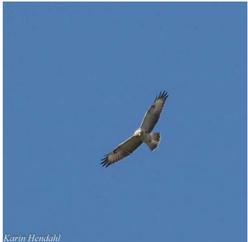
Bivråk över Nabben

. Vi började med att spana av vattnet och hittade en hel del vadare. Sträckande fåglar började komma och de som var mest frekventa av rovfåglarna var sparvhökarna. Men naturligtvis kom även några bivråkar. Beroende på vindriktningen som var nordlig drog många söderut på hög höjd och det blev ingen ansamling av flyttande fåglar. Några mer ovanliga arter som passerade var stäpphök, kaspisk trut och svarttärna.