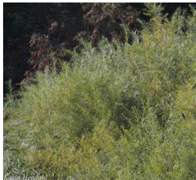
Den vackra kungsfiskaren till höger.

Sedan åter till Höllviken och middag på en kinakrog. Efter det hem till förläggningen för genomgång av dagens arter.