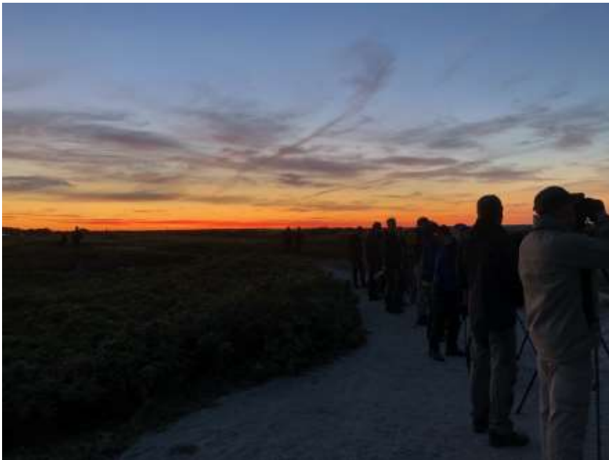
Soluppgång vid Nabben med en svag månstrimma som nästan inte syns.