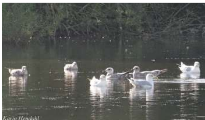
Detta foto visar hur svårt det är att hitta en simmande kaspisk trut 1 K. Titta mitt i bilden!