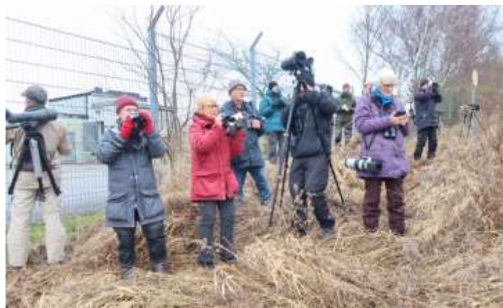
Skådning vid Lunds reningsverk

En annan given lokal på resan är den närliggande Lunds reningsverk som har en fin damm med mycket fågel i. Vi fick härlig närobs på en forsärsla . Några andra extra roliga obsar var tornfalken i flykt, ett antal rörhönor som helt oskygga simmade på rad och en smådopping . Brunand och en hel del vanligare sim- och dykänder liksom mås och trut kunde bockas av.