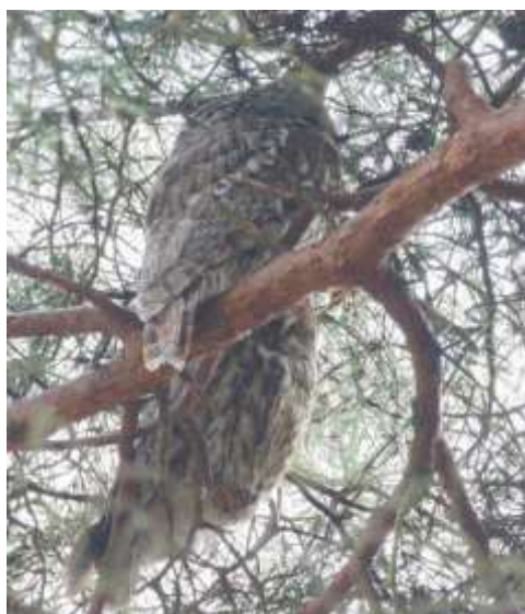
Kattugglor vid Silvåkra

När vi 14:50 anlände till Silvåkratornet vid Krankesjön var vädret fint och behagligt. Krankesjön är en förnämlig fågelokal året runt och även vi kunde glädja oss åt en hel del fina obsar idag. Från tornet såg vi två ägretthägrar , resans första storskrakar , en salskrakehona och en hel del andra änder. På stigen i närheten fann vi två kattugglor i en tall, en alltid lika trevlig obs! Vidare en ropande gröngöling och några rödvingetrastar .