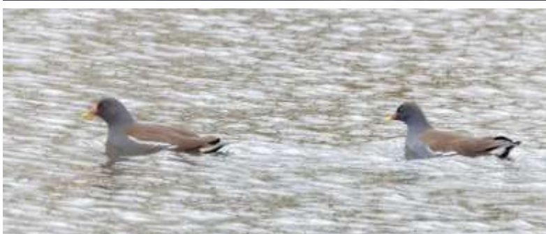
Rörhöna, foto Klas Reimers

En ny lokal för januariresan blev Örtofta sockerbruksdammar , nordost om Lund. Siktet var inställt på en larmad vattenpiplärka. Lokalen var inte den charmigaste. Det blev en lång vandring på en mycket geggig och klafsig väg. Dessutom luktade det allt sämre ju närmare dammarna vi kom. Odören var en blandning mellan avlopp och grisstall! Utdelningen på fågel blev dock mycket god, läs bara detta: 4-5 ormvråkar, varav en i ljus fas, "börringetypen", som satt på en trädgren där vi parkerade. Resterande ormvråkar kretsflög tillsammans med ännu fler röda glador över de vidsträckta fälten, en härlig syn! Andra fina rovfåglar var en honfärgad blå kärrhök och en stenfalk . Rovfåglarna toppades dock av en obs på en kungsörn , en trolig 2K-fågel som syntes fint i flykt när den jagades av en glada. Ett gäng fasaner fanns här, liksom några bo- och bergfinkar och en flock med näpna vinterhämplingar som vi kunde se på rätt bra avstånd. Däremot blev det inget av vår målart vattenpiplärka.