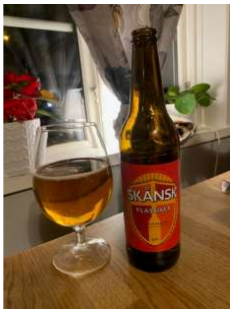
Skånsk öl