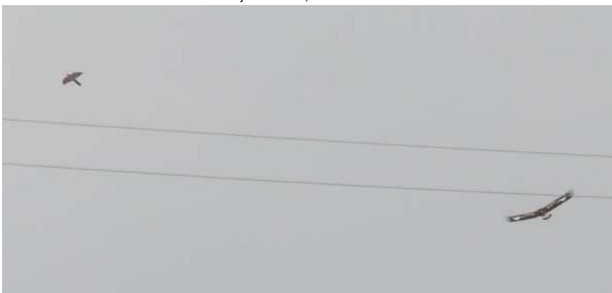
Kungsörn och sparvhök vid sockerbruksdammarna

Mörkret hade börjat lägga sig kring Flyinge kungsgård när vi inledde vårt sista stopp där strax efter klockan fyra. Förutom att bocka av lite vita storkar så var målet att se eller åtminstone rekognosera i trutkolonin efter kaspisk- respektive medelhavstrut som bägge har syntts där. Det hade blivit lite för mörkt nu, men vi såg i alla fall var trutkolonin håller hus. Förutom lite storkar så såg vi även en havsörn och Gustav hörde en kungsfiskare .