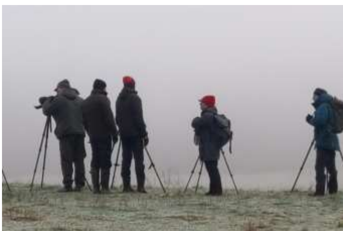
Dimma i Fyledalen

Vi åkte från Simrishamn halv tio och kunde snart uppleva att morgonens fina sol började skymmas av dis när vi åkte inåt land. Vårt besök vid den fantastiska Fyledalen blev av den anledningen rätt kort men vi kunde genom dimman ana en kungsörn på en torraka, liksom en överflygande havsörn och några sädgäss.