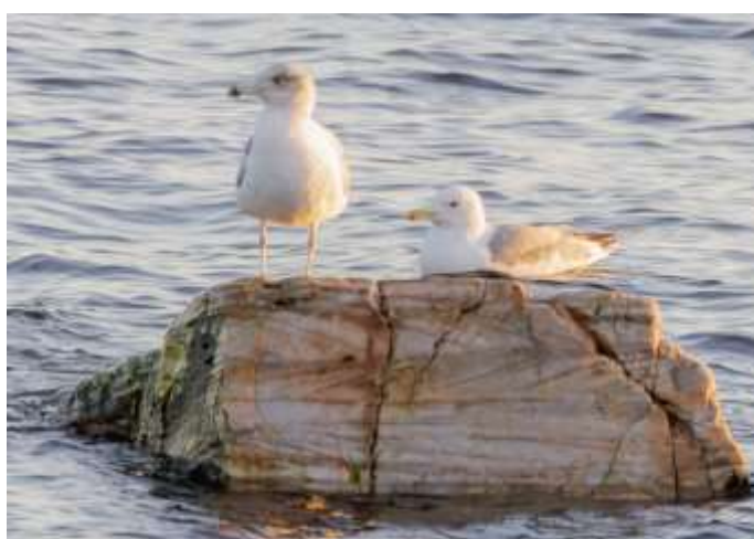
Yngre gråtrut & vuxen kaspisk trut