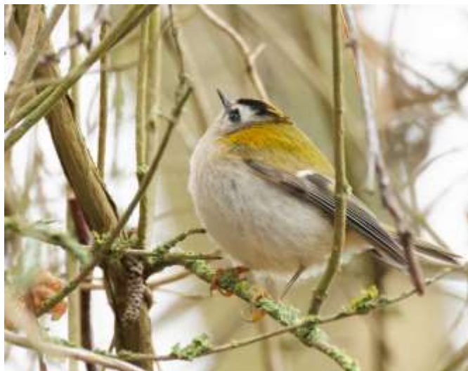
Brandkronad kungsfågel

Falsterbonäset är stort och vid "Roberts dunge" ägnade vi en bra stund åt att försöka vänta ut den brandkronade kungsfågeln, som rapporterats där. Till slut begav sig Gustav in i snårskogen och lyckades hitta den lille skulkaren medan vi andra väntade på den lilla vägen. Vi fick en riktig drömbild på den brandkronade, som ivrigt födosökte i ögonhöjd. Den vanliga kusinen kungsfågeln var också på plats. Alldeles intill "Roberts dunge" ligger Knävången och Östra Knävången . Här fick vi in några andra härliga arter, en dubbeltrast, en storspov och resans andra pilgrimsfalk, sittande på en upphöjning i landskapet.