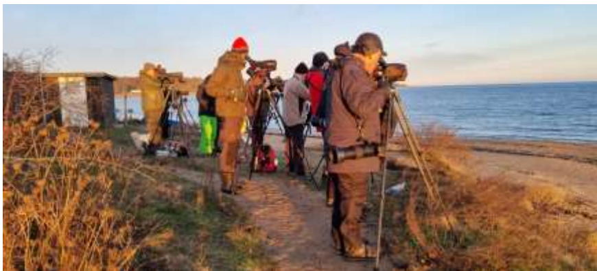
Revet i morgonsol

Vid revet fick vi en fin observation på en adult kaspisk trut . Där fanns även gråtrut och det blev en bra jämförelse då de arterna är mycket lika. Ur "Gustavs trutskola" kunde vi bland annat lära oss att den kaspiska truten har ett vitt huvud, svart öga, långa ben och en jämnsmal näbb, vilket får till följd att näbbens spets har en svag lutning, precis som en barnbacke i en fjällanläggning. Detta till skillnad mot de liknande arterna gråtrut (blå pist i skidbacken) och medelhavstrut med den kraftigaste näbbkrökningen (röd pist i skidbacken).