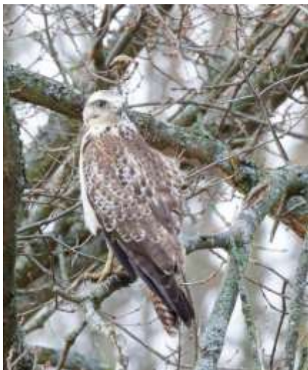
Ljus ormvråk