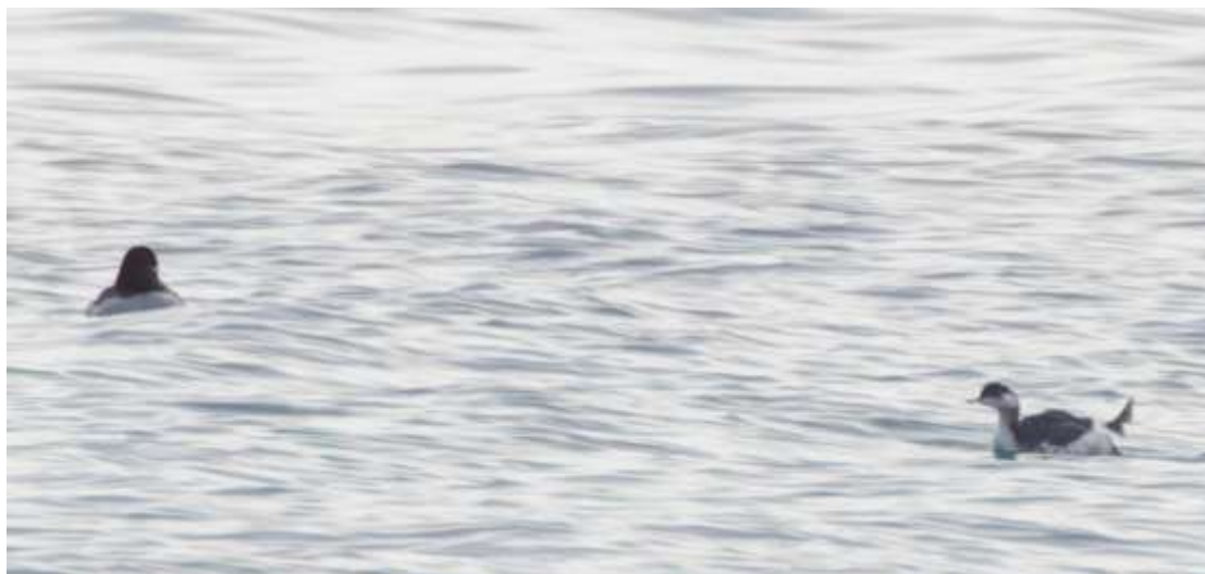
Huvudprofil svarthalsad dopping

Strax efter klockan 12 åkte vi vidare mot Hörte hamn . Som tur var lättade åter dimman så vi kunde se vår mållart, en svarthalsad dopping i vinterdräkt. Där fanns även fyra svarthakedoppingar , även de i vinterdräkt. Här kunde vi få en bra jämförelse mellan de snarlika arterna. Titta på huvudets form! Den svarthalsade doppingens huvud upplevs som rundare och toppigare. Det finns förstås andra skillnader också, se era fågelböcker. En hel del änder som till exempel alfågel och bergand syntes också.