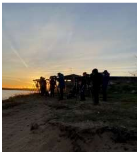
Revet, foto Lasse Berglund

Dagens första stopp blev Simrishams hamn med revet och sen en liten förflyttning bortemot industrihamnen.