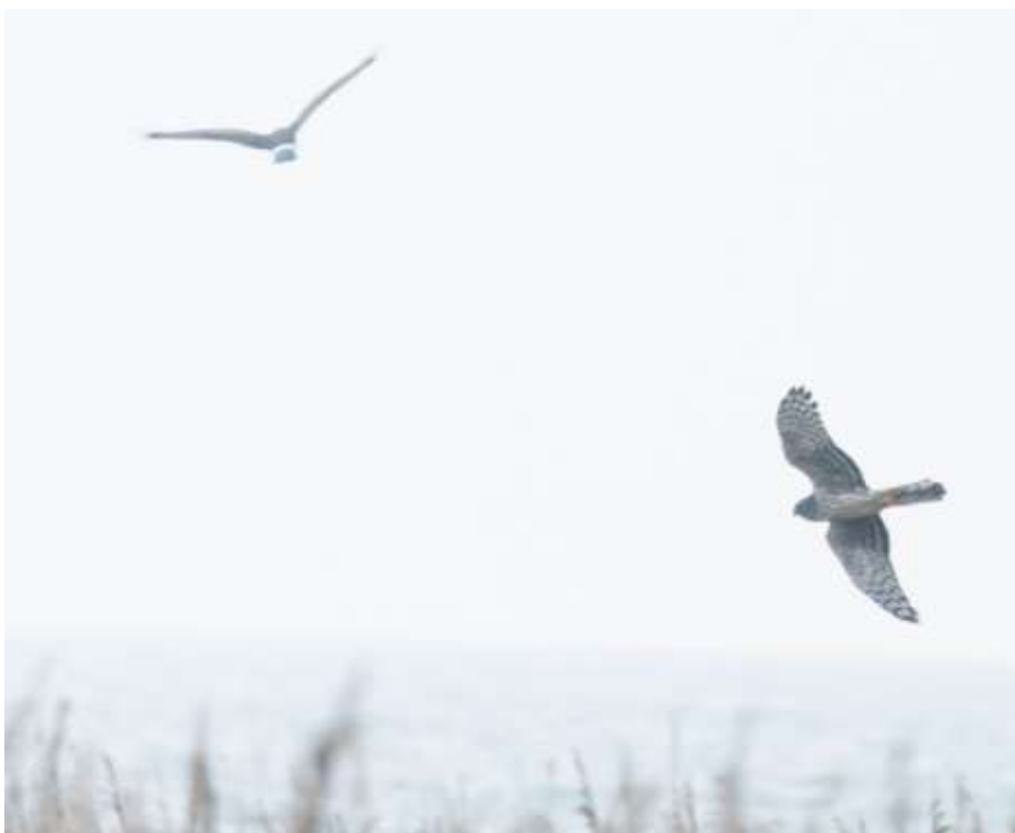
Blå kärrhökar, honfärgade.

Så var det dags för hemfärd. Mot Lund, lämna tillbaka bussarna och byta till lite andra kläder innan tåget avgick mot Stockholm klockan 17:18. Resans sista artgenomgång visade att vi slagit reserekord idag: 50 arter, varav hela 14 nya för resan. Det gör att vi kom upp i 101 arter. Ett helt godkänt resultat!