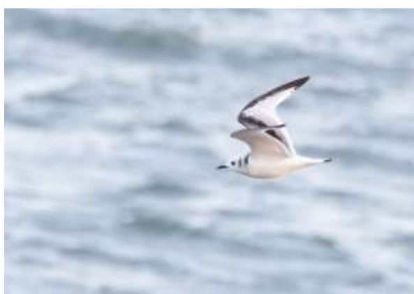
Studie över tretåig mås i första vinterdräkt

Ännu längre västerut från Kattvik ligger Torekov med Svarteskär . Svarteskär kallas kobbarna strax utanför hamnen. Det är normalt sett en given lokal för toppskarv och det finns även god chans på