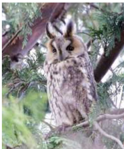
Hornuggla