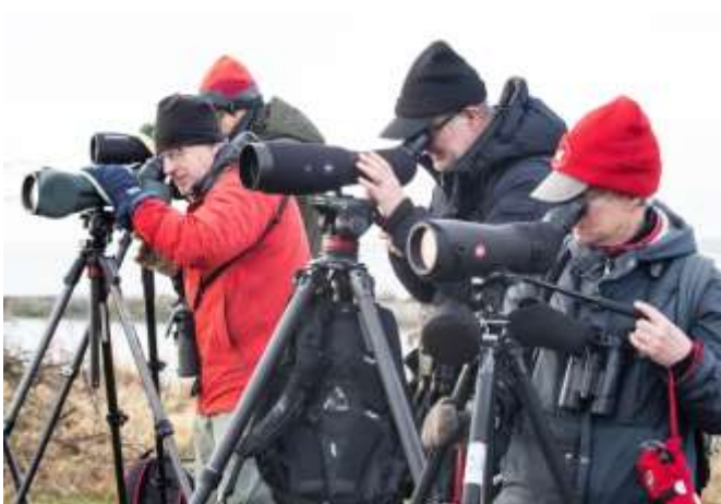
Full skådarkoncentration, foto Monica Ahlberg