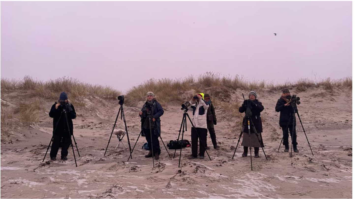
På väg ut mot Måkläppen.