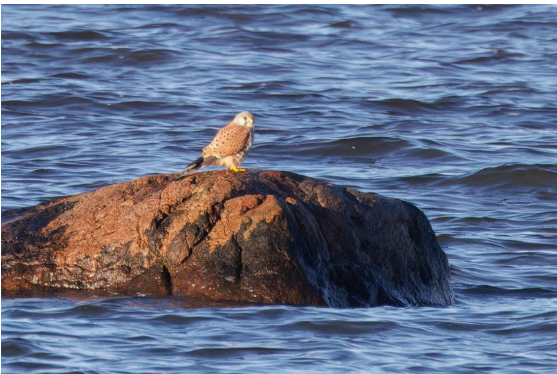
En tornfalk vid Grytskären.