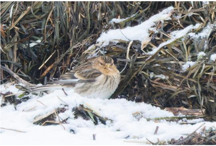
Vinterhämling på Måkläppen.