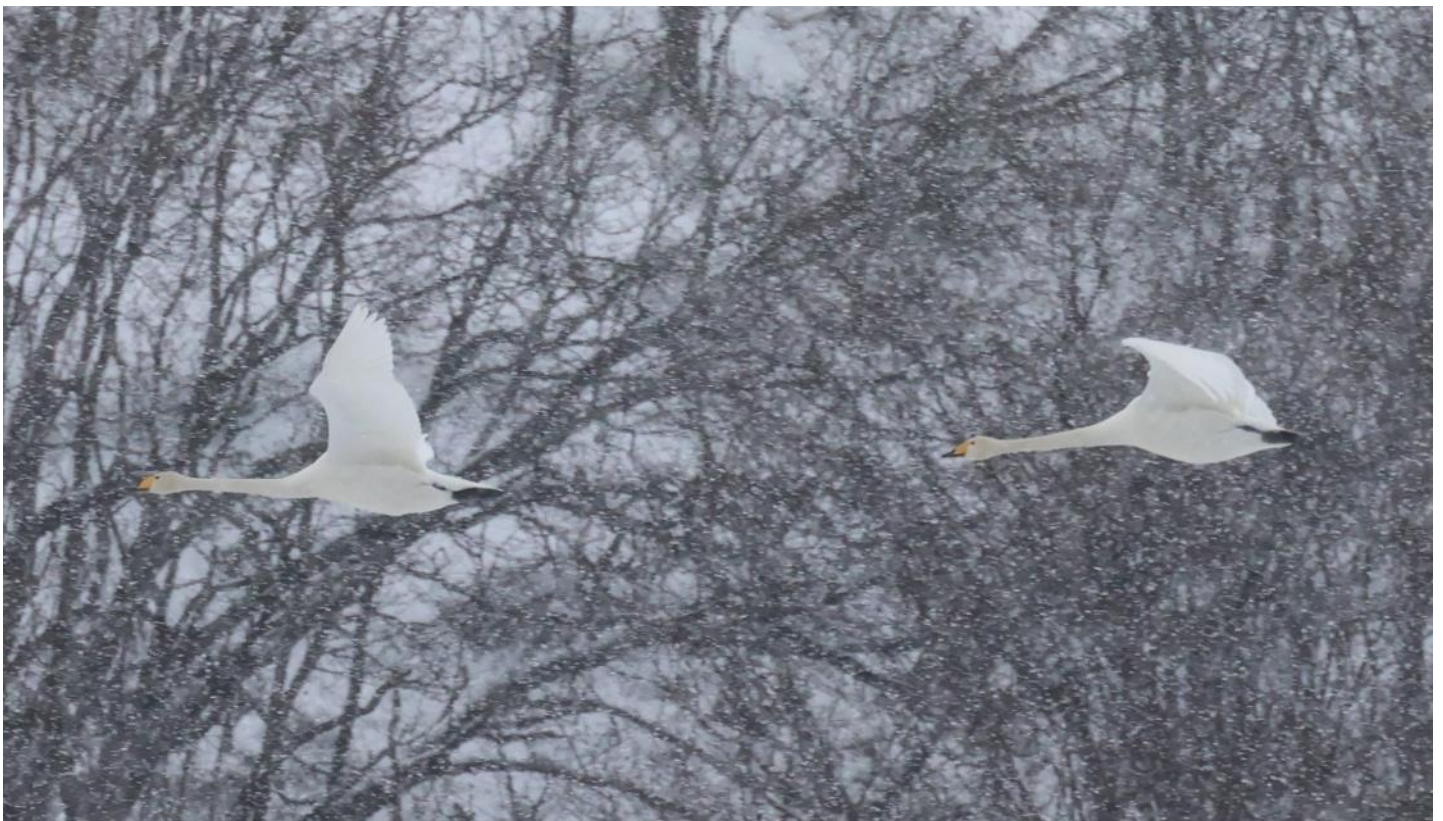
Sångsvanar i Fyledalen.

Efter en stund i Fyledalen kom ett snöfall. Det var väldigt vackert och effektfullt när vi blev helt omgärdade av många och mjuka snöflingor. Det var som ett alldeles eget sagolandskap ett tag innan snöfallet upphörde lika snabbt som det började.