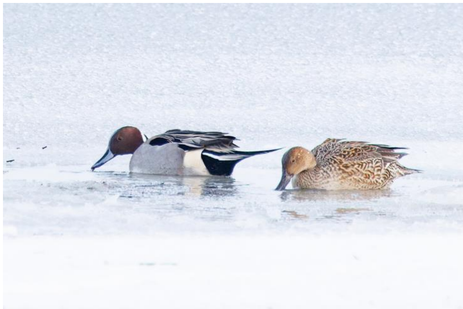
Ett stjärtandpar vid Höllviken.

Vid nästa anhalt, den ännu blåsigare och kyligare Höllvikens strand var det tyvärr isbelagt vid havet och bara några enstaka fåglar kunde glädja oss, framför allt ett par eleganta stjärtänder. På grund av isläget så satte vi oss åter rätt snabbt i bilarna men nu hade Mova i "buss nr 2" upptäckt en pilgrimsfalk på isen. Vi andra backade tillbaka bilarna för falken ville vi förstås titta på. Det kan nämnas att på SMHI stod det -1 grad, kanske inte jättekallt i januari men ihop med nordvästliga 14 m/s och uppemot 21 i byarna så var det bara att hålla i hatten och tubkikarna!