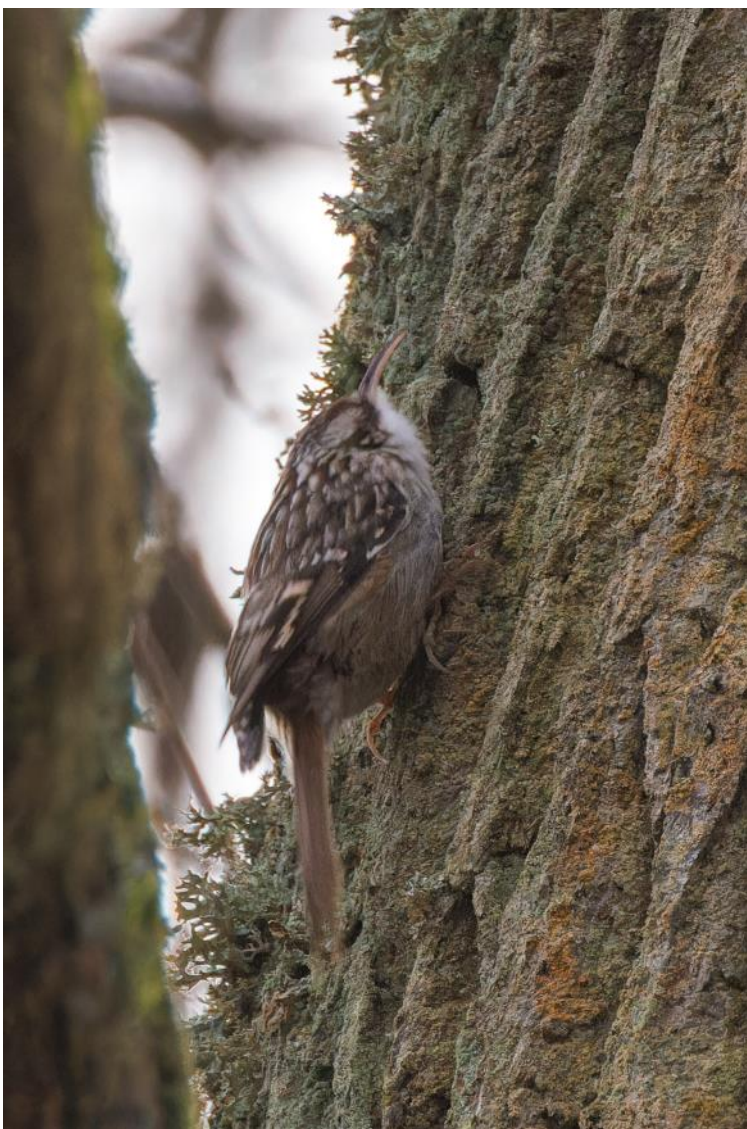
Trädgårdsträdskrypare. Lägg märke till den "smutsigs" magen!