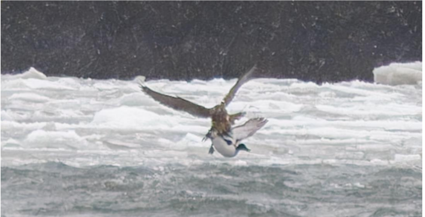
Ett drama i fågelvärlden