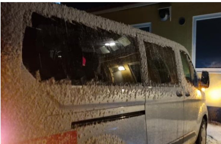
Bilarna var frostnupna i den tidiga morgonen. Skånevinter