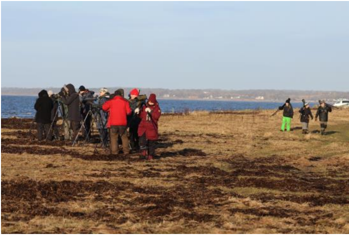
Vi letar piplärkor vid Grytskären.