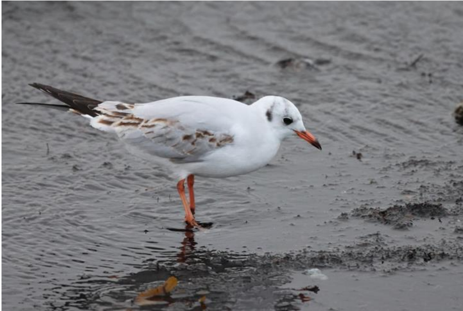
Skattmåås 2K (kläckt ifjol) vid Albäcksåns mynning.

Som tur var upphörde snöandet under färden! Det var ändå inte sommarvarmt vid stranden där Albäcksån mynnar men som de tuffa skådare vi är så kunde vi rätt snabbt få in lite kul arter som tre isländska rödbenor, en forsärla, en tornfalk och en skärnsnäppa. I övrigt fanns det "vanliga" vid stranden och någon bofink och annat mest ordinärt vid småfågelmattningen.