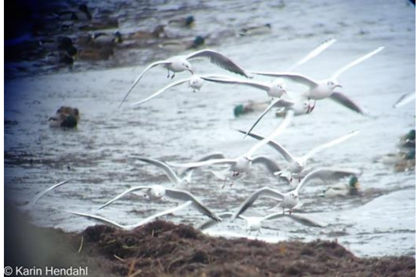
Födosökande skrattmåsar vid Världens ände, Ystad.

Sen bar det av mot den berömda Fyledalen som verkligen levererade sina örnar idag! Vi hann knappt stiga ur bilarna förrän åtta örnar steg upp och kretsade i dalen ett bra tag. Det visade sig vara sju havsörnar och en 4K+ kungsörn och några av örnarna lekte tafatt med varandras klor i en snygg dans! Övrigt att nämna var en duvhök och på avstånd hörde vi en spillkråkas "flyg- respektive sitt-läte".