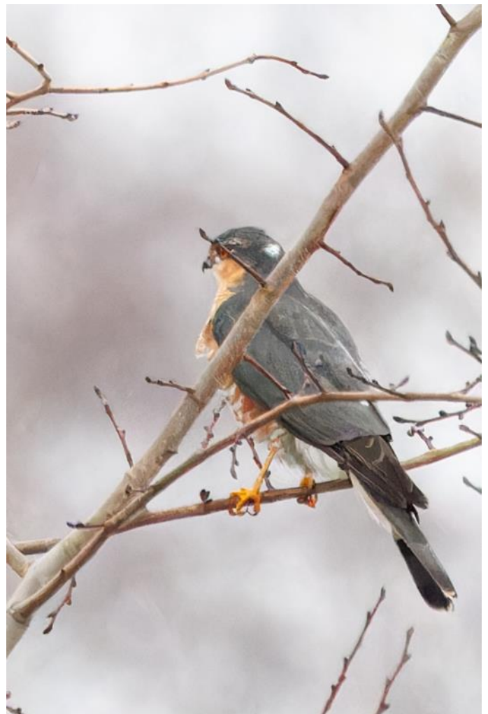
Sparvhökshane vid Lunds reningsverksdammar.

Sen åkte vi till vårt vandrarhem i Blentarp för artgenomgång innan det var läggdags. Vi hade observerat 49 arter under dagen.