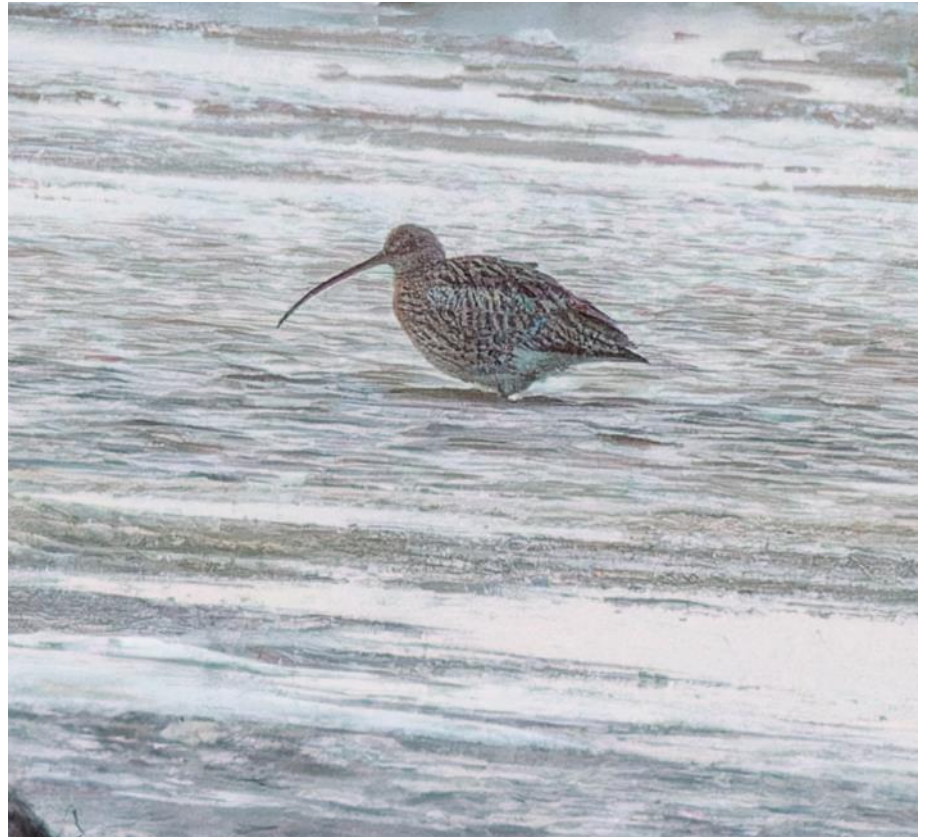
Storspov i skymningsljus vid Farhultsviken.