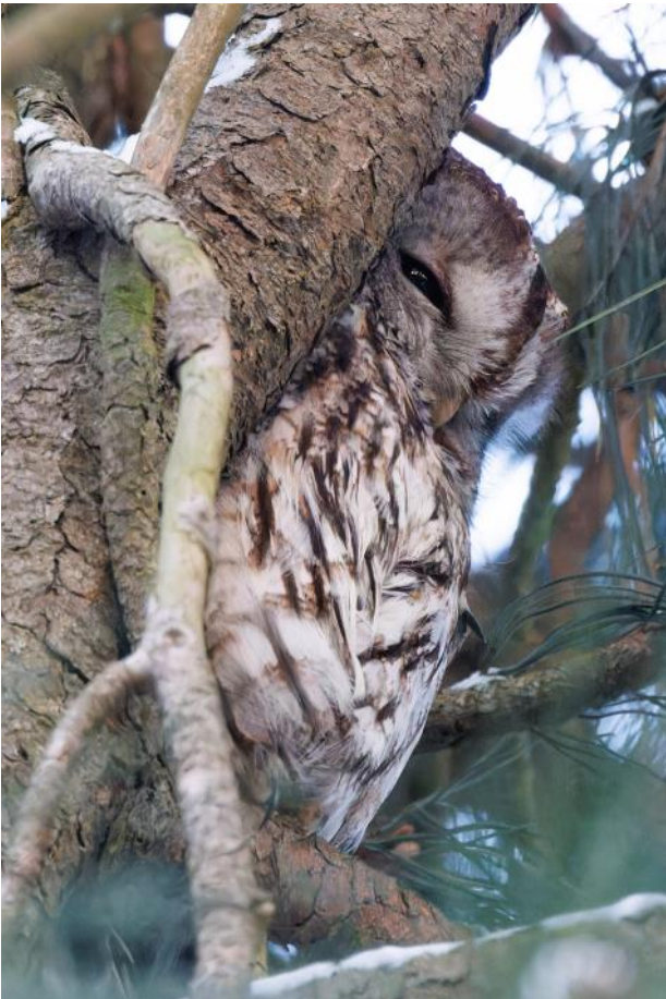
Kattugglan i "Botan".