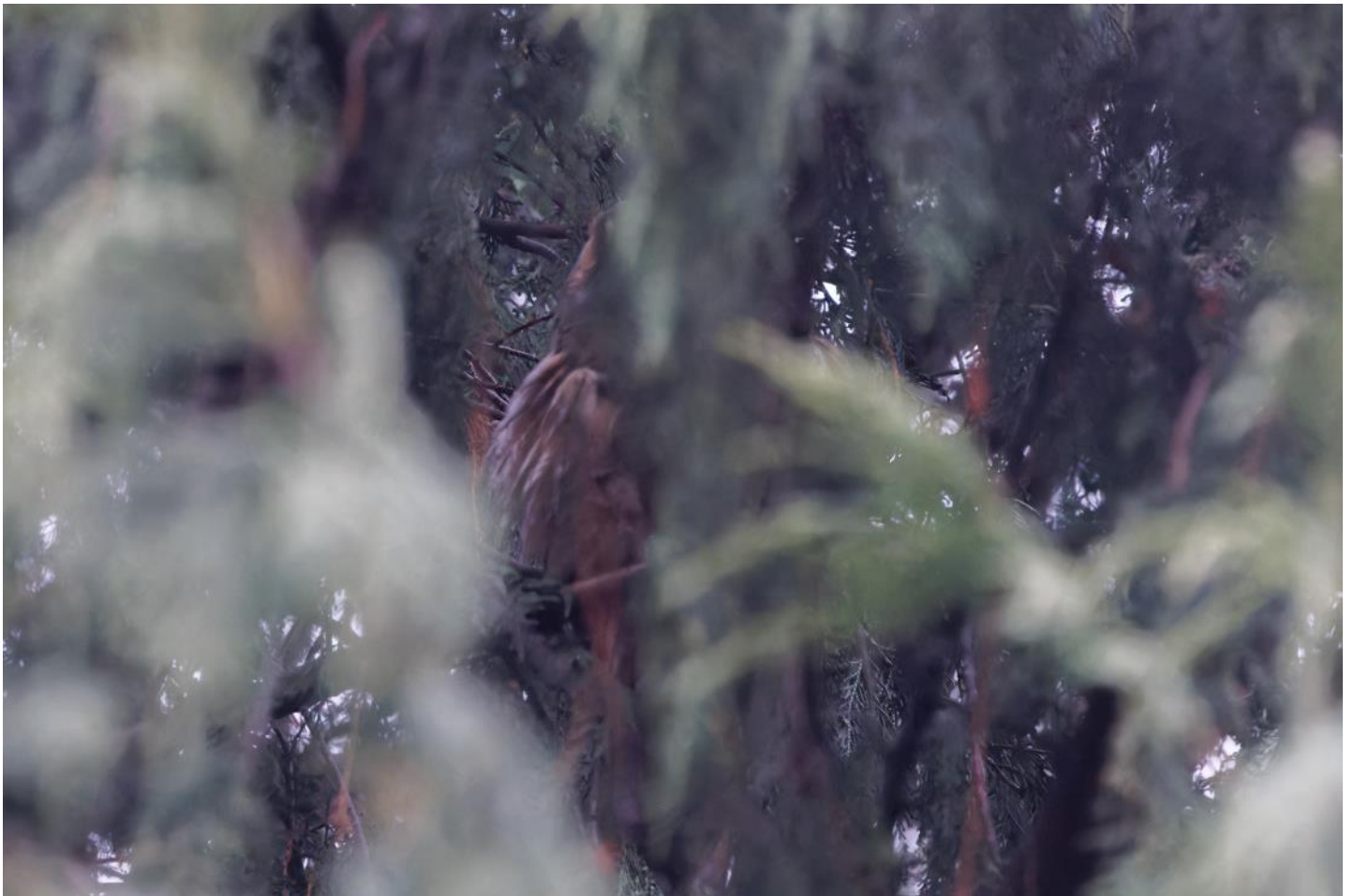
Här är Klas bild på hornugglan. En riktig Garbo.