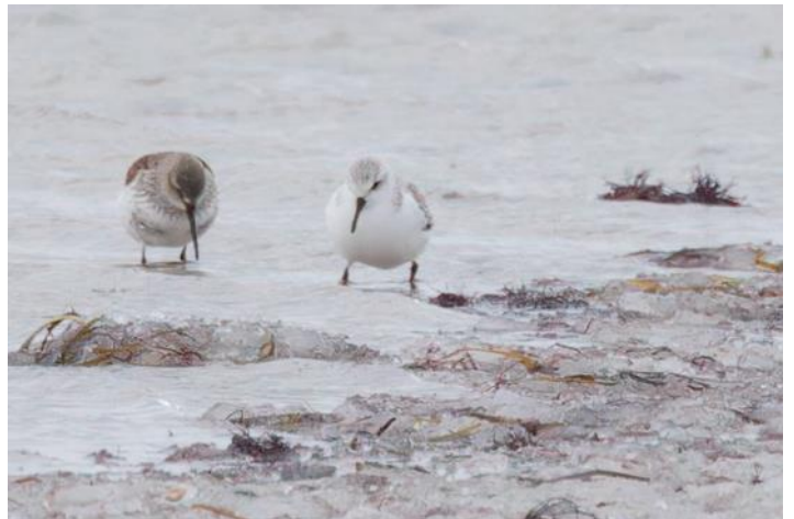
Kärrensnaippa och sandlöpare i vinterdräkter.