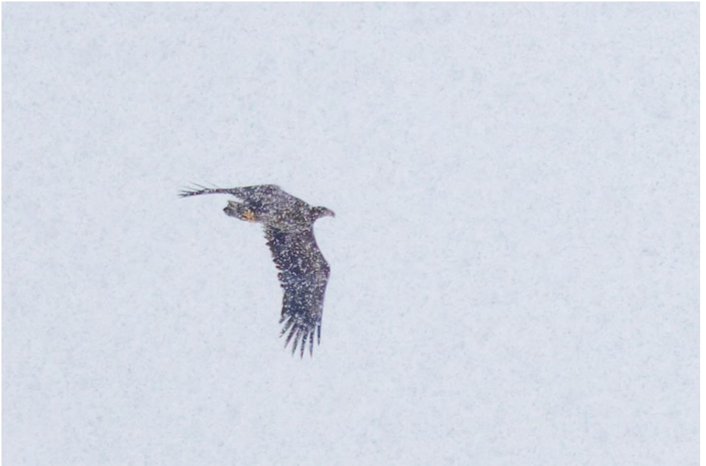
Havsörn i Fyledalen.