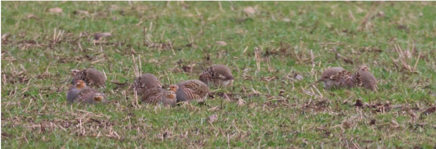
Jordkokorna rörde på sig och visade sig vara ett tiotal raphönor.

På vår väg till lokalen som hyser trädgårdsträdskrypare upptäckte vi från bussen ett tiotal raphönor som små "jordkokor" på en åker utmed vägen. Detta var kring Åkersholm, Barkåkra (eller Errarp som skåningarna kallar platsen).