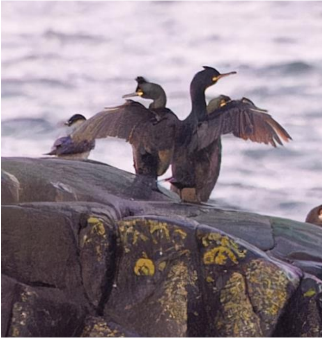
Ovan: Toppskarven har ett krön fram till på hjässan och i häckdräkt även en tofs. I flykten ser man att de har tydlig kulmage.

Vid Torekavs hamn och Svarteskär fick vi en solig, kylig men givande skådning. Vi började skanna av hamnen och där låg någon ejder och lite annat. Toppskarvarna satt uppradade på närbelägna Svarteskär och kunde beskådas tillsammans med storskarv, vilket var mycket pedagogiskt som jämförelse. En toppig tofsförsedd hjässa, en liten kulmage (syns bra i flykt), något mindre storlek och smalare näbb är bra kännetecken på en toppskarv. På skarvstenarna satt även en skärnsnäppa, de är små tuffingar som är en av fåtal vadare som kan ses vintertid. Förutom gräs- och bläsänder mm som trängdes vid strandkanten så flög det förbi en hel del skojigt som svärta, sjöorre, alfågel, småskrake, skäggdopping, tobisgrissla och tordmule. Vissa i gänget såg även skärpiplärka men mer om piplärkor längre fram.