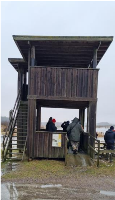
Ett av fågeltornen vid Vomb.