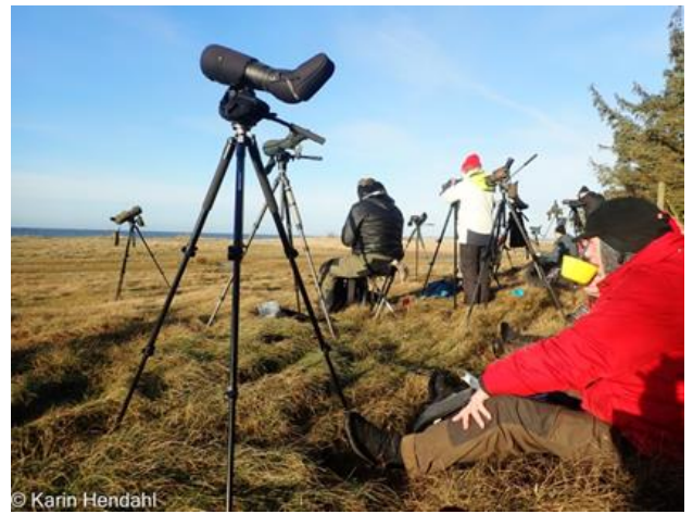
Lunch i sol vid Grytskären.