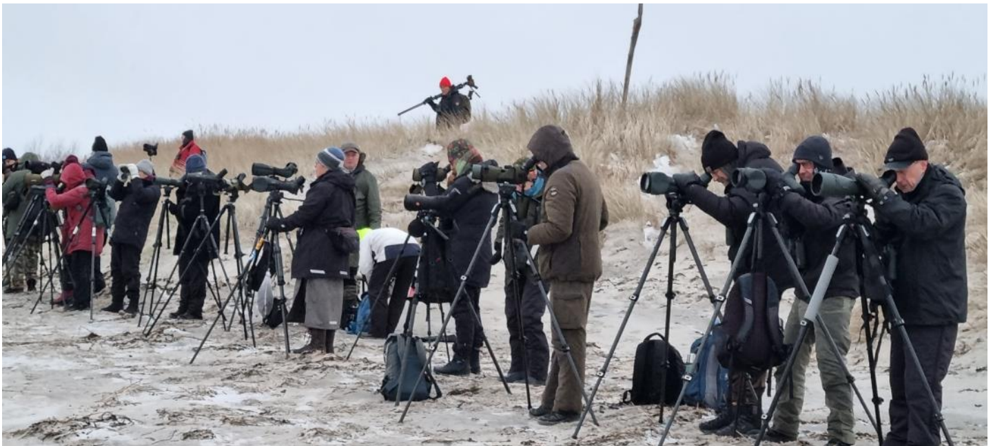
Intensivt skådande vid Sandhammaren. En sval sysselsättning i januari!

Vi fick stretcha våra ögon och hjärnor ordentligt för att kunna se och artbestämma de snabbt förbiflygande fåglarna i blåsten. Skäggdoppingar i ljus vinterskrud, sjöorrar, smålommar, alfåglar, bergänder och någon tordmule ilade förbi och i vissa fall kunde vi även njuta av fåglar som rastade på vattnet. Sandhammaren är också en badplats - även vintertid - vilket vi fick uppleva när en kvinna i bara mässingen tog sig ned till vattnet en bit bortifrån oss. Friskt vågat!