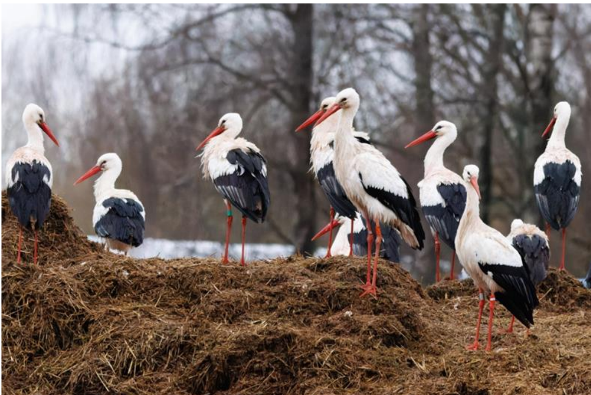
Vita storkar på gödselstacken i Flyinge.

Vid tvåtiden kom vi till Flyinge kungsgård som förutom hästar även har en stam med vita storkar som härstammar från storkprojektet. I Skåne finns tre storkhägn med uppfödningar, varav Flyinges är det minsta. Här fanns i alla fall uppemot 40 stycken frilevande storkar idag. En minst lika stor anledning till vårt besök var ett larm om en kaspisk trut. Det fanns gott om trutar på den frusna dammen och på gödselstacken. Efter ett tag fann vi en kandidat till en kaspisk trut. Efter gemensamt tittande och diskuterande kom vi så fram till att det var vår eftersökta trut, en 2K fågel, alltså inne på sitt andra levnadsår.