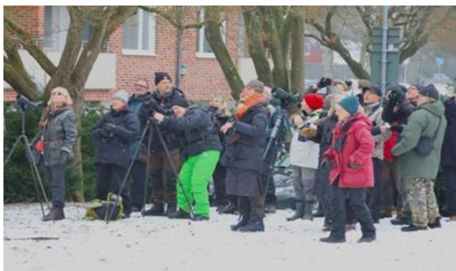
"Men var är ugglan?"

Första stoppet i Skåne var van Dürens väg i Lund där vi efter idogt skådande slutligen hittade en hornuggla dold i grenverket i en tuja. En sparvhök sågs flyga förbi över hustaken.