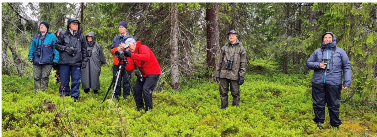
På spaning efter tretåig hackspett vid Fjällkällan. Kläder efter väder.

Första anhalt var Fjällkällan väster om Funäsdalens samhälle, ett område med gammelskog. Vi vandrade längs skogsstig och snart fick vi syn på en tretåig hackspett som flög fram och tillbaka några gånger över stigen. Vi fick intrycket att den hämtade mat till ungar i bo men vi lyckades inte finna boträdet trots visst sökande. Många lavskrikor födosökte i träden.