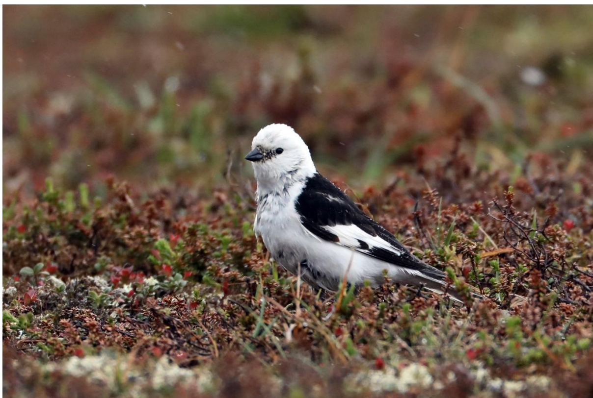
Snösparvar mötte oss i snöryan på Nipfjället