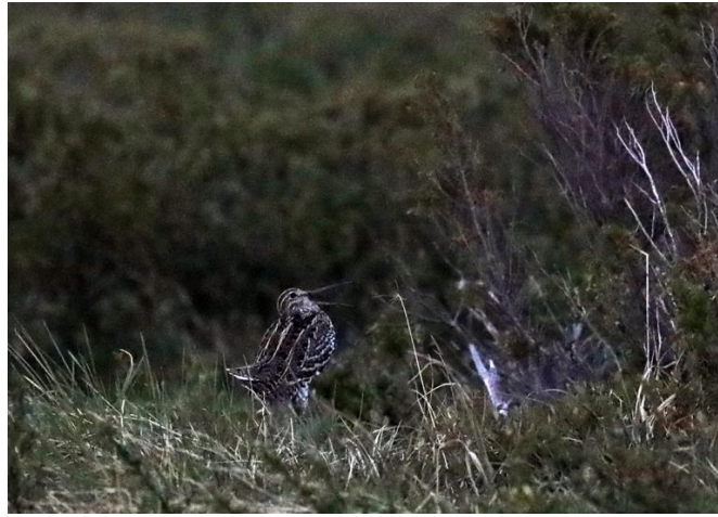
Mot dubbelbeckasinspelet! Spelande dubbelbeckasin

Så kom spelet i gång igen med ökad intensitet och flera fåglar kom inflygande. Antalet var svårt att bedöma eftersom det var utspritt och delvis dolt bakom tuvor och videsnår men vi uppskattade att det kunde ha handlat om så mycket som tio till femton fåglar. Vi delade upp oss i två grupper som stod på var sin sida om spelet utan att det verkade störa de spelande fåglarna som for runt och jagade varandra och ibland kom emot oss. I midnattsljuset från en ganska molnfri himmel kunde vi tydligt se de spelande fåglarna. Spelet blev allt intensivare. Vid 24-tiden bröt vi ändå upp och återvände till Funäsdalen för några timmars sömn. Vi var upprymda efter en fantastisk upplevelse och ganska frusna.