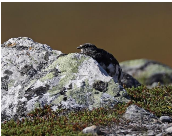
Fjällripa väl kamouflerad

Dagens första lokal var Nipfjället norr om Idre. När bilvägen lämnat skogen gjorde vi ett stopp vid en dälld med lågväxande björkskog. Här hördes sång av ringtrast men vi lyckades inte se den. Vi utgick från parkeringsplatsen vid vägens slut och vandrade en slinga söderut över fjället med Städjans karakteristiska profil i blickfånget. På många håll såg och hörde vi ljungpipare och ängspiplärkor. En fjällripa låg stilla vid en sten och kunde ses på ganska nära håll. Vi sökte efter fjällpipare, som rapporterats från platsen, men fann ingen.