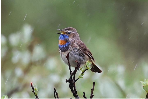
Blåhake och ljungpipare spelar oberörda av regnet.