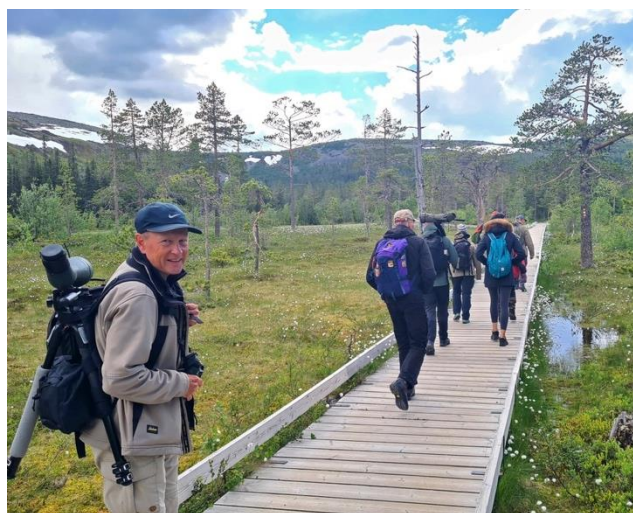
På väg mot vattenfallet