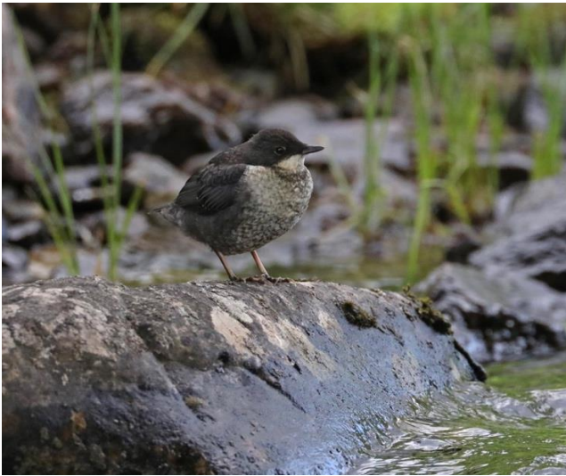
Strömstare matar sina halvvuxna ungar vid Kölån

Bilfärden till Funäsdalen gick längs den slingriga och backiga väg 311 genom ett vackert skogs- och myrlandskap. Vi stannade till vid Broktjärnen där vi bland annat såg gluttsnäppa, drillsnäppa, svarthakedopping och bläsand. Vi gjorde även ett stopp vid Kölån som också verkar gå under namnet Fjätälven. Här såg vi halvvuxna ungar av strömstare som matades av föräldrarna. Trädgårdssångare och rosenfink sjöng och en grönbena sågs vid forsen. Här var enda tillfället under hela resan vi upplevde att det var gott om mygg så vi blev inte långvariga på platsen. Skönt och lite förvånande kände vi inte av någon myggplåga under resten av resan vare sig i skogslandet eller på fjället. De hade nog inte vaknat ur vintersömn.