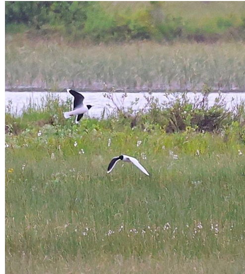
Spaning från fågeltornet vid Storsjödeltat Dvärgmåsar

Efter middagen for vi till Storsjö Kyrktjärn som är en grund lagun av Storsjön strax nedanför kyrkan. Nu hade vädret lugnat ner sig och det var stilla, fuktigt och stämningsfullt. I tjärnen sam svarthakedopping. I en snårbevuxen sluttning mot sjön sjöng en kärrsångare för fullt. Det gav oss goda möjligheter att memorera dess sång. Vi testade vad appen Merlin gav för svar men den gick bet på kärrsångare. Den indikerade i stället en del andra arter bland annat grönsiska vilket väl får sägas vara ett bra betyg åt den skickligt härmande kärrsångaren.