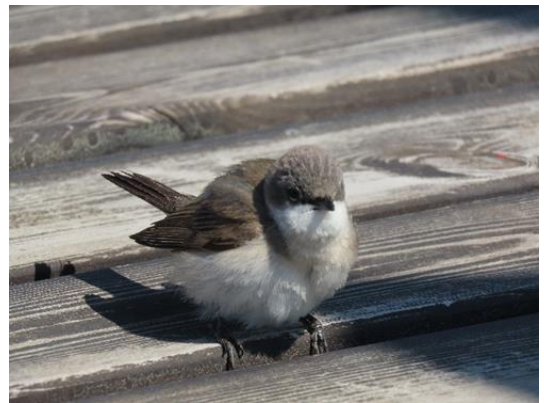
Ärtsångare under vårflytt