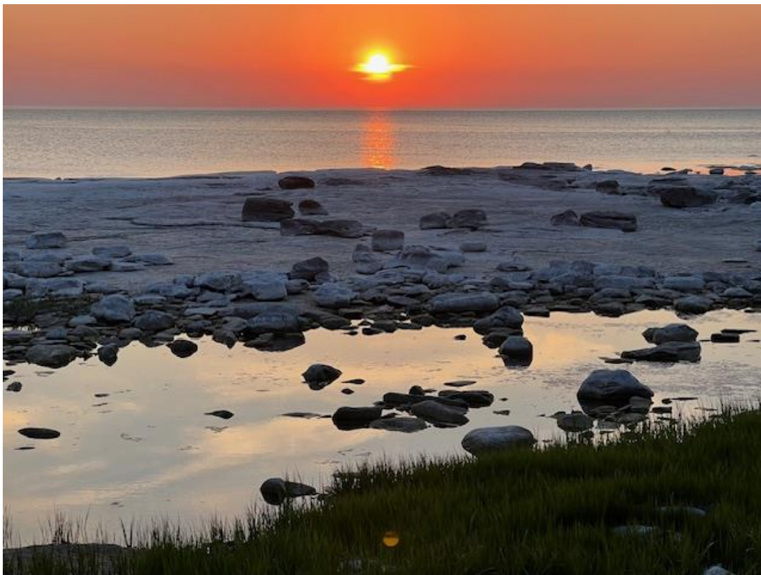
Solnedgång i havet

Fågelokallistan och artlistan är sammanställd av Per Helgesson