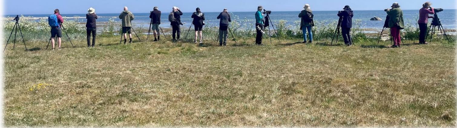
Skådning på Rivet