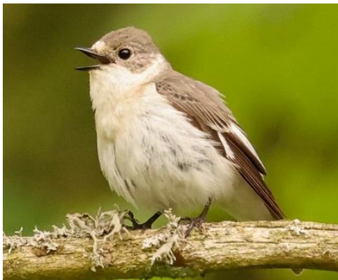
Hona och hane av halsbandsflugsnappare