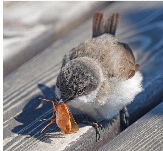
Årtsångare på färjan

Vårt första stopp efter att ha åkt av färjan var en utsiktspunkt ovanför hamnen. Där såg vi bland annat knölsvanar och ejder.