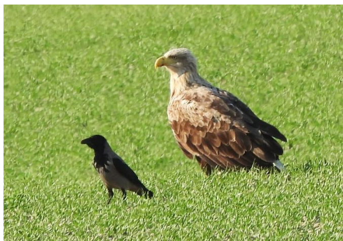
Kråka och havsörn