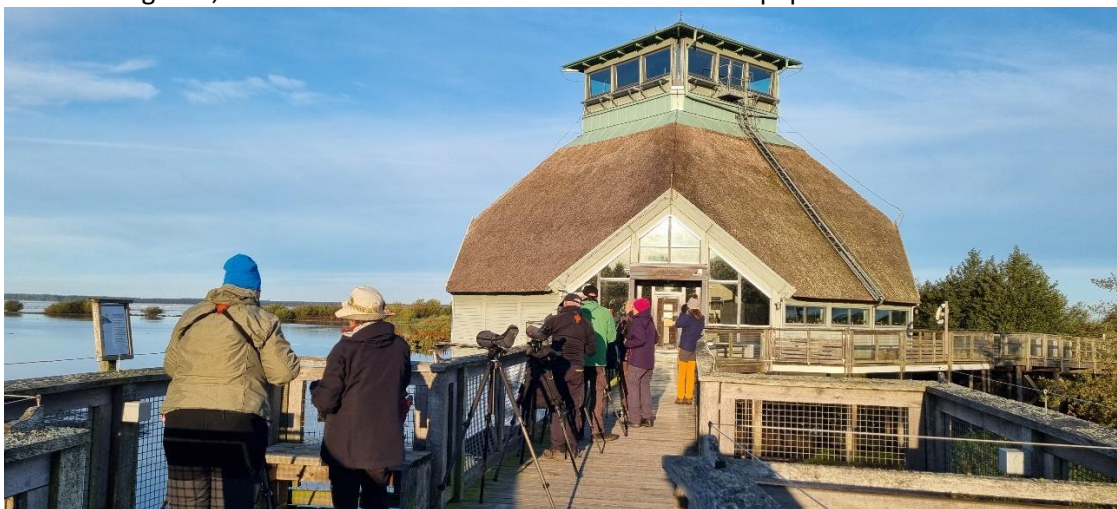
Naturum på Fågeludden, Hornborgasjön.

Eva – ”Härlig resa, allt funkade fint – förutom att bussen inte pep.”