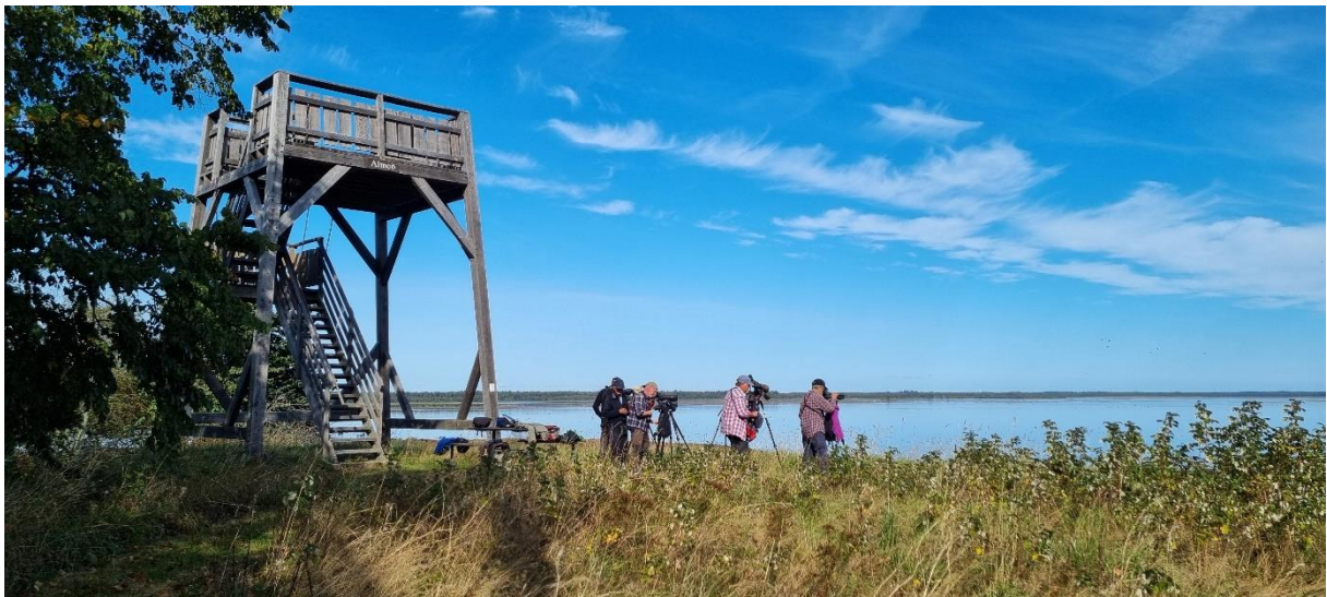
Tornet vid ALMEÖ.

Vi bodde vid den blå pricken och lokalerna vi besökte är inringade.