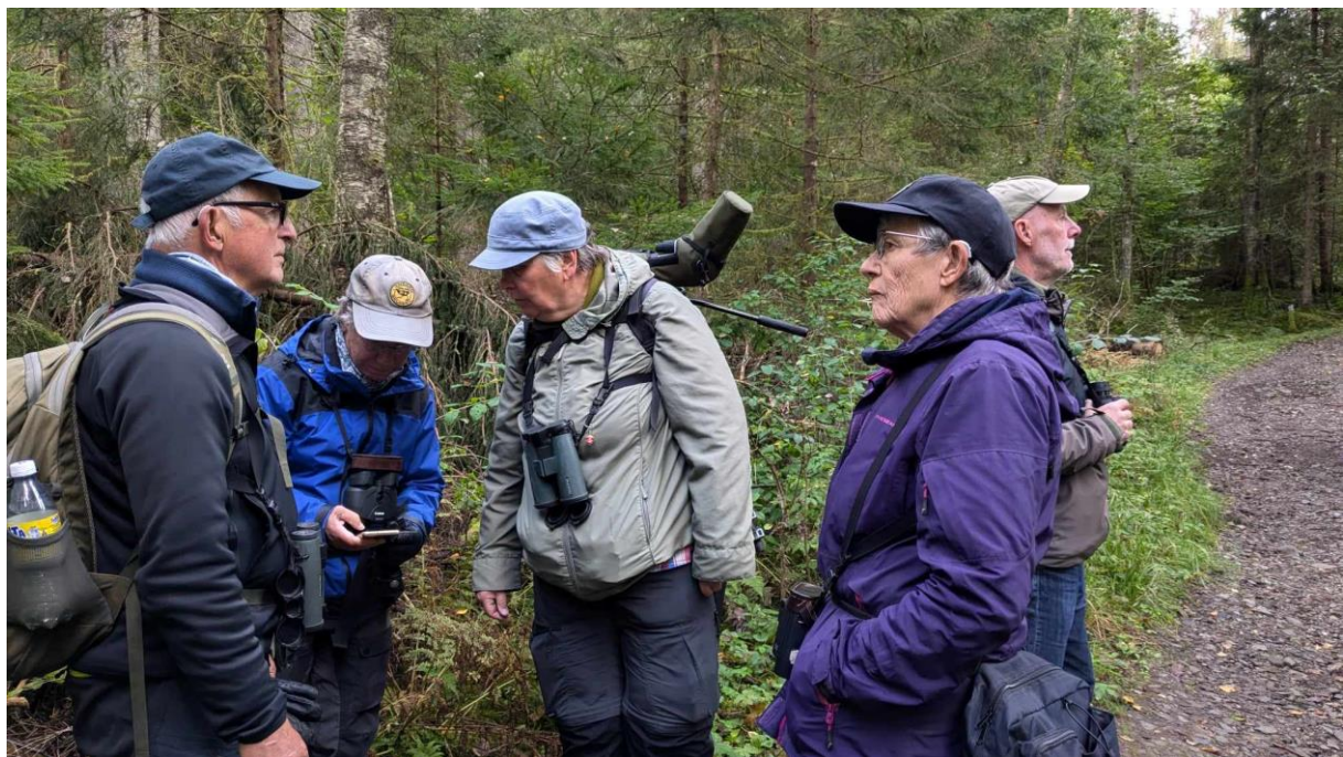
Vad 17 är det vi hör? Halleberg, måndag.