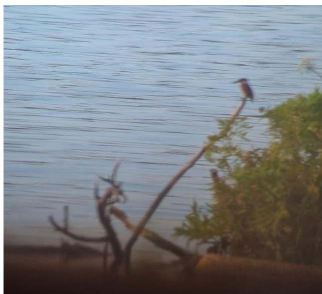
Ett bildbevis på den observerade kungsfiskaren Vid Krankesjön.

Därefter fortsatte vi till Silvåkratornet vid Krankesjön . Från tornet sågs stora mängder skarv och ägretthägrar. Nere vid gömslet lyckades delar av gruppen få se en kungsfiskare, medans några studerade en Kartfjäril, en dagfjäril som på sommaren får brunsvarta vingar med brett vitt tvärband och orange tvärlinjer. Arten påträffades första gången 1982 just i Skåne, men har nu spritt sig till andra delar av landet.