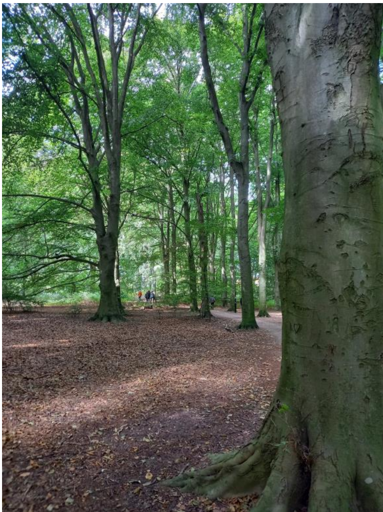
Pildammsparken, som för dagen inte ville visa upp någon trädgårdsträdskrypare.

Så var det dags för återfärd till Lunds station för återlämning av minibussarna och packa ner tuben för denna gång. Artgenomgången på tåget visade att vi nått imponerande 137 arter, mer än förra året trots att flera av förra årets inte kom med på listan. Idag hann vi se 102 arter varav 6 nya.