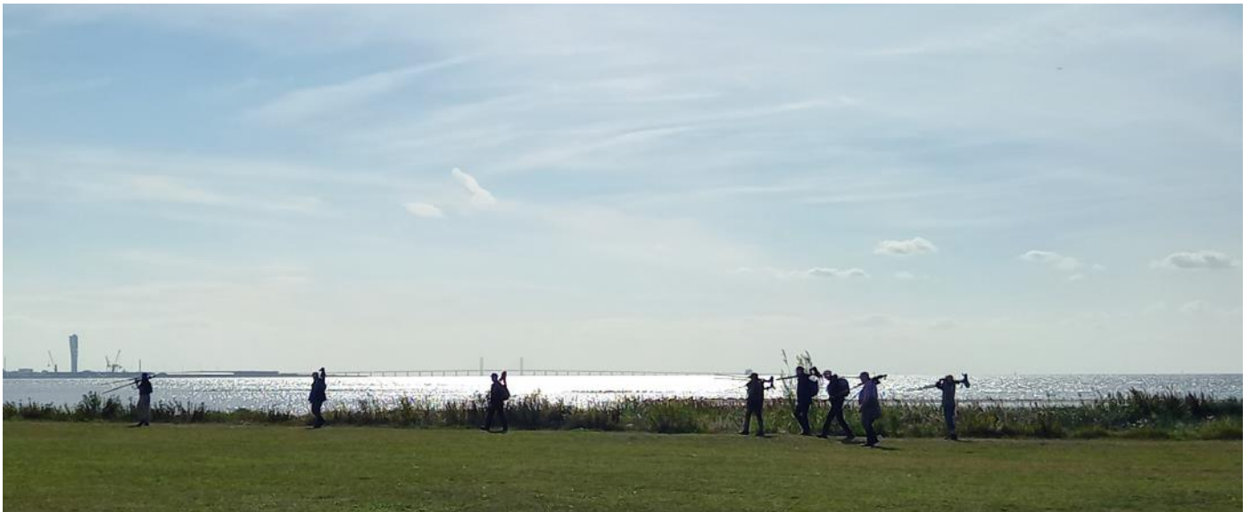
På språng i Lomma Södra. Lägg märke till Turning Torso i fjärran.