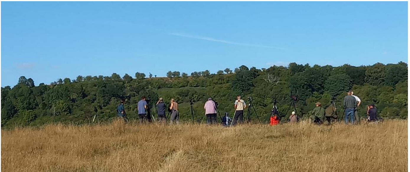
Fikat smakade gott med utsikt över Fyledalen och chans på kungsörn.