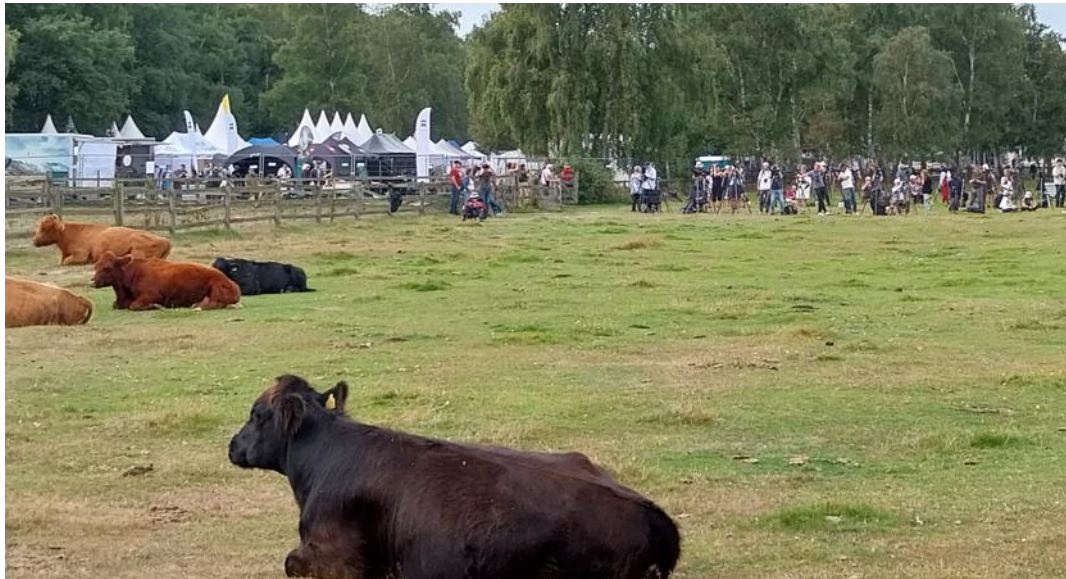
Korna på Ljungen tar uppståndelsen med upphöjt lugn.

Avresa till Ljungen och Falsterbo Birdshow . I år utlovades extra tid för de som ville passa på att besöka mässan. Några gick runt på mässan, några stod på Ljungen och kollade in bivråkarna och en grupp gick för att leta rätt på en svart-hakad buskskvätta. Lagom tills vi skulle gå flög en flock med 19 storkar över mässområdet, en helt magisk upplevelse.