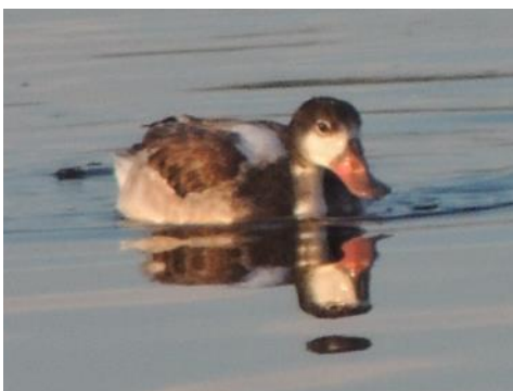
Unga gravänder är inte fullt så granna som de äldre..