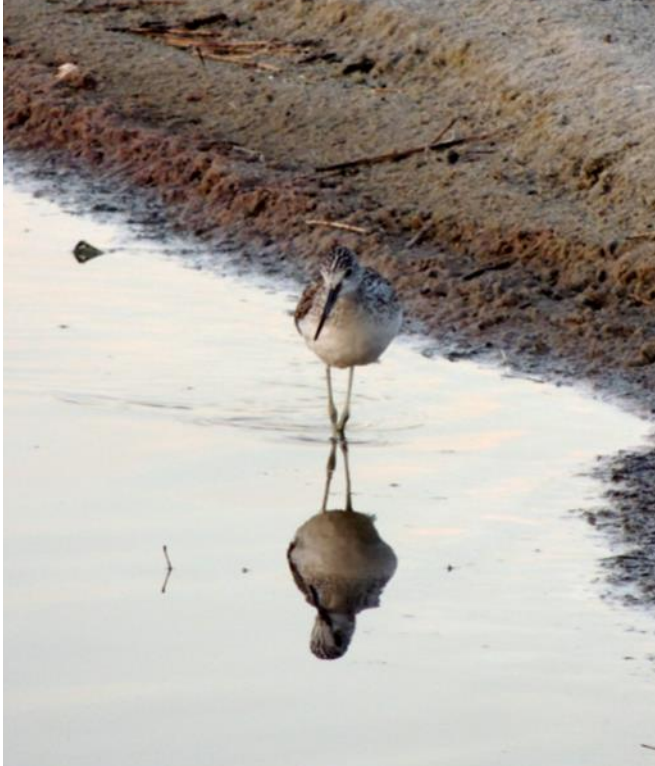
En gluttsnäppa står med benen ikors (eller inte).

Söndagen började även den vid Nabben . Nu fick vi chans att träna upp ögonen ordentligt på ungefär samma arter vidare som igår. Gluttsnäppa, rödbena, grönbena, myrspov, skogssnäppa och skärfläckor. Överflygande storlom fångades i tubkarna. Alla vitfåglar skannades av men ingen kunde identifieras som kaspisk. Havsörn sågs och längre ut låg det några sälar. Mindre skruvar med bivråkar passerade samt gott om sparvhökar och ryttlande tornfalkar. Uppe vid fyren pågick det ringmärkning av en sparvhökshane. I lagunen man passerar på väg ut till Nabben, såg flera i gruppen adulta och unga årtor som upplevdes som en familj. Men vid närmare studier och foton blev det bara honfärgade årtor tillsammans med honfärgade gräsänder. Minst tre årtor kunde ses.