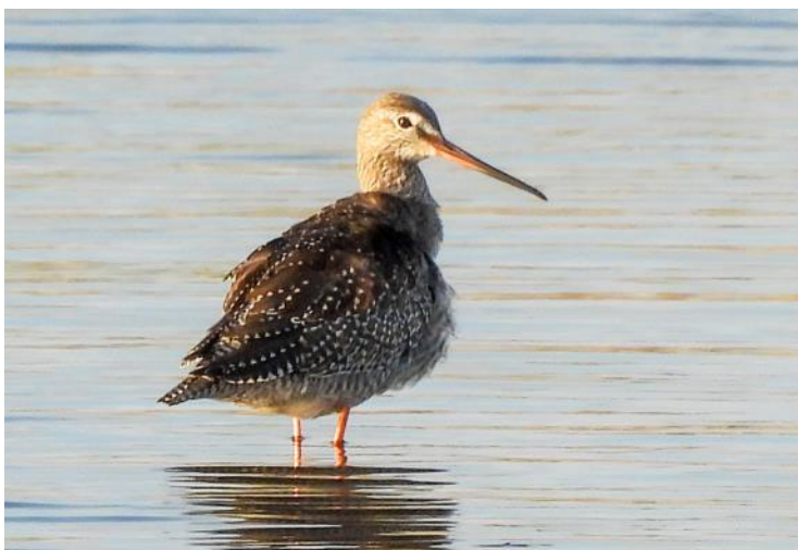
Svartsnäppan är inte svart så här års, men röda ben har den.