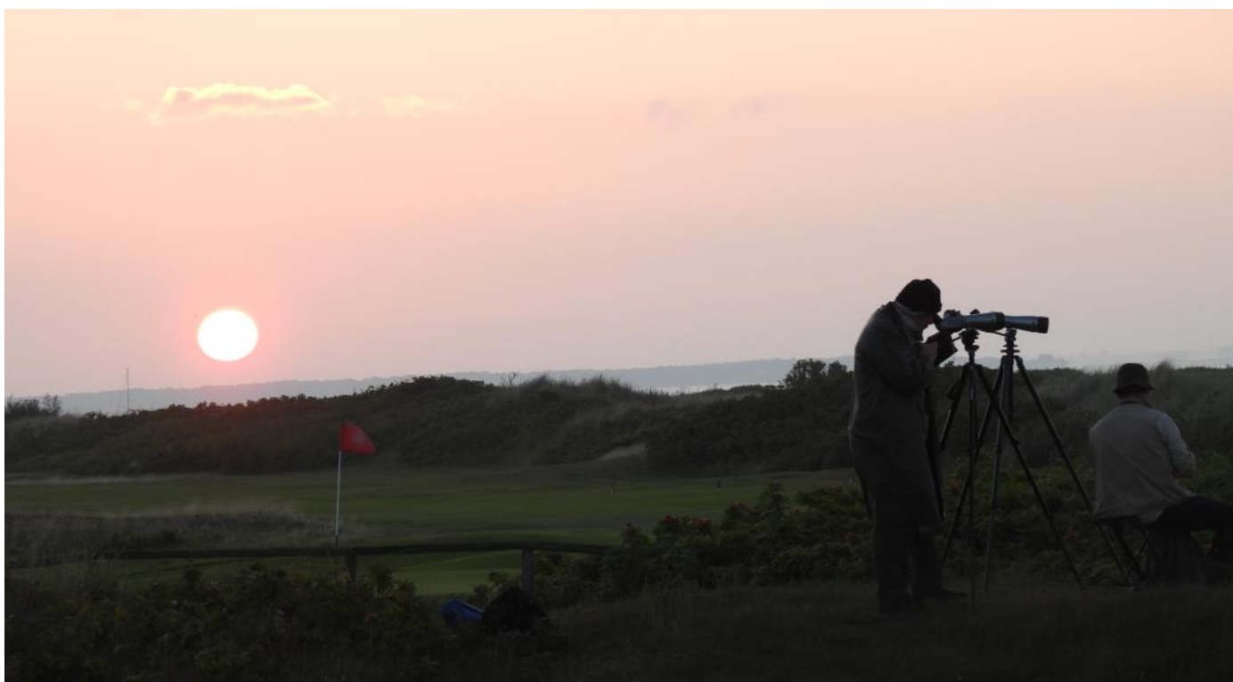
Klockan är 05.22 och solen har just segat sig upp över horisonten.

Avresa redan kl 05.00 till Nabben i hopp om att få en P plats. Detta lyckades tyvärr inte, så våra chaufförer åkte för att parkera bussarna. Resten av gruppen gick ut till Nabben där vi lyckades hitta lite skydd för vinden. På vägen ut sågs en skogssnäppa. Vackert väder bidrog till en härlig morgon och så gjorde även unga svartsnäppor, skärfläckor, myrspovar, gravänder, storlom, smålom och sjöorre samt en strid ström av sparvhökar. Överflygande ägretthägrar och sångsvanar utgjorde en vacker syn på den klarblå himlen. Efter en andra frukost vandrade vi längs stranden tillbaka mot golfbanan. Ett flertal sandlöpare sågs och kråkor varav en blev föremål för närstudier – kunde det manne vara en svartkråka? Väl åter vid parkeringen och i väntan på våra chaufförer passade en deltagare på att förhandla med vakten vid Golfklubben. Kunde vi möjligen få stå på deras parkering tidig morgon och till vår avresa till Birdshowen, innan golfarna vaknat? Och visst fick vi det, tyckte den jovialiska skåning- en.