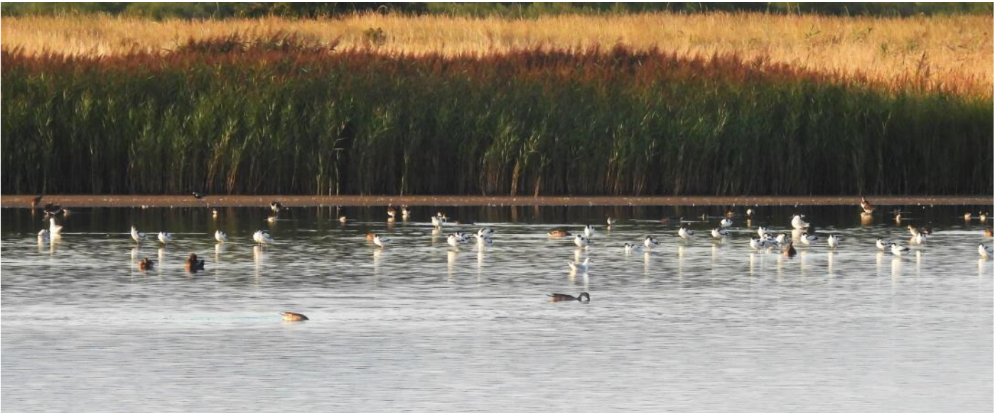
Återigen en härlig mängd fåglar att skåda, arta och njuta av vid Nabben.

Morgonen började som de andra två med Nabben med möjlighet att öva på samma vadare som tidigare mornar, men också en vattenrall som sprang i vattenbrynet. Överflygande små- och storskrakar, och en sjungande törnsångare.