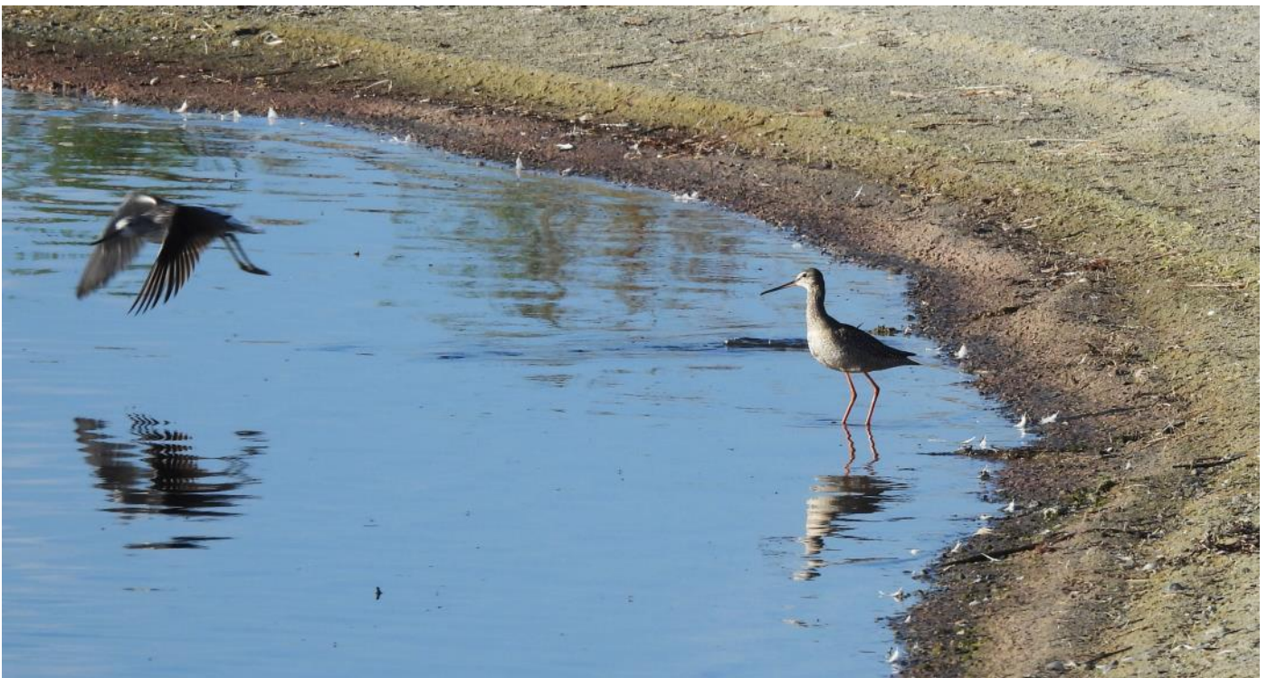
Sjas! Sa svartsnäppan till gluttsnäppan.