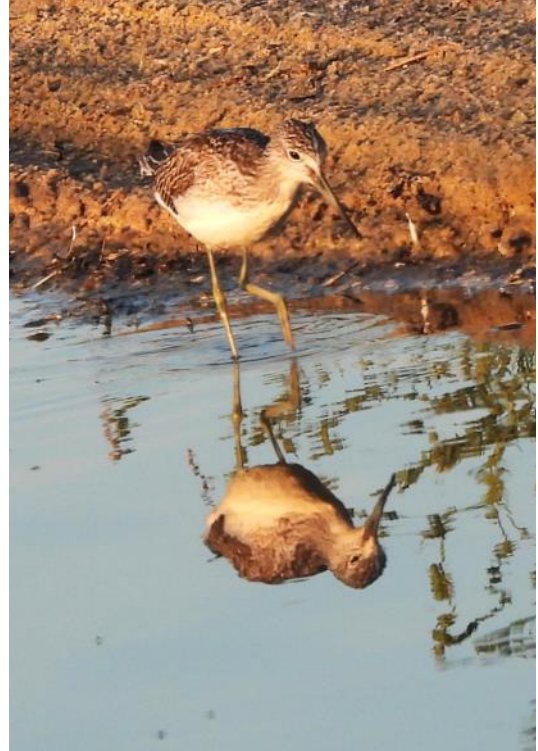
Sen speglar den sig i det lugna vattnet.