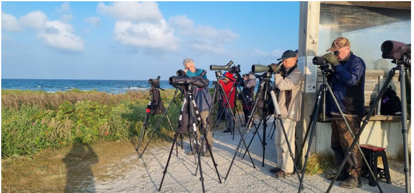
Tidig morgon vid vindskyddet på Nabben