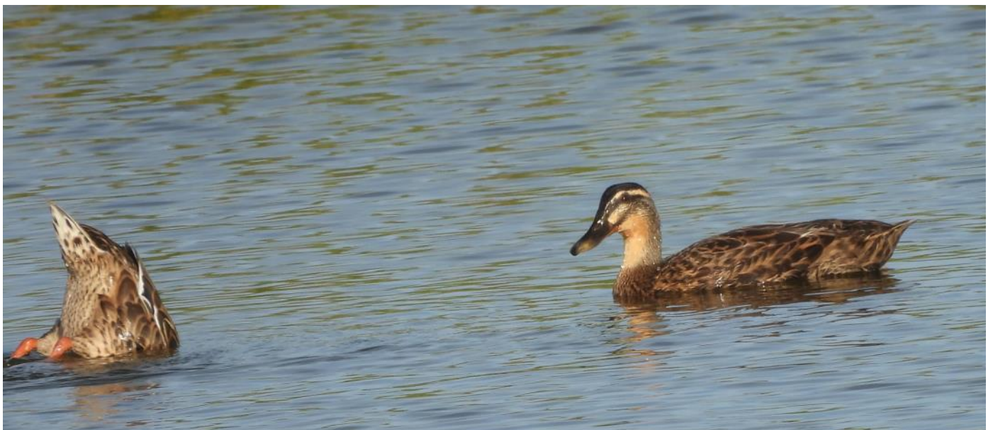
En honfärgad årta och en födosökande gräsand.