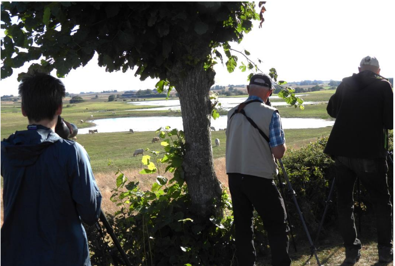
Den nya lokalen Baldringe våtmark bjöd på långt skådaravstånd, men förtjänar absolut ett återbesök.

Efter ett snabbt stopp på vandrarhemmet, intogs kvällens middag på Restaurang Lotus i Höllviken med kinamat. Sedan artgenomgång, som visade att vi sett 100 arter idag, varav 35 nya. I och med att parkeringen var fixad för morgondagen meddelande Gustav att vi hade sovmorgon. Ny avresetid 05.15!