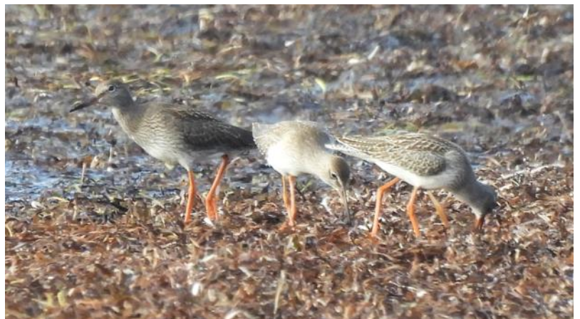
Sparvhöken vilar medan svartsnäpporna födosöker i godan ro.