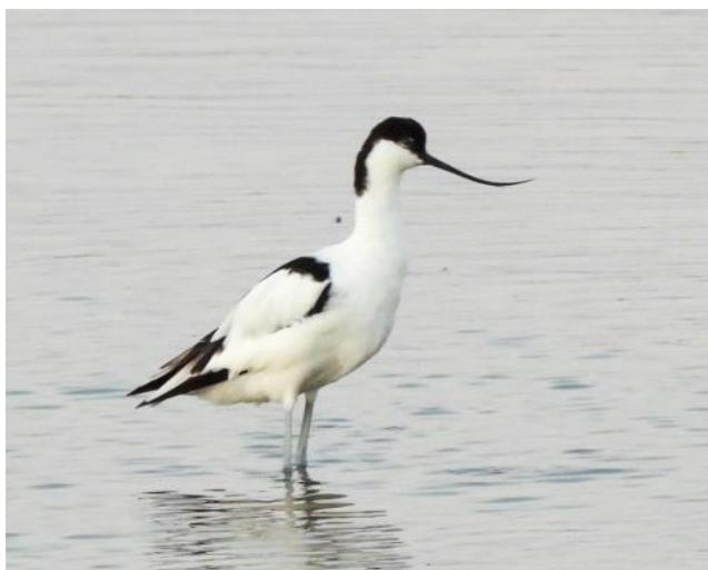
En av fågelvärldens elegantaste fåglar, skärfläcka.