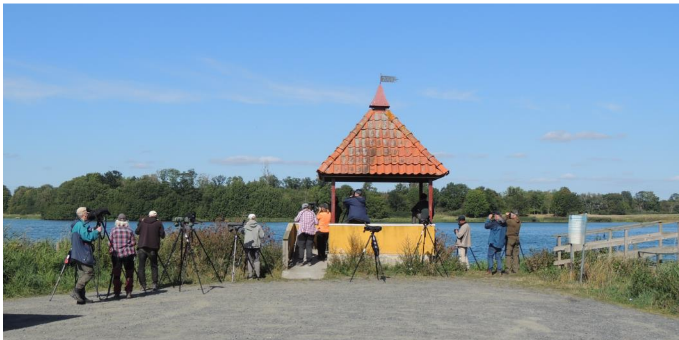
Näsbyholmssjön brukar leverera rikligt med arter, men idag var det ovanligt tunt.

Vi fortsatte sedan till Havgårdssjön för att kolla in rovfåglar, där havsörn, ormvråkar och kärrhökar sågs, samt tornfalk som var mycket vanlig under hela resan. Utmed vägen sågs flera fasaner. Vid Näsbyholmssjön fick vi förutom gäss, också både smådopping och skäggdopping.