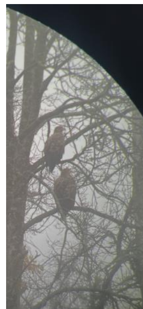
Havsörnarna i trädet som observerades inne från paviljongen

Här hoppades många att få se kungsfiskare som hade rapporterats i flera dagar. Men först måste vi äta lunch. Eftersom det hade börjat regna så var paviljongen en utmärkt plats. Den ligger nära parkeringen, är stor och har tak. Dessutom finns mycket småfågel i buskarna bredvid. Som synes av bilden till höger kan man även skåda och fotografera örnar inne från paviljongen. Lagom till vi var klara hade regnet nästan upphört. Nu var alla laddade. Vi hittade först två havsörnar som satt ganska långt ned i ett träd. Vi hörde även spillkråka. Vi fortsatte mot tornet. På vägen såg vi lite olika änder i dammarna. Förutom de alltid närvarande gräsänderna sågs även snatteränder och bläsänder. Sedan fortsatte vi till Skålpussen och vidare mot utloppet, men trots ivrigt spejande under hela vandringen, fann vi ingen kungsfiskare denna gång. På återvägen såg vi en stor flock starar.