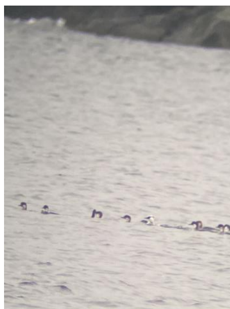
Salskrakar efter att en ny flock landat. En hane syns.