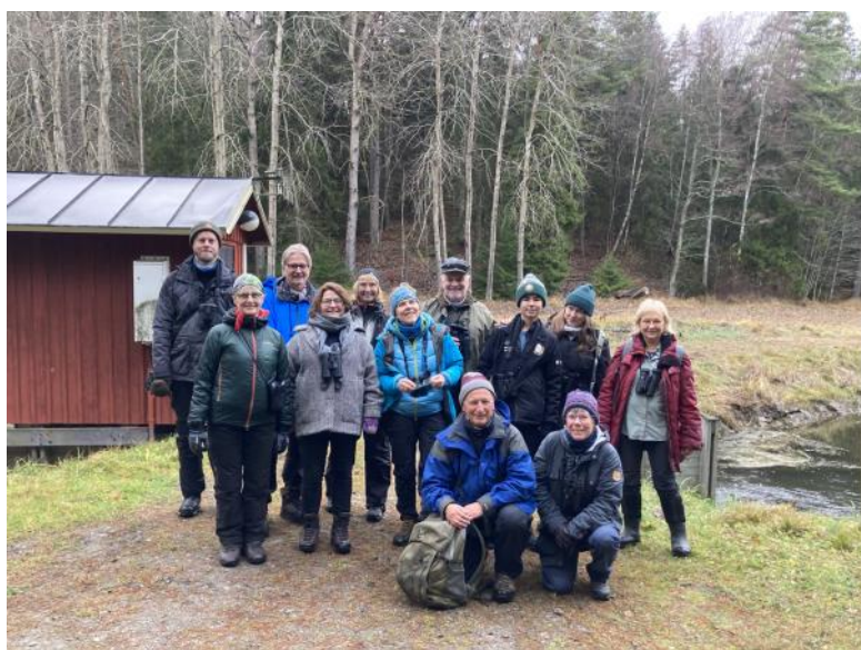
Det obligatoriska gruppfotot.