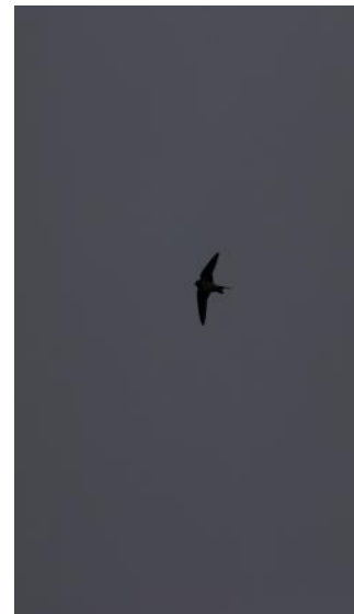
Den oväntade ladusvalan.

Nu tog vi oss ner till Södertörns sydligaste punkt, Ankarudden . Här flög konstigt nog en ladusvala runt. Den hade inte förstått att den borde flyga söderut. Sedan for vi norrut igen och via ett snabbstopp för att peka ut lokalen Herrhamra ängar, åkte vi till Alhagen . Detta är en våtmark, skapad av Nynäshamns kommun, för att rena avloppsvatten. Via en räckad dammar, förs vattnet vidare och blir renare och renare och när det kommer till utloppet är det klart att släppas ut i Östersjön. En mycket bra teknik, som tillämpas på många håll i landet.