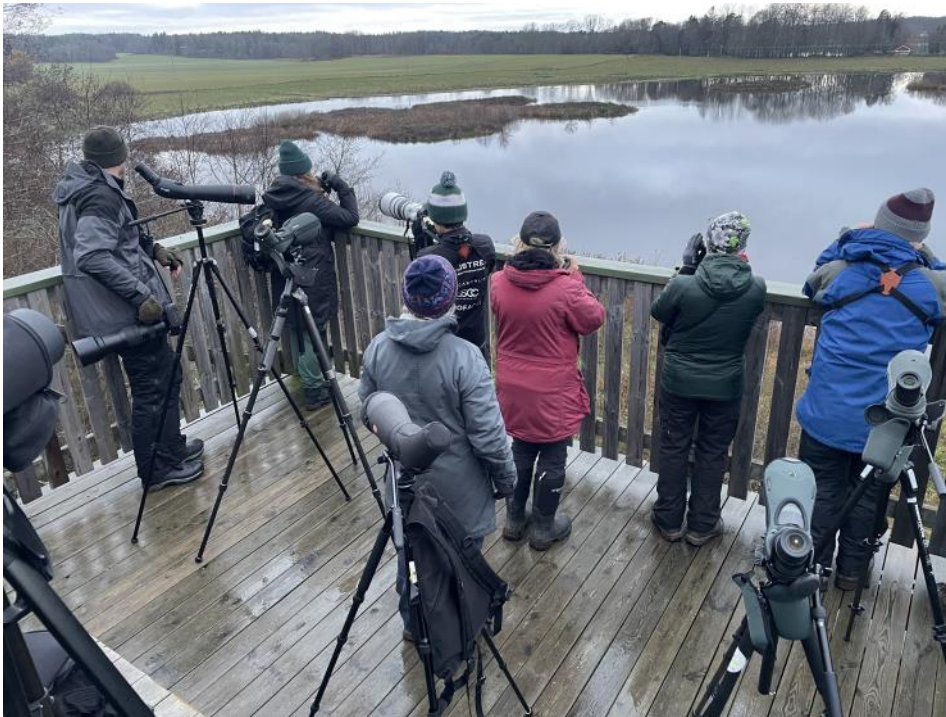
Gruppen samlad i fågeltornet vid Östra Styran.

Eftersom det var så fin skådning vid Östra Styran så bestämdes att vi skulle stanna lite längre än planerat. På vägen hem för vi inte tillsammans utan alla styrde mot de platser som var bäst för respektive passagerare. Den bilen som jag åkte i var inne i Stockholm runt 17-tiden efter en mycket trivsam tur i höstmarkerna på Södra Södertörn. Det var definitivt en heldagstur.