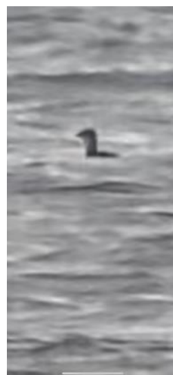
Det syns att tobisgrisslan ligger långt bort.