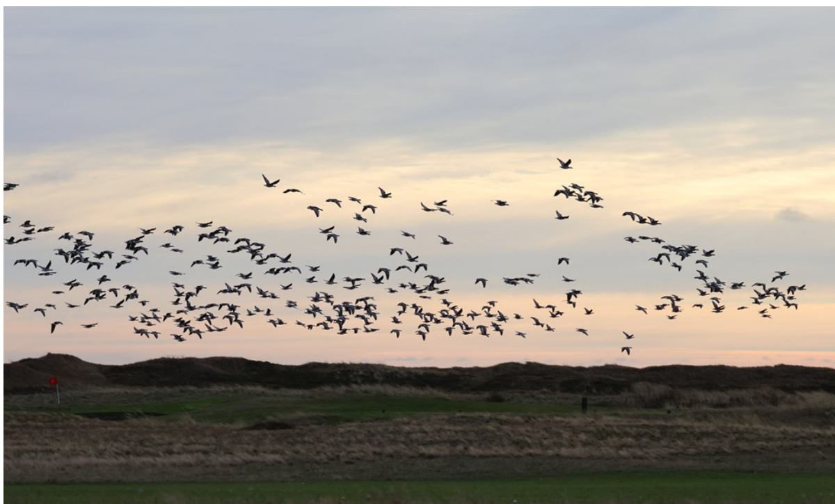
Vitkindade gäss över Nabben