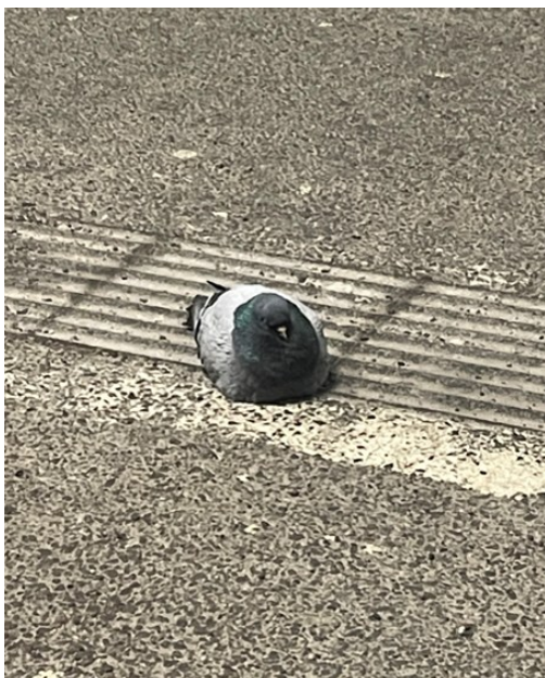
Tamduva på perrongen i Lund

Efter Löddesnäs bar det av till Lunds station för hemresan, vi var där i god tid för att hinna packa om och eventuellt byta lite kläder innan tåget gick. Det visade sig dock vara helt i onödan. På grund av en olyckshändelse blev tåget från Lund till Stockholm ett par timmar försenat. Vi tillbringade tiden i vänthallen men också på perrongen då informationen om när tågen skulle komma igång igen i första hand gick ut där. På perrongen fick vi sällskap av en tamduva som fick bli vår sista fågelobservation på resan.