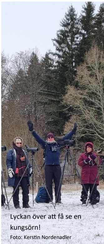
Lyckan över att få se en kungörn!