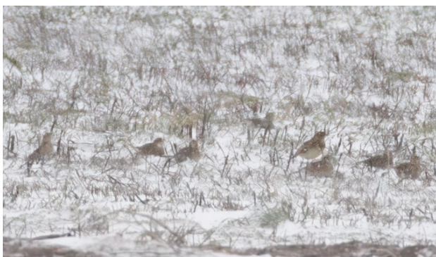
Sånglärkor i snö

När vi fått nog av blåsten vid Sandhammaren drog vi vidare för lite gässspaning vid Kabusa.