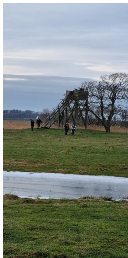
Fågeltornet i Löddesnäs