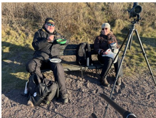
Njuter i solen