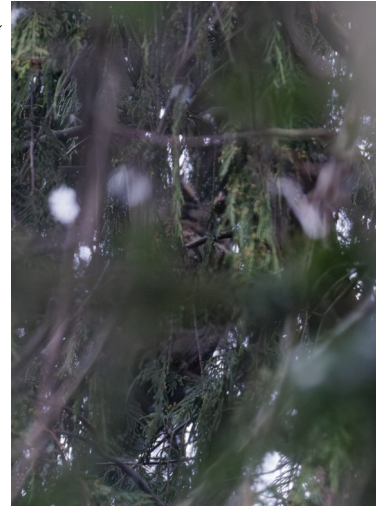
Svårskådad hornuggla

Vi lämnade ugglan och for vidare mot Lunds reningsdammar som bland annat bjöd på smådopping, rörhöna, snatterand, brunand, bläsand och en förbiflygande ormvråk. Efter idogt spaningsarbete lyckades