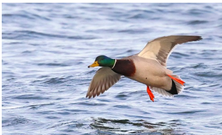
Gräsand går in för landning