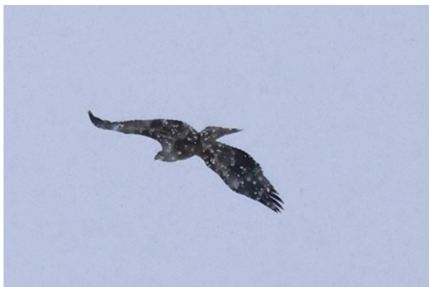
Havsörn i Fyledalen