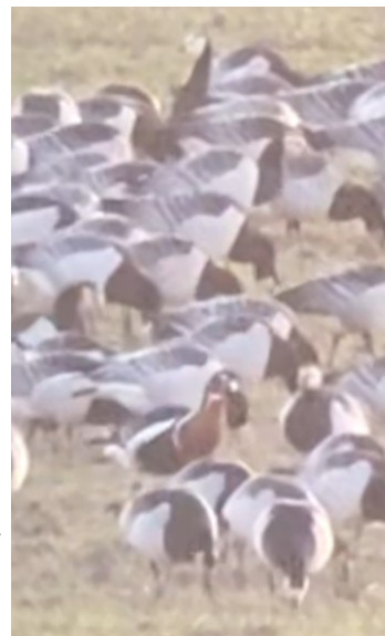
Gås med röd hals

Eftersom vi var nöjda med gårdagens middag på Byakrogen i Blentarp blev det samma middagsställe denna kväll. Efter middagen bar det hem till artgenomgången och sedan direkt i säng.