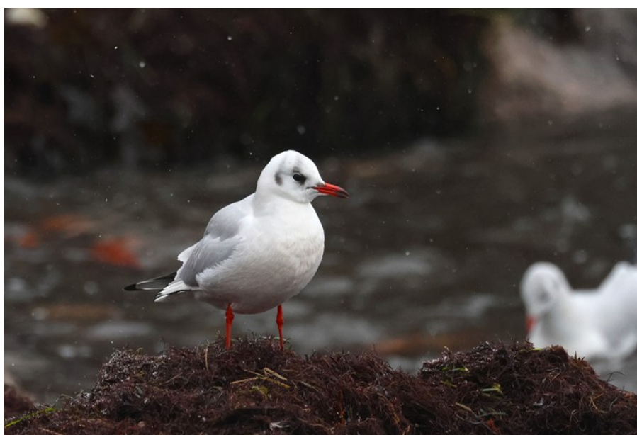
Skrattmåsar vid Världens ände