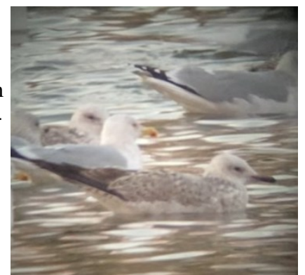
Kaspisk trut Flyinge

En god middag intogs på Blentarps Byakrog. Artgenomgång och sedan i säng. Det var inga som helst problem att somna efter dagens alla upplevelser.