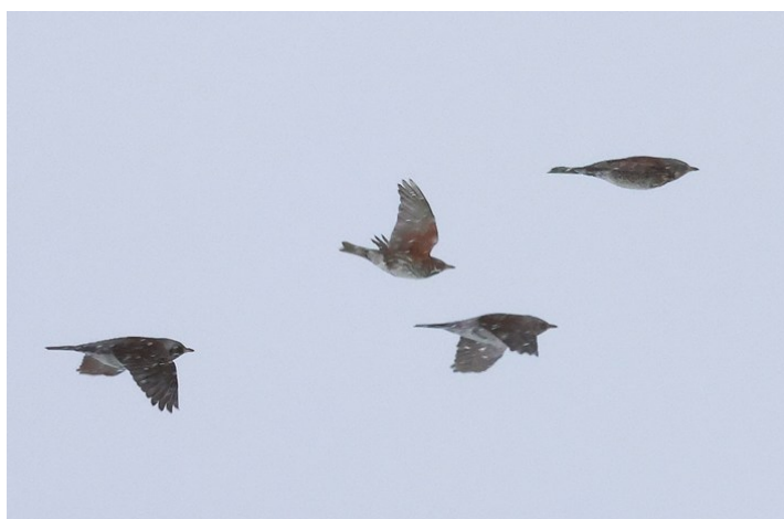
Rödvingetrast i Kabusa

Reseberättelsen är skriven av Eva Karlsson