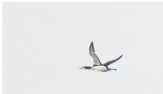
Storlom med stora fötter

Vädret blev något annorlunda än gårdagens prognos lovade. Förväntningarna var en solig men blåsig dag, men istället möttes vi av en äkta skånsk snöstorm. Framme vid dagens första lokal, Sandhammaren, fick vi ta på oss alla extrakläder vi tagit med oss. Även om det var lite besvärligt med sikten ibland så fick vi ändå in en hel del. Här fick vi till exempel resans första lommar (1 stor och 2 små), alfåglar, svärtor, sjöorrar, ängspiålar och en svart rödstjärt.