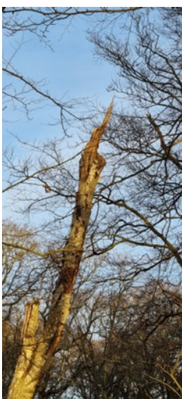
Bobs björk

gonstans bland alla vitkindade gäss... Man kan tro att det ska vara lätt att hitta en gås med röd hals bland alla svartvitgråa vitkindade gäss, men så är det inte. Lite frustrerade skådare ropade ”Är det någon som ser den? Nej inte nu. Men nu ser jag den, framför ladan!”. Vi jobbade intensivt på den och till slut hade alla i gruppen sett den rödhalsade gåsen innan det började skymma. Som bonus fick vi också se en hona blå kärnhök som dök upp vid ett par tillfällen medan vi gick igenom gässen.