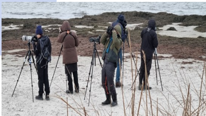
Intensiv skådning i Lomma