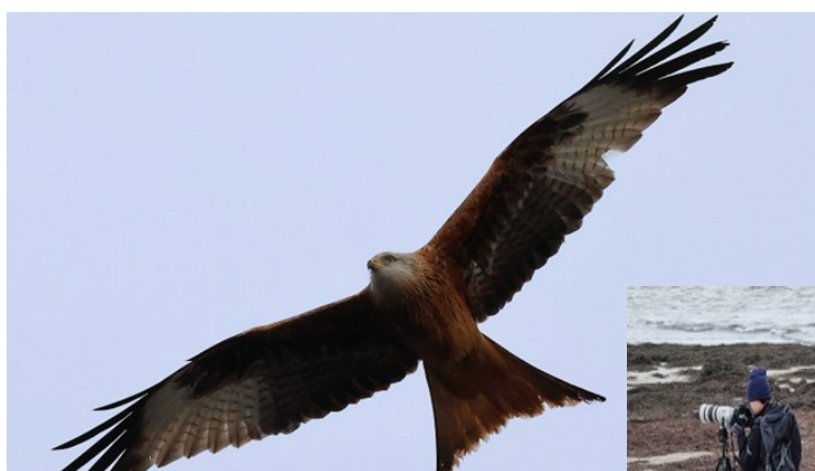
Röd glada över Lunds centralstation

Dagen avslutades med shopping på Coop utanför Sjöbo. Sedan bar det hem till vandrarhemmet, artgenomgång och bums i säng.