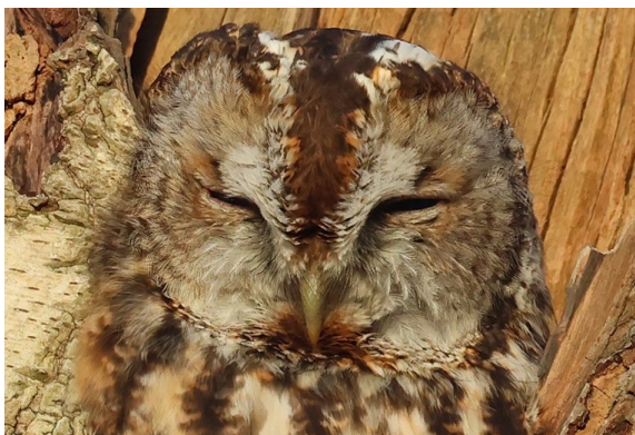
Kattugglan Bob i Sofiero