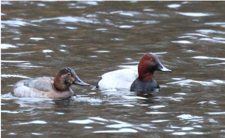
Brunand, hona och hanne

Traditionsenligt blev sedan det första stoppet hos hornugglan vid van Dürens väg. Ugglan var inte helt lätt att upptäcka, men satt ändå där och viftade på örat. Med hjälp av varandra lyckades alla få in den i kikaren till slut.