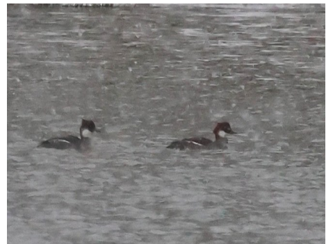
Salskrakar i snöyra

Precis när vi skulle packa in tubkikare och ryggsäckar i bilarna för avfärd kom en havsörn och cirklade över oss och vinkade av oss på färden.