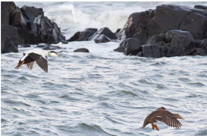
Ejdrar vid Svarteskär

En ganska tuff dag även idag. Visserligen sken solen och gjorde landskapet ljust och inbjudande, men vinden var isande kall. Under dagen avverkade vi några lokaler i den nordvästra delen av Skåne med början i Torekov, nästan på gränsen till Halland.