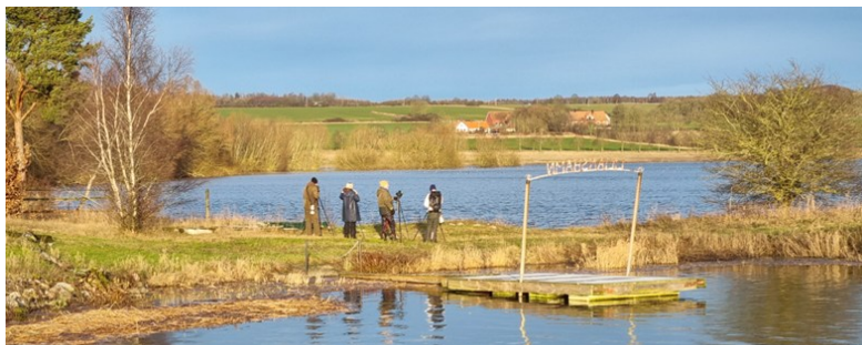
Sol över Vombsjön!

Lagom när vi kom fram till Vombsjön så tittade solen fram. Vi spanade efter kungsfiskare i Klingavälsåns utlopp, utan att den visade upp sig. Men vid strandkanten i Vombsjön fick vi i alla fall en tjusig ägretthäger, belyst av solstrålar. Vombs ängar var till stor del översvämmade och frusna och det var