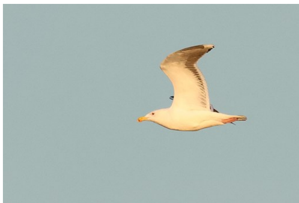
Havstrut Skanörs hamn

Fjärde och sista dagen på resan i det vintliga Skåne. Dags att packa och ta adjö av Blentarps vandrarhem för denna gång. Vi började dagen i Skanörs hamn. Samtidigt som oss anlände en kvinna och en man i morgonrockar redo för ett dopp i havet, men ingen i gruppen blev sugen att hänga på. Målet med stoppet var istället att få syn på den praktejder som rapporterats där. Lite vanliga ejdrar, småskrake, viggas, och annat smått och gott sågs bland vågorna, men tyvärr ingen praktejder.