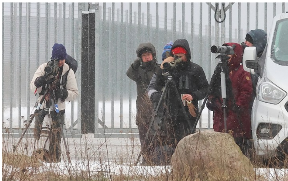
Skådning vid Världens ände

Vid en matning som låg bakom några bodar lyckades vi få in pilfink, gråsparv och rödhake. Check på reselistan innan vi satte oss i bilarna igen! Nu bar det av mot Fyledalen och, förhoppningsvis, kungsörn!