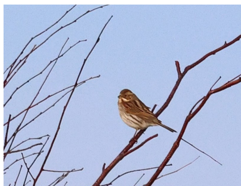
Sävspurv vid Nabben