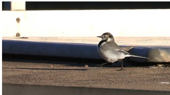
Årets första sädesärta?

Raskt drog vi alltså vidare till Höganäs med förhoppningar om turkestanrödstarten som uppehållit sig där några dagar. Vi fann den inte, kanske hade den farit iväg med gårdagens stormvindar, men den var ändå väl värd försöket. Som tröst kunde vi njuta av den härliga synen av några havssulor. Vi stockholmare är ju inte så bortskämda med havssulor. Snösparvar, vinterhämplingar och en ensam sädesärta förgyllde också stoppet.