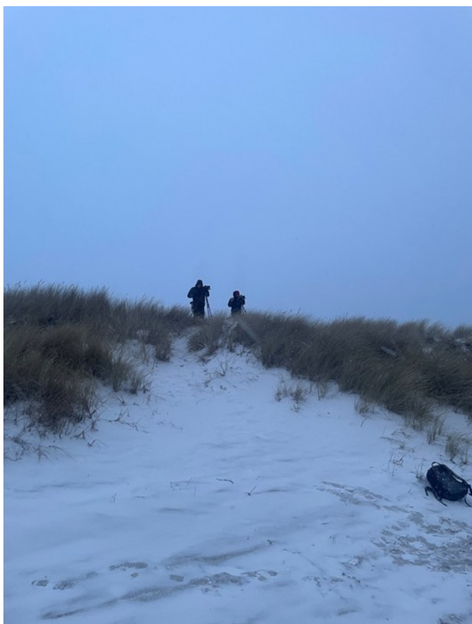
Morgon vid sandhammaren