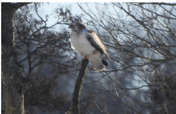
Ljus ormrör