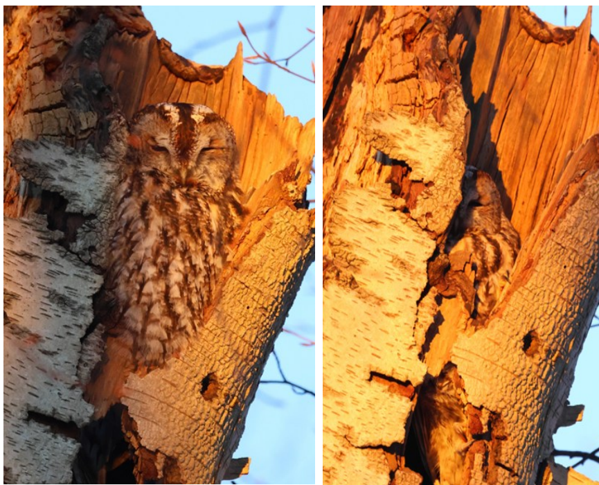
Kattugglan Bob i sin björk

Med trådgårdsträckryparen i hamn gick vi bort och hälsade på kattugglan Bob som satt och solade sig i sin björk. Efter ett tag verkade han tröttna på att bli iakttagen och fotad av ett gäng fågelskådare, och kröp ner i sitt hål och spanade ut på oss lite mer i skymundan.