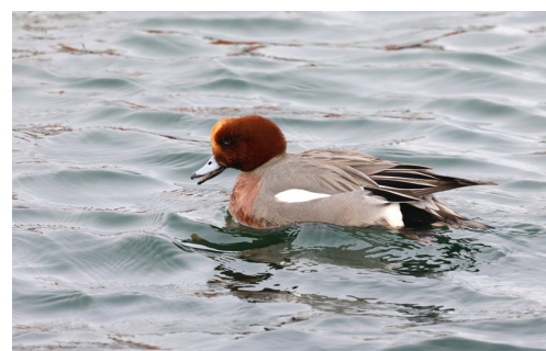
Bläsand utfärgad hane

Sista stoppet på resan var Löddesnäs, här hade vi inte allt för mycket tid då vi hade ett tåg att passa. Några av oss valde att gå ner mot havet och fick se ett par entusiastiska skridskoåkare som passade på att utnyttja skånska vintern, fåglar var det däremot ont om. Några gick till fågeltornet och eftersläntrarna i den gruppen fick se en pilgrimsfalk. Några gick på en fin promenad i en skogsduge i närheten. Tillbaka på parkeringen fick de flesta se en stilig blå kärrhök som gled fram över vassen på spaning efter något ätbart.