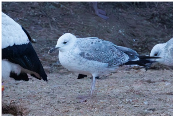
Kaspisk trut

Dagen sista stopp var Flyinge kungsgård, här var det nästan så vi storknade av alla storkar på gödselhögen och på taken. På gödselhögen fanns det också ett antal gråtrutar och även en kaspisk trut. Det blev heta diskussioner om vilken individ som utpekades som kaspisk trut och om det verkligen var en kaspisk trut som vi såg. Till slut var alla överens om vilken fågel vi diskuterade och att det faktiskt var en kaspisk trut. Tillfreds med detta tittade vi oss omkring lite mer i området och fick som bonus se en forsärla som höll till vid en grej som satt på väggen till ett stall.