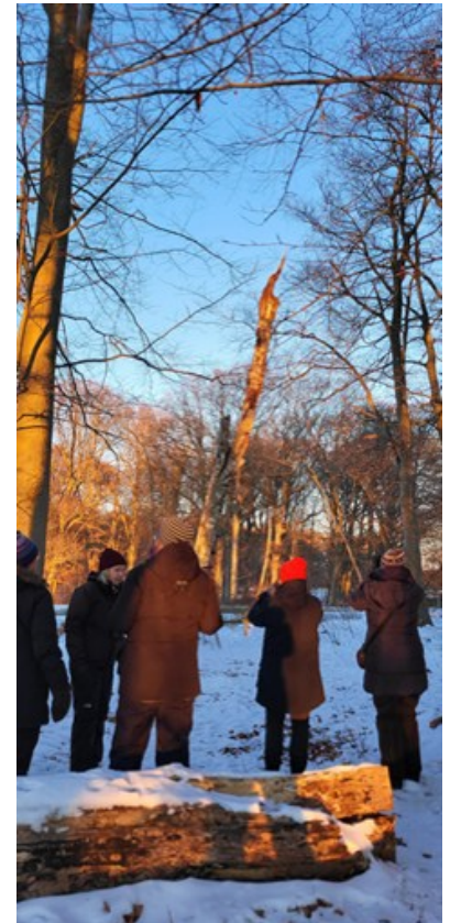
Sofiero