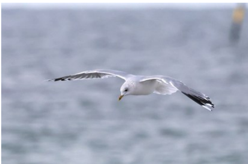
Fiskmåsar i Skanörs hamn