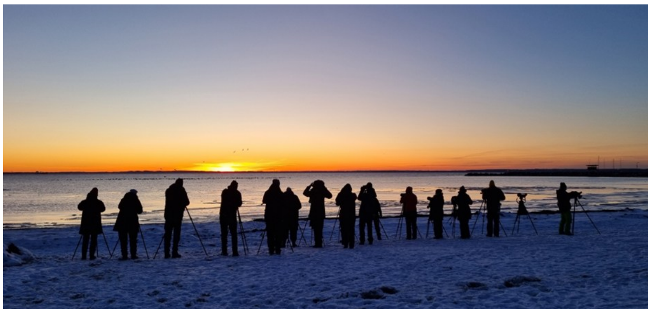
Fågelskådning i solnedgång

Efter en kortare skådning i Råå gick färden hemåt. Middagen intogs på Blentarps värdshus och efter en lång dag var det en kort artgenomgång innan det var sängdags.