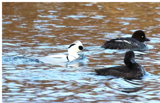
Hanne salskrake, honor av vigg och knipa

Nästa stopp blev Lunds reningsdammar, här fick vi se en hel del ånder som kricka, snatterand, bläsand, stjärtand men även en salskrake, utfärgad hanne. Vi hade också en vattenrall på nära håll, och en försärla visade upp sig. En spännande iakttagelse var en gräsand som förgäves försökte äta en padda. Paddan var alldeles för stor för gräsanden, som dessutom attackerades av skratmåsar som också var sugna på paddan. Till slut lyckades en mås norpa åt sig paddan och försvann med den i näbben medan gräsanden fick leta vidare efter mer lätthanterlig föda.