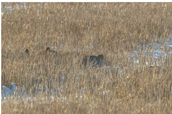
Hukande raphönor

vända med bilarna så alla fick se dem. Imponerande av Mona att upptäcka dem, vid en snabb blick såg det mest ut som några jordhögar på ett fält. Men raphönor var det!