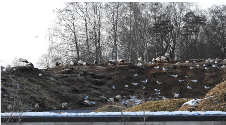
Storkar, trutar, måsar på gödselstacken

Nu började det skymma och nöjda med vårt stopp i Flyinge kunde vi starta hemfärden mot Blentarp igen.