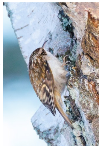
En helt vanlig trädskrypare

Nästa stopp blev Pålsjö skog vid Sofiero, här var mållarten trädgårdsträdskrypare. Efter en del lyssnande och spanande lyckades vi få in den. Lite klurigt var det då det även fanns flera "vanliga" trädskrypare i samma område. Men även om arterna är väldigt lika till utseendet så finns det saker som skiljer. Sången skiljer sig till exempel mellan arterna, och det var just genom denna som vi till slut fick syn på en trädgårdsträdskrypare.