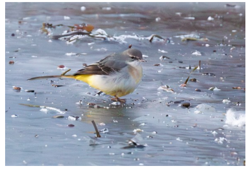
Forsärla på stranden

Efter att ha städat våra rum och packat bilarna tog vi oss Albäckåns mynning utanför Trelleborg. Här fick vi se en grupp förbiflygande salskrakar och ännu en forsärla som for omkring på stranden. Av andra