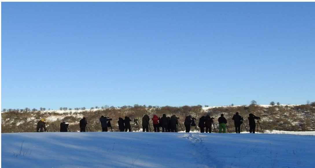
Spaning efter kungsörn i Fyledalen