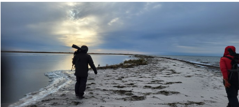
Promenad på reveln på spaning efter berglärka

Bland det första vi mötte bland dynerna på väg ner mot stranden var en rödvingetrast. Väl nere vid stranden