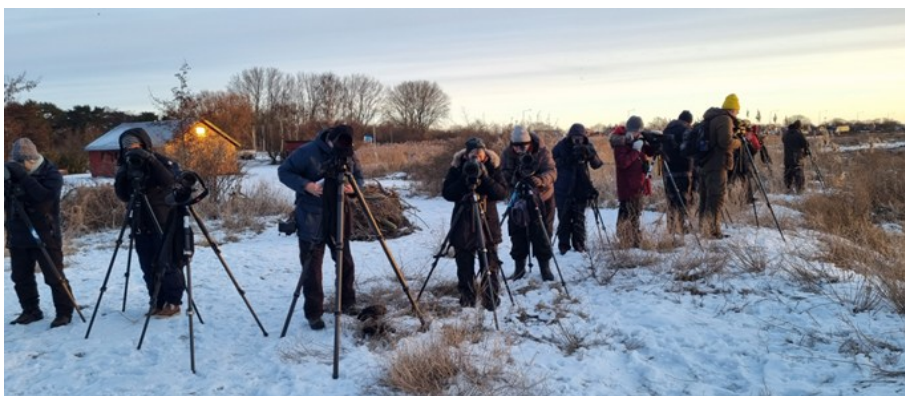
Albäcksåns mynning