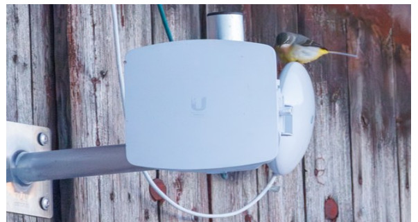
Forsärla på grej

Kvällen avslutades med sedvanlig artgenomgång och instruktioner om morgondagens skådning och hemfärd. Sen var det godnatt!