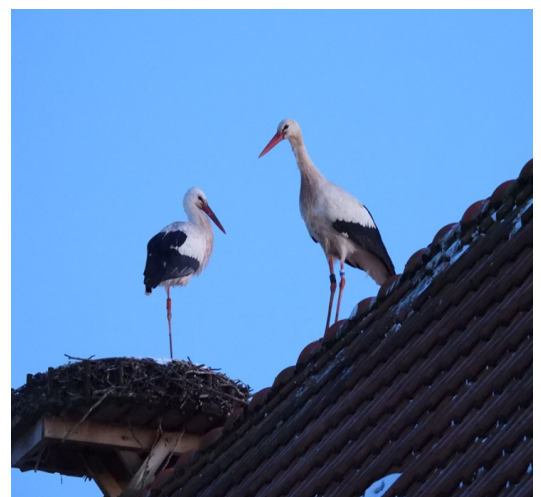
Vita storkar