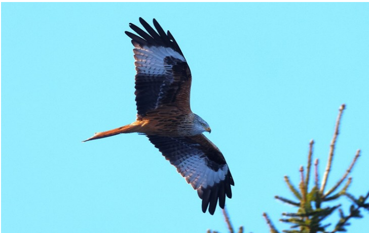
Röd glada