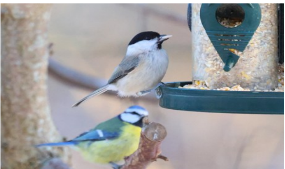
Entita och blåmes

Vi ville också besöka en matning vid Vege å en kort promenad bort. Entita, gulsparv, grönsiska och bergfink hörde till besökarna vid matningen, och så naturligtvis blåmesar och talgoxar. På vägen till matningen fick vi fina obs