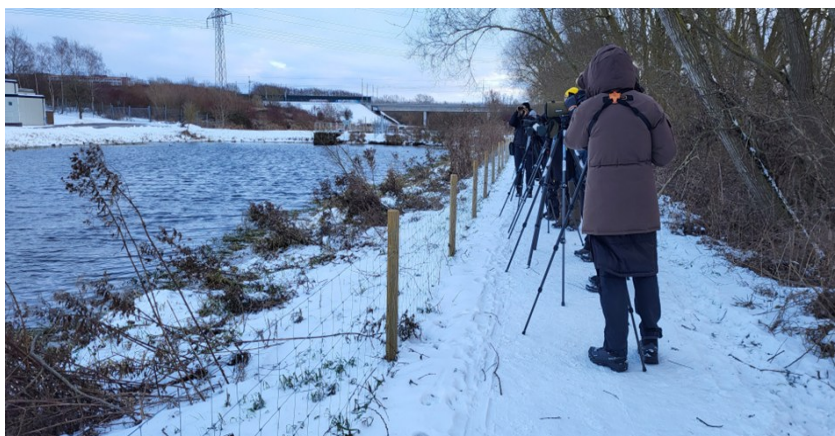
Skådning vid Lunds reningsverksdammar

Väl framme på vandrарhemmet installerade vi oss i våra rum, för att sedan åter ta oss en tur till en Pizzeria i Sjöbo för middag. Efter middagen, var det dags för frukost- och lunchinhandling. Väl hemma på vandrарhemmet igen var det artgenomgång. Sammanlagt 51 arter lyckades vi samla på oss under dagen. Nöjda och trötta var det sedan läggdags för att sova och vara utvilade till nästa dag.