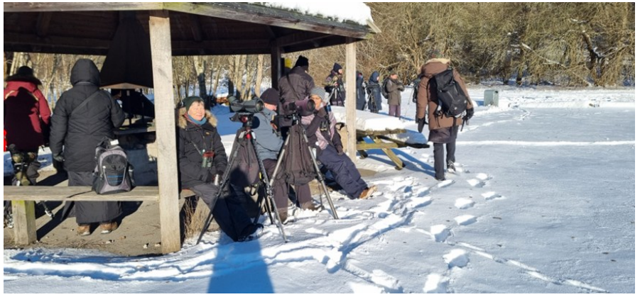
Lunch i dalen

Efter Världens ände bar det av inåt i landet, till Fyledalen. Här var förväntningarna att få se rovfåglar, inte minst kungsrör. När vi kom fram var den "vanliga" utkiksplatsen upptagen, en av bilarna som stod där hade kört fast. Vi beslöt oss för att åka ner i dalen för lite lunch och sedan ta oss tillbaka upp till utkiksplatsen. Sagt och gjort, vi avnjöt en god lunch på rastplatsen i dalen, och fick som bonus en väldigt ljus ormrör (så kallad börringevrör) som slog sig ner på en gren alldeles framför oss. Ett fint obs!