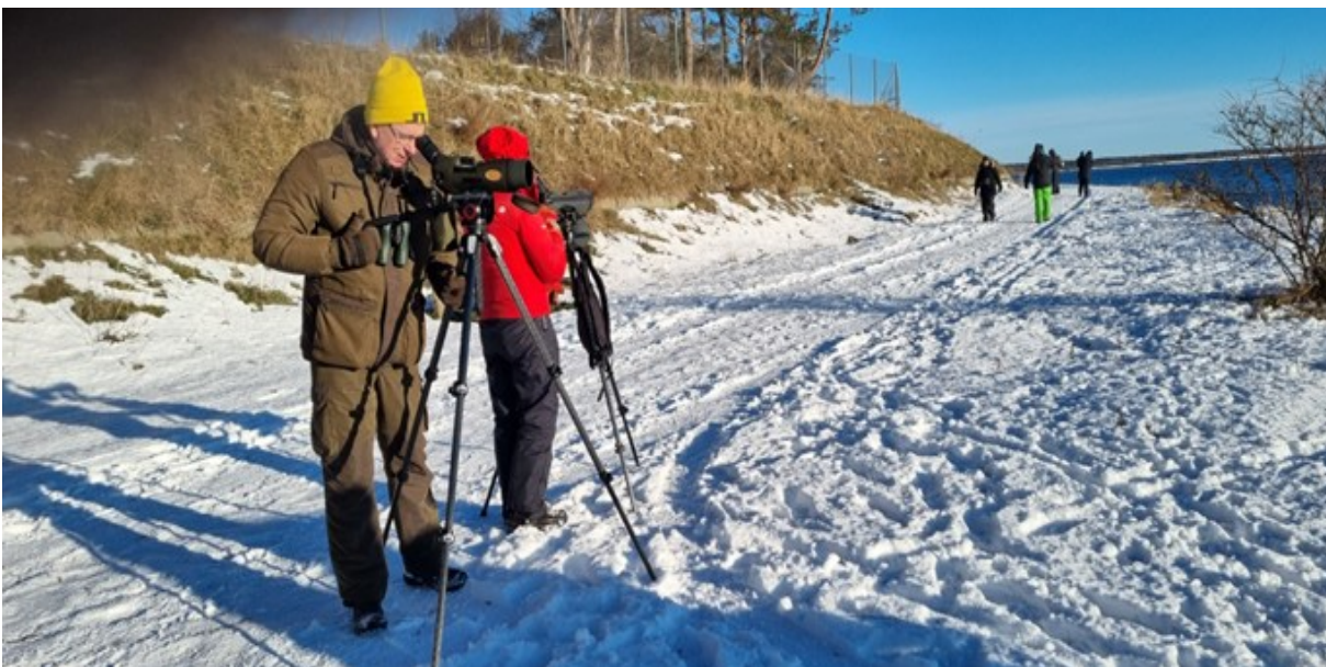
I lä vid Världens ände