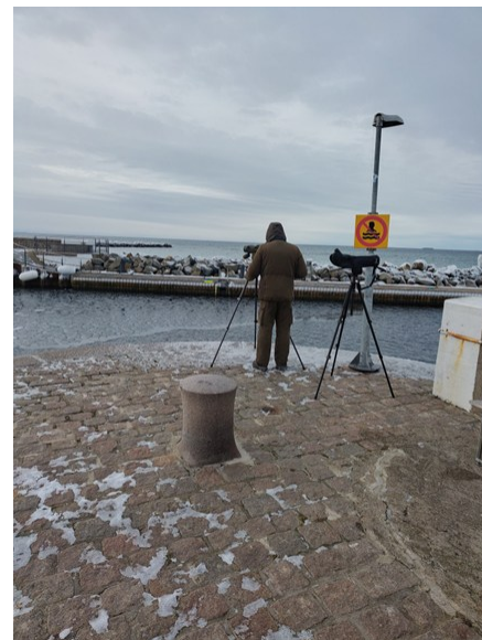
Seriös skådare i Skanör

Med de dubbla målen att få se praktejder och inta lunch tog Några av oss prioriterade lunchen och fick som belöning se en skärpiplärka som for omkring längs muren och kajkanten framför oss. Ett par andra agerade som mer seriösa fågelskådare och prioriterade att spana av hamnområdet efter praktejden, men utan resultat. Tyvärr fick i slutänden varken de eller lunchrastarna se någon praktejder under stoppet i hamnen. Istället fick vi nöja oss med skärpiplärkan samt bland annat ejder, småskrake, knölsvan, bläsand, en bergand, sjöorre, vigg och lite andra änder och måsar och trutar.