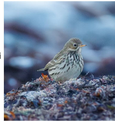
Ängspiplärka: Foto: Klas Reimers

Efter Torekov gick färden vidare mot Utvälinge. På ett fält vid infarten till samhället lyckades Mona få syn på en grupp raphönor. Vi fick backa och