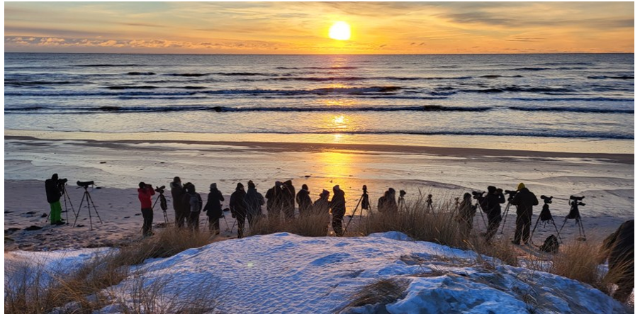
Skådning vid Sandhammaren i soluppgång

En solig men väldigt kall och blåsig morgon blev det. Vi fick ändå in lite sjöfågel som alfågel, sjöorre, stjärtand. Vi hade också en grupp med 20–30 stycken vinterhämpingarna som flög förbi.